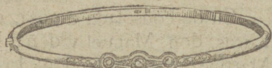
Núm. 3.—Tres brillantes y diamantes.