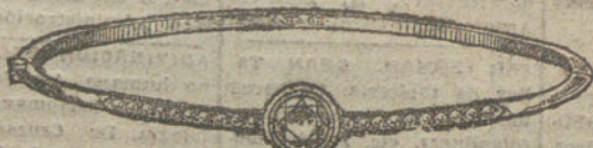
Núm. 16.—21 brillantes.