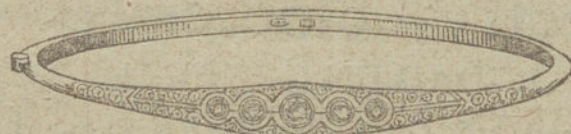
Núm. 9.—Cinco brillantes y diamantes.