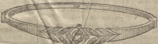
Núm. 14.—Cinco brillantes y diamantes.