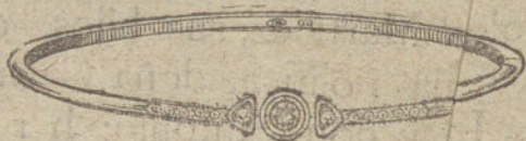
Núm. 2.—Tres brillantes y diamantes.