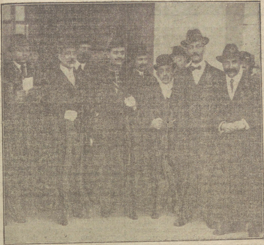
DESPUES DE LA CRISIS.—Los nuevos ministros saliendo de Palacio después de la jura.