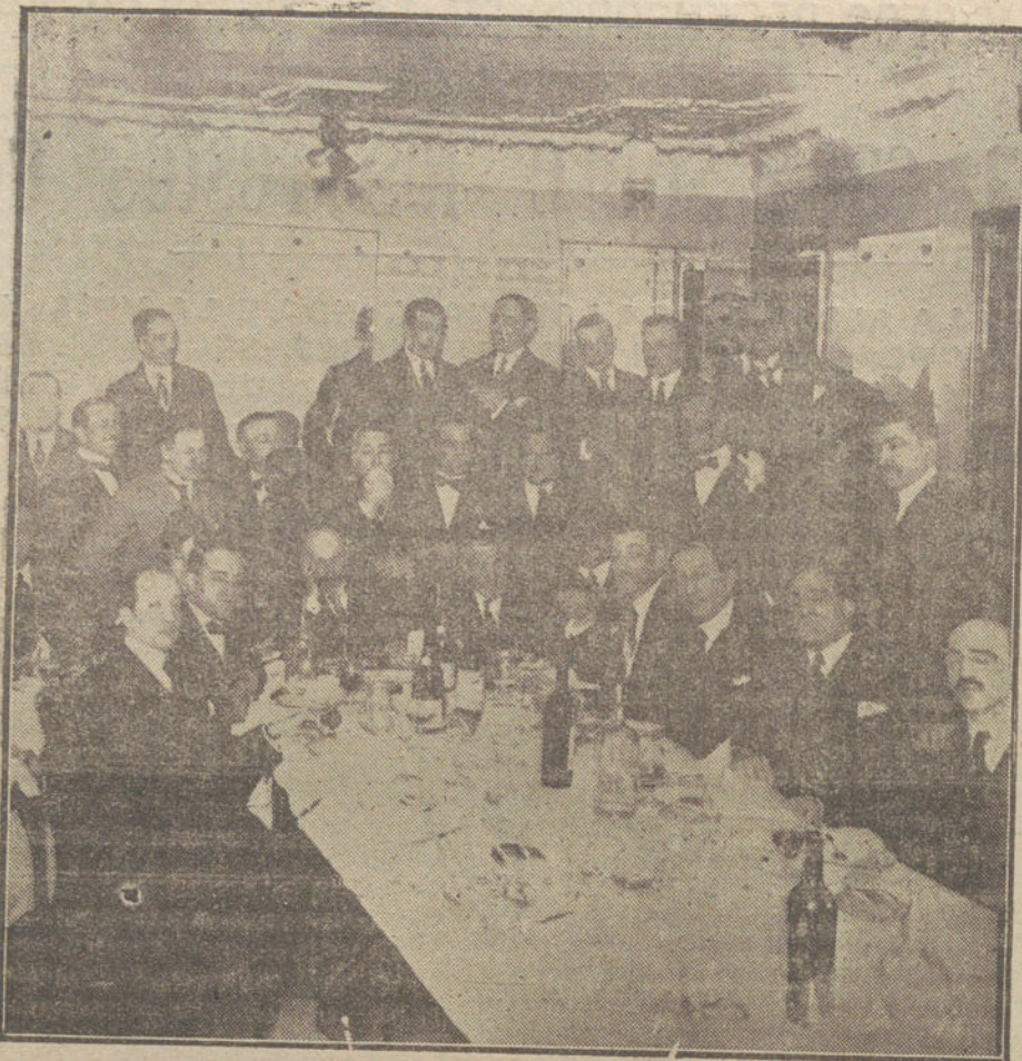
Banquete íntimo ofrecido anoche a Jacinto Benavente por un grupo de admiradores suyos para celebrar su triunfo electoral.

BILBAO. Dicen desde Copenhague dando nuevos informes del «Krotz Men»