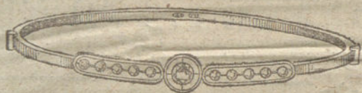
Núm. 7.—Tres brillantes y diamantes.