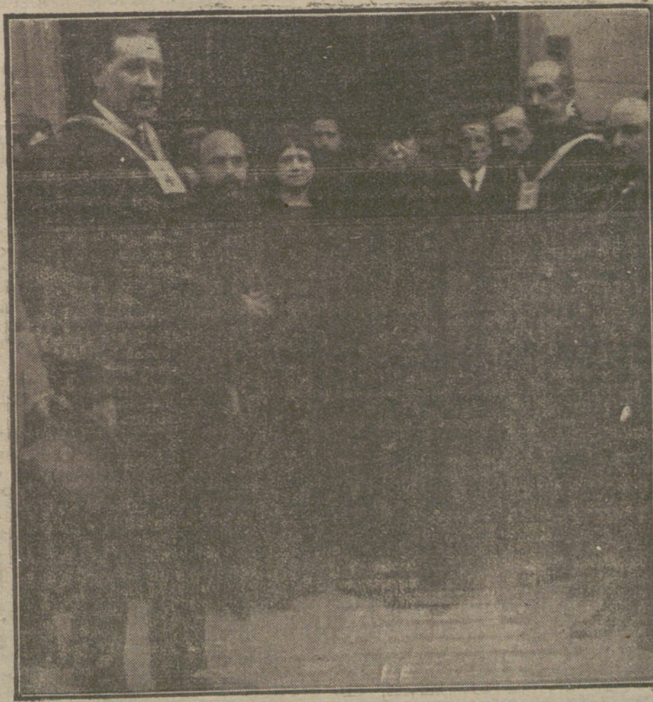
S. M. la Reina Cristina saliendo de visitar la Iglesia de Jesús, en el tradicional primer viernes de Marzo.