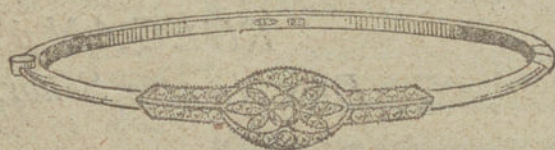
Núm. 6.—Un brillante y diamantes.