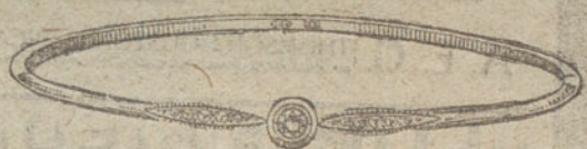
Núm. 1.—Un brillante y diamantes.