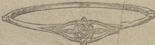
Núm. 5.—Un brillante y diamantes.