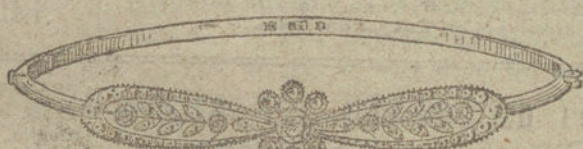
Núm. 12.—Once brillantes y diamantes.