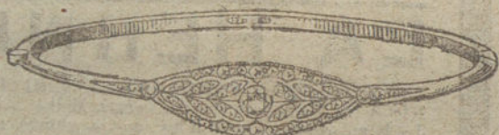
Núm. 4.—Un brillante y diamantes.