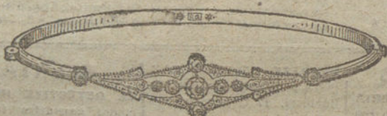
Núm. 10.—Siete brillantes y diamantes.