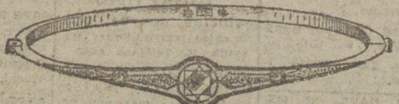
Núm. 18.—Tres brillantes y diamantes.