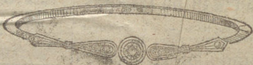
Núm. 8.—Un brillante y diamantes.