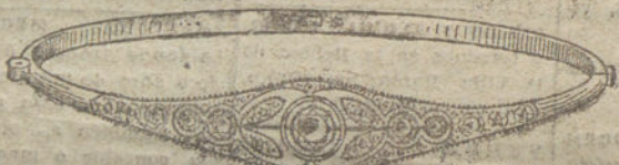
Núm. 13.—Cinco brillantes y diamantes.