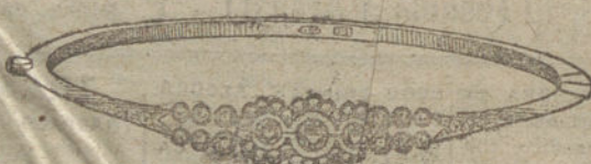
Núm. 11.—Tres brillantes y diamantes.