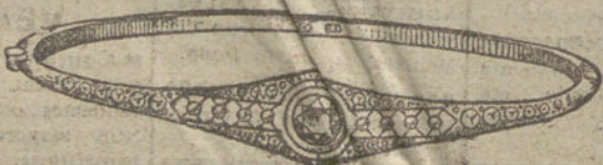
Núm. 17.—Nueve brillantes y diamantes.