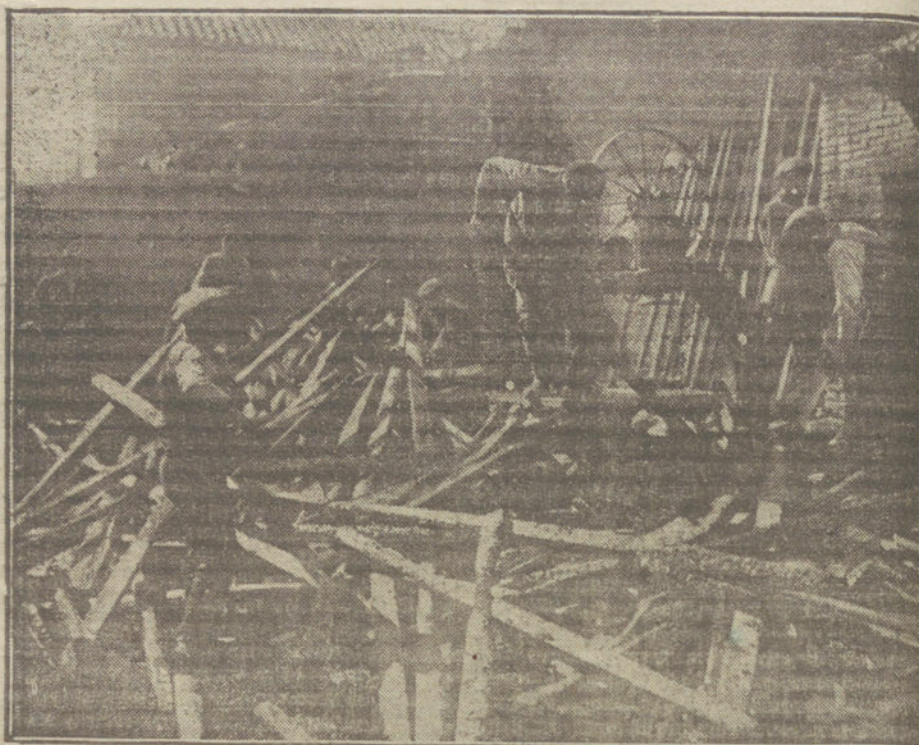
Estado del almacén de maderas de la calle de Ayala, destruido por un violento incendio.