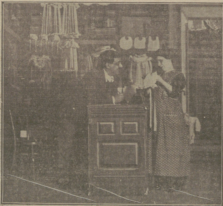
Una escena de «La canastilla», obra estrenada anoche en el teatro Cómico.

Con la institución del Tribunal internacional—añade Lansdowne—es improbable que la neutralidad de Bélgica pueda ser violada como Hertling lo teme. Hay un acuerdo fundamental en los cuatro principios sobre necesidad de un Tri-