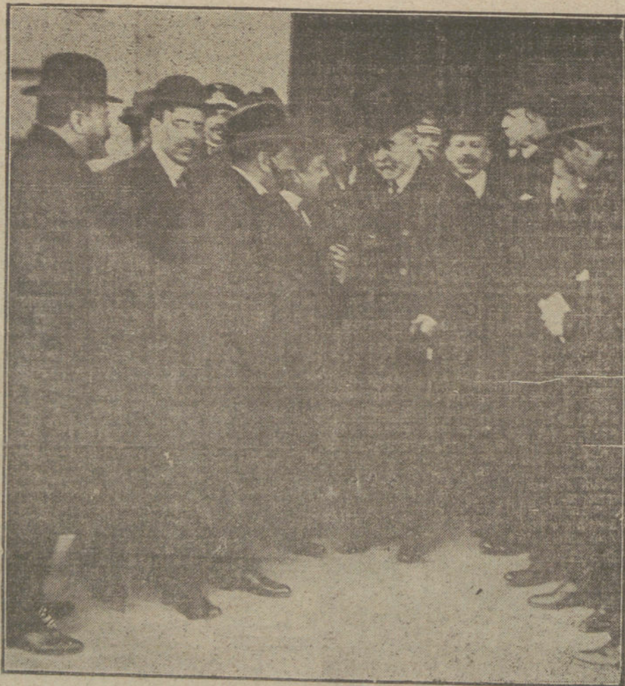
Los ministros de la Guerra y Marina, á la puerta de Palacio, conversando con los periodistas al salir de la conferencia celebrada esta mañana con el presidente del Consejo, á la que se atribuye gran importancia en los Centros políticos.