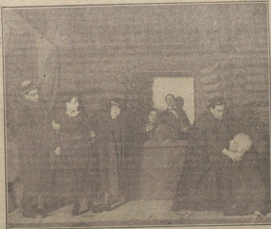
Una escena de «La marca infame», obra estrenada anoche en el teatro de Cervantes.

Por tanto, el Gobierno ruso dispuso no sólo de tres días sino de seis semanas, más tres días, para decidirse por la aceptación o rechazo de las condiciones de paz. A esto hay que añadir los debates de Enero y Febrero