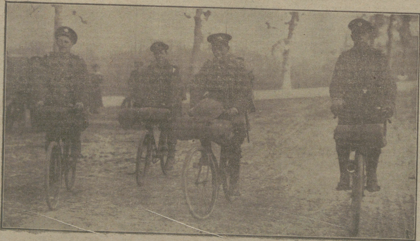
ASPECTOS DE LA GUERRA.—Avanzada ciclista del Ejército inglés, durante un reconocimiento por el frente de Flandes.

5.º El Gobierno rumano se obliga á desmovilizar inmediatamente, por lo menos, ocho divisiones de su Ejército. La dirección de la desmovilización se efectuará en común por el Al-