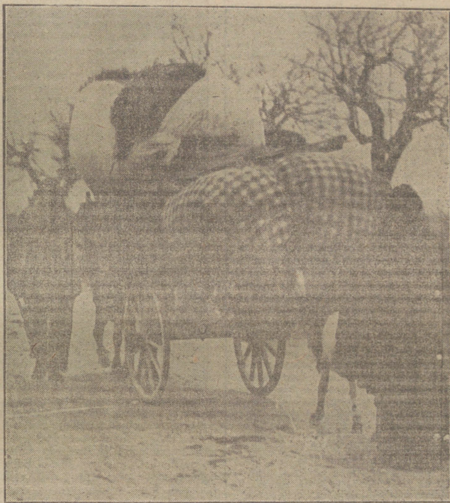
DESPUES DE LA PAZ.—Aldanos rusos fugitivos regresando a su pueblo, después de firmado el armisticio.

tunda negativa a los astutos planes del Gobierno del Mikado, y una legítima suspicacia con respecto a la finalidad de expansión y conquista que persiguen los japoneses con esta aventura.