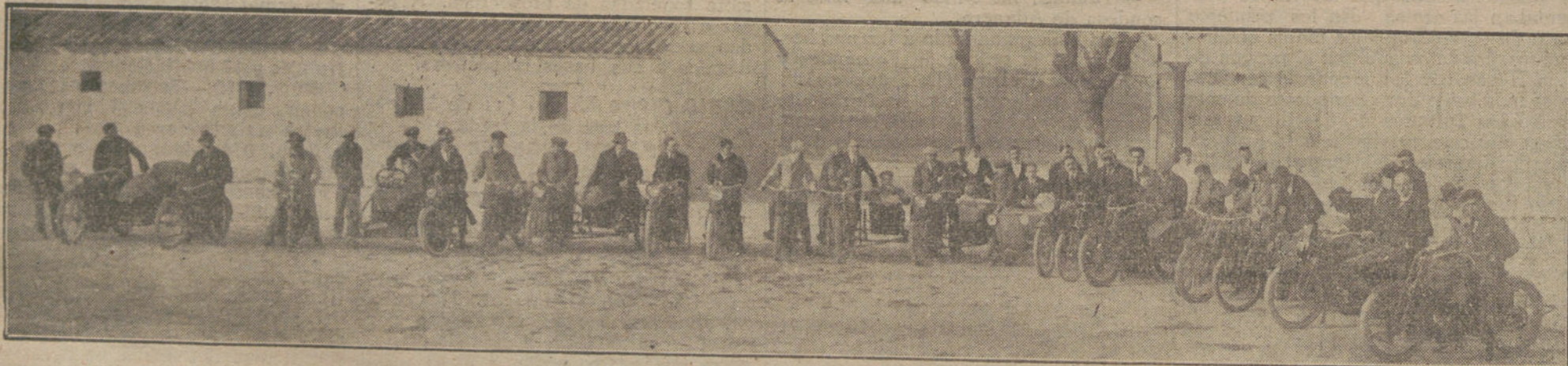
Grupo de «Harley-Davidson», que tomaron parte y vencieron en la prueba «Tortuga», celebrada en Madrid.