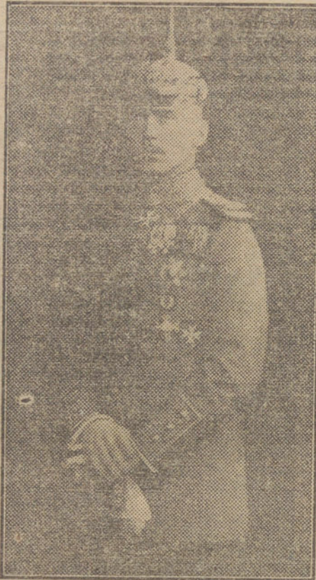
Príncipe Oscar de Prusia, de quien se dice será nombrado Rey de Finlandia.

La publicación del Tratado de alianza entre Francia y Rusia (del Zar), fué pedida de nuevo en la Cámara francesa. El diputado Renaudel hizo constar que Ribot prometió en otro tiempo