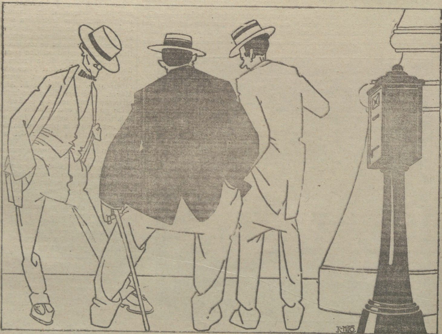
—¿Qué se dice del Gobierno? No había caído ya? —Sí; pero lo ha levantado el marqués de Alhucemas.

Muchas, muchísimas personas han desfilado ante los bronceos, las pinturas y los documentos reunidos y expuestos por los Amigos del Arte; pero la mayor parte de ellas no han visto la Exposición como debe verse.