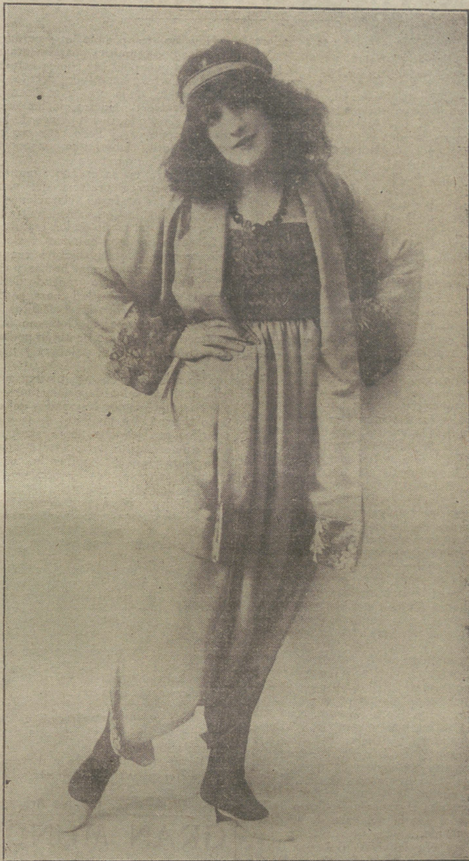
Pijama, estilo turco, modelo de la casa Fanny.