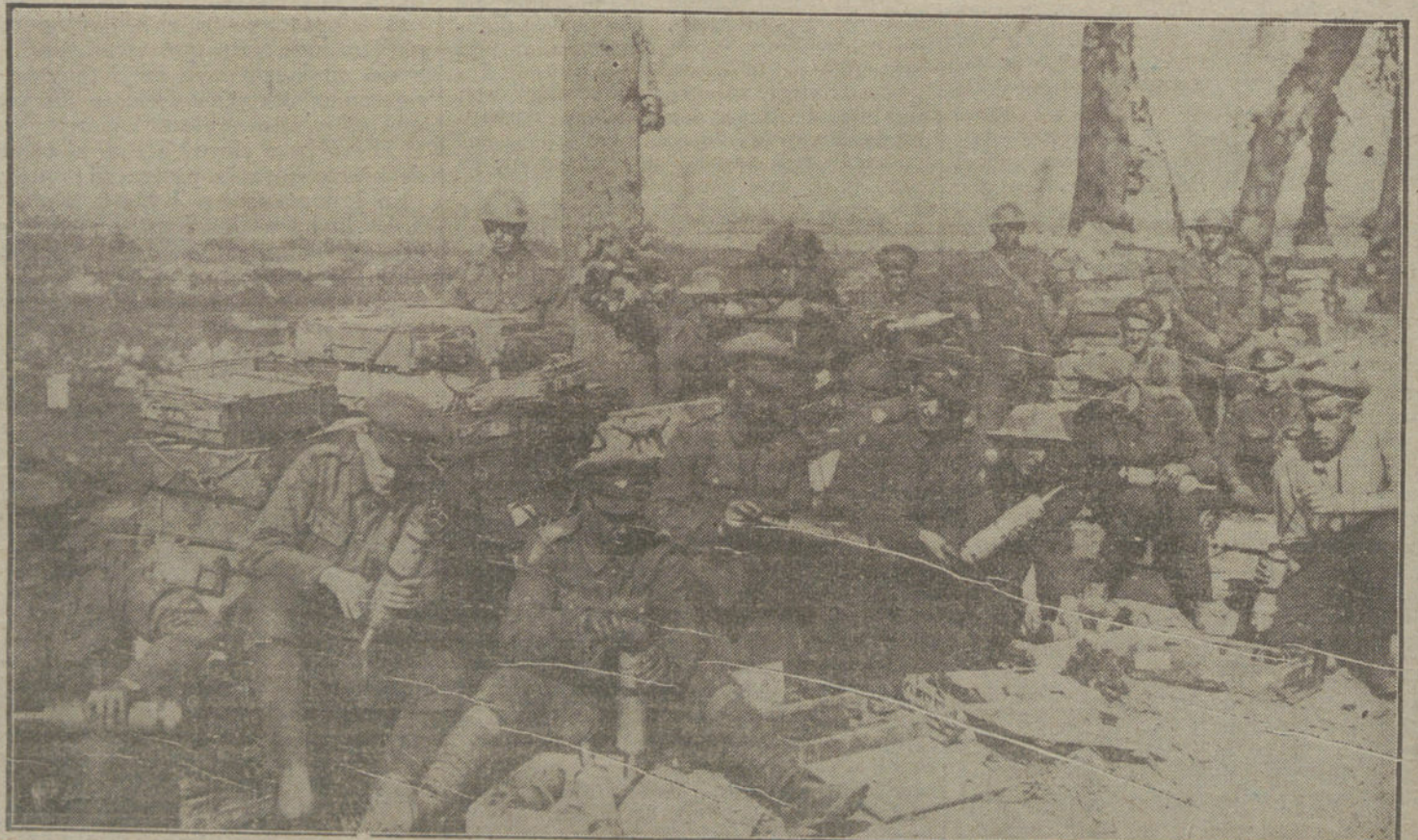
Soldados ingleses preparando bombas de mano, de las que se emplean en la lucha de trincheras.

Un detalle interesante de los medios de que se vale la Entente para provocar el descontento y desórdenes en países neutrales, lo ofrece el siguiente