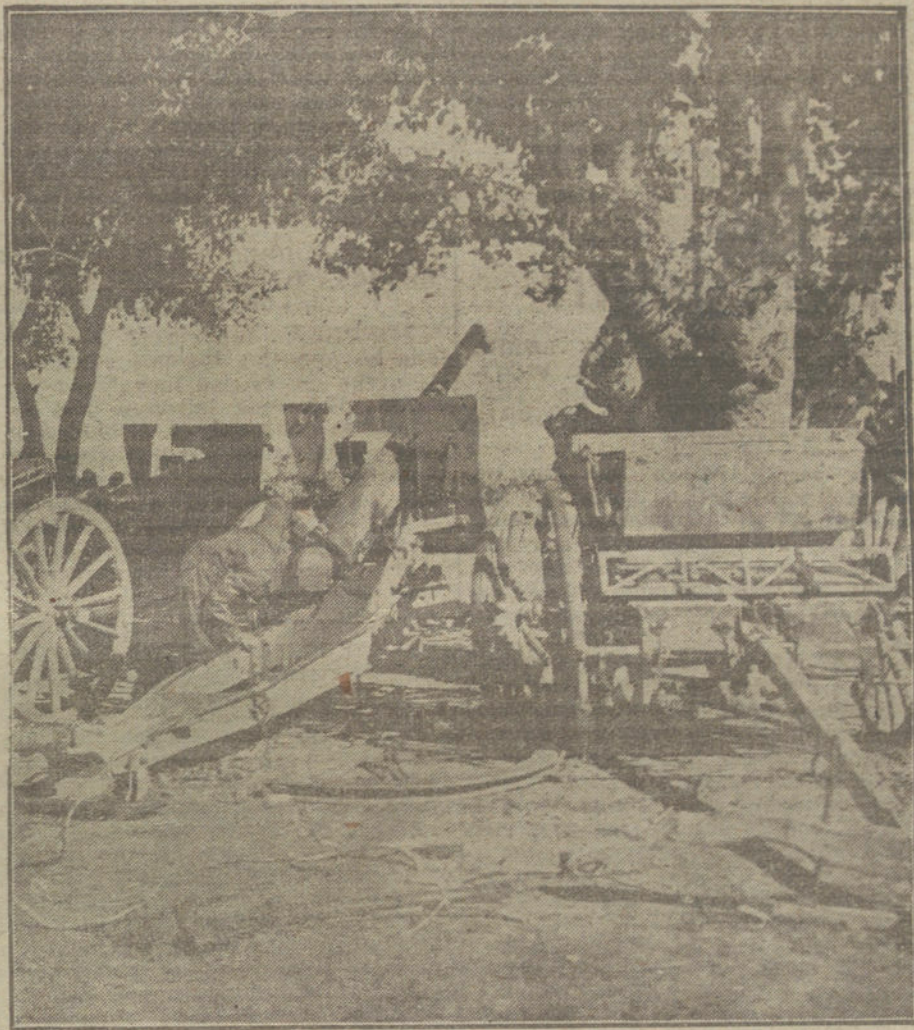
LA GUERRA EN EL FRENTE OCCIDENTAL.—Baterías francesas refugiadas en el sector de un bosque.

«Le Journal du Peuple» comenta también dicha carta y defiende categóricamente el derecho de los franceses a pensar en la paz, sin que por ello pueda calificarse de «boches». «Pensamos en la paz—dice—porque somos, en primer término, franceses, y además, porque el principal objetivo de la