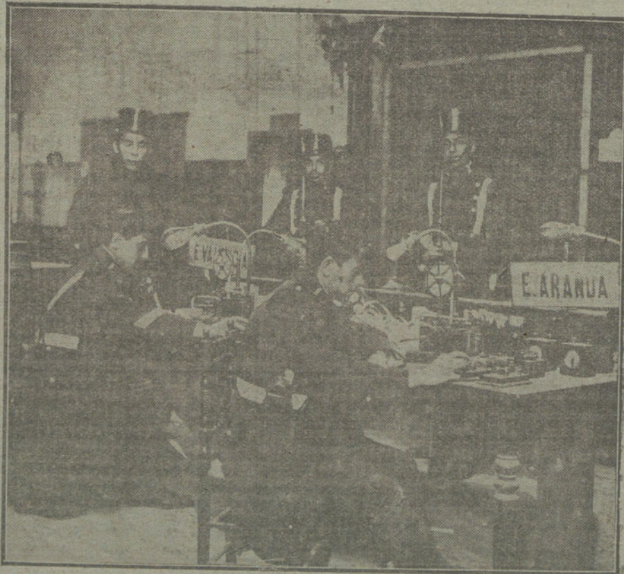
Una de las dependencias de Telégrafos servidas por personal del Ejército.

En el mencionado departamento, como igualmente en las escaleras y pisos superiores, había varios números de la Guardia civil. En la puerta principal estaban cuatro números de la Benemérita y cuatro agentes de Vigilancia,