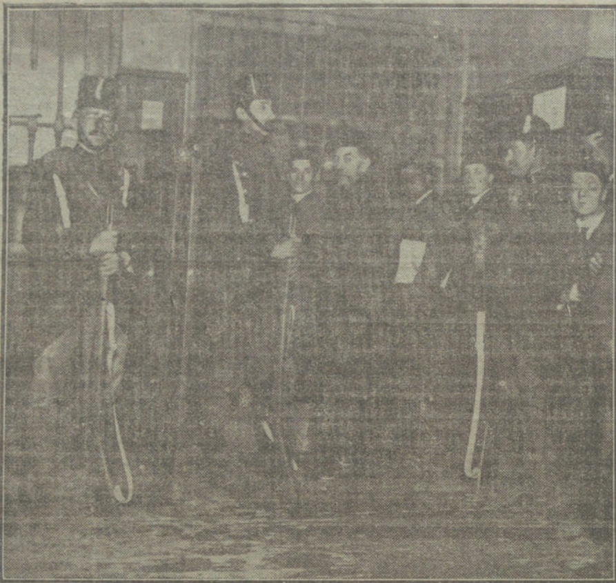
La ventanilla de certificados de la Central de Correos, vigilada por la fuerza pública.

Entre tanto se llega á una perfecta organización en el servicio, los despachos, así oficiales como particulares, se transmitirán por teléfono, y para aquellas provincias que, como las Canarias y Baleares, no tengan comunicación