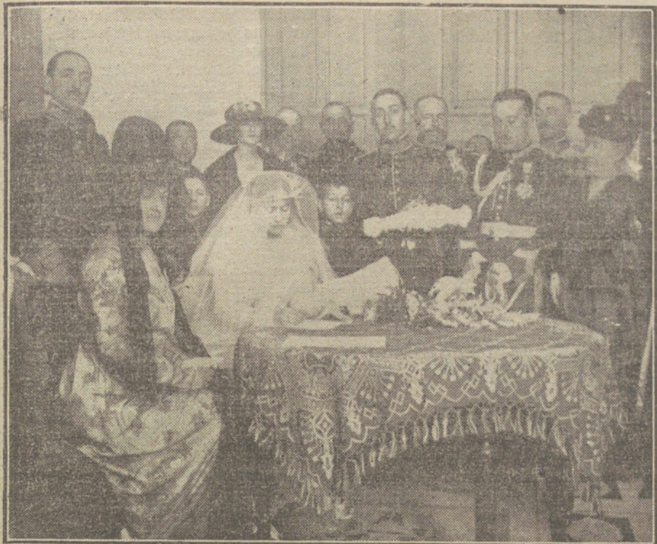
Boda de la duquesa de Algete con el marqués de Vallecarrato. Momento de firmar las actas.

propia respuesta a Wilson del 11 de Enero del año anterior, hubiese dictado a Alemania, pero especialmente a Austria-Hungría y Turquía, si éstas hubieran sido vencidas. Lo que ahora se disgrega del Imperio ruso, no es, en realidad, territorio propiamente ruso.