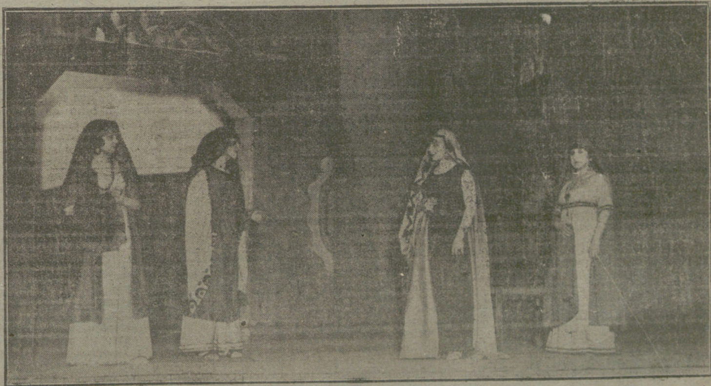
Una escena de «El hijo pródigo», obra estrenada anoche en el teatro de Eslava.

Los ministros de Hacienda, Fomento y Gobernación dieron cuenta de las instancias que les habían dirigido las Juntas de sus respectivos departamentos, y el acuerdo que el Consejo adoptó fué el de que los ministros mencionados dicten las oportunas Reales órdenes, que son las que se han publicado en la «Gaceta».