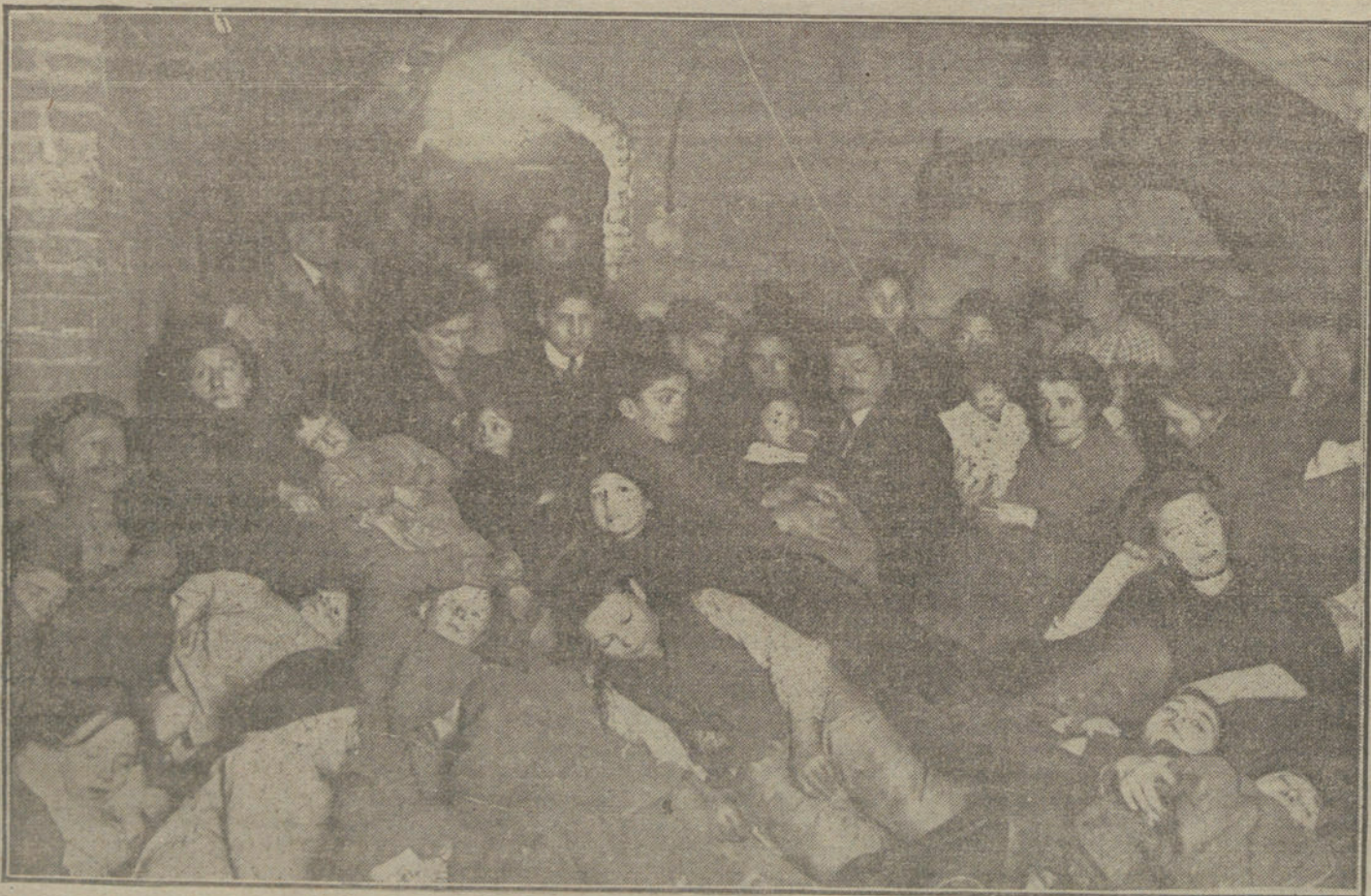
LOS ESTRAGOS DE LA GUERRA EN FRANCIA.—Familias refugiadas en un sótano, huyendo del peligro de las bombas.

El periódico danés «Sozialdemokraten» escribe, con ocasión del aniversario de la revolución rusa: «Es una gran hipocresía el que la Prensa de la Entente se lamente estos días de la «repentina paz forzada» de Brest-Litowski. Esta ha sido una paz benigna en comparación con la que la Entente, según su