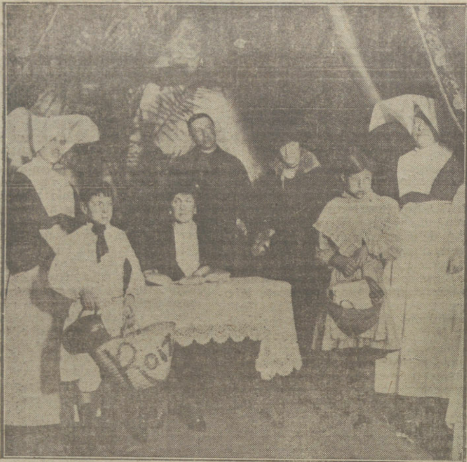
S. M. la Reina Victoria en el reparto de comidas a los pobres, verificado esta mañana.