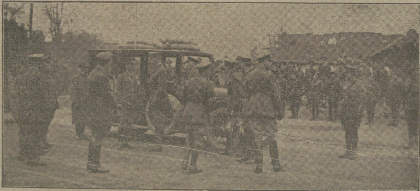
LOS JEFES DE ESTADO EN LA GUERRA.—El Rey de Bélgica, disponiéndose a ir al frente de Flandes.

NUEVA YORK. Comunican desde Washington que los Estados Unidos é-