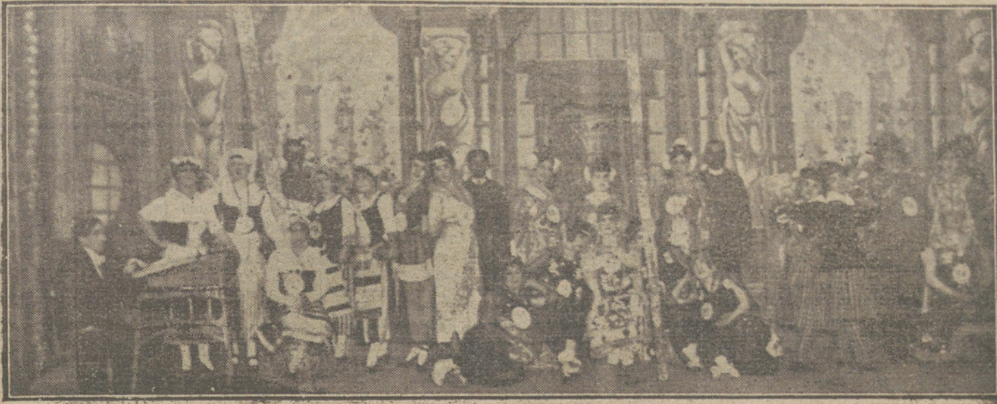
Una escena de «El monte de la belleza», obra estrenada anoche en el teatro Martín.

Inglaterra han reformado definitivamente a Holanda que en el caso de no ser aceptados hasta el día 15 del actual los Convenios pendientes con los aliados, éstos se apoderarían de barcos, con objeto de hacer uso de ellos.