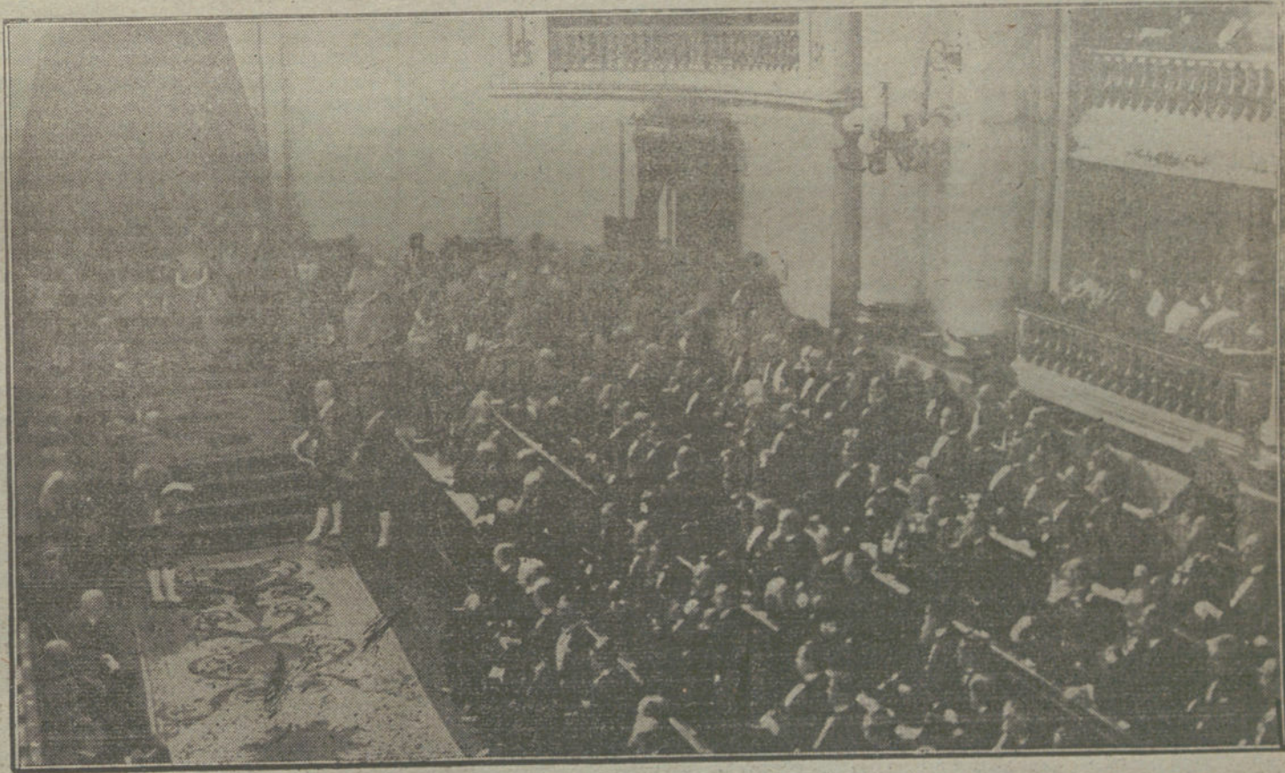
Aspecto del salón del Senado durante la sesión regia de apertura del Parlamento.

«Carroza Ducal»: Conducía esta carroza á los jefes de Palacio, marqueses de la Torreclilla y de Viana, acompañados por el gentilhombre de guardia, duque de Maqueda.