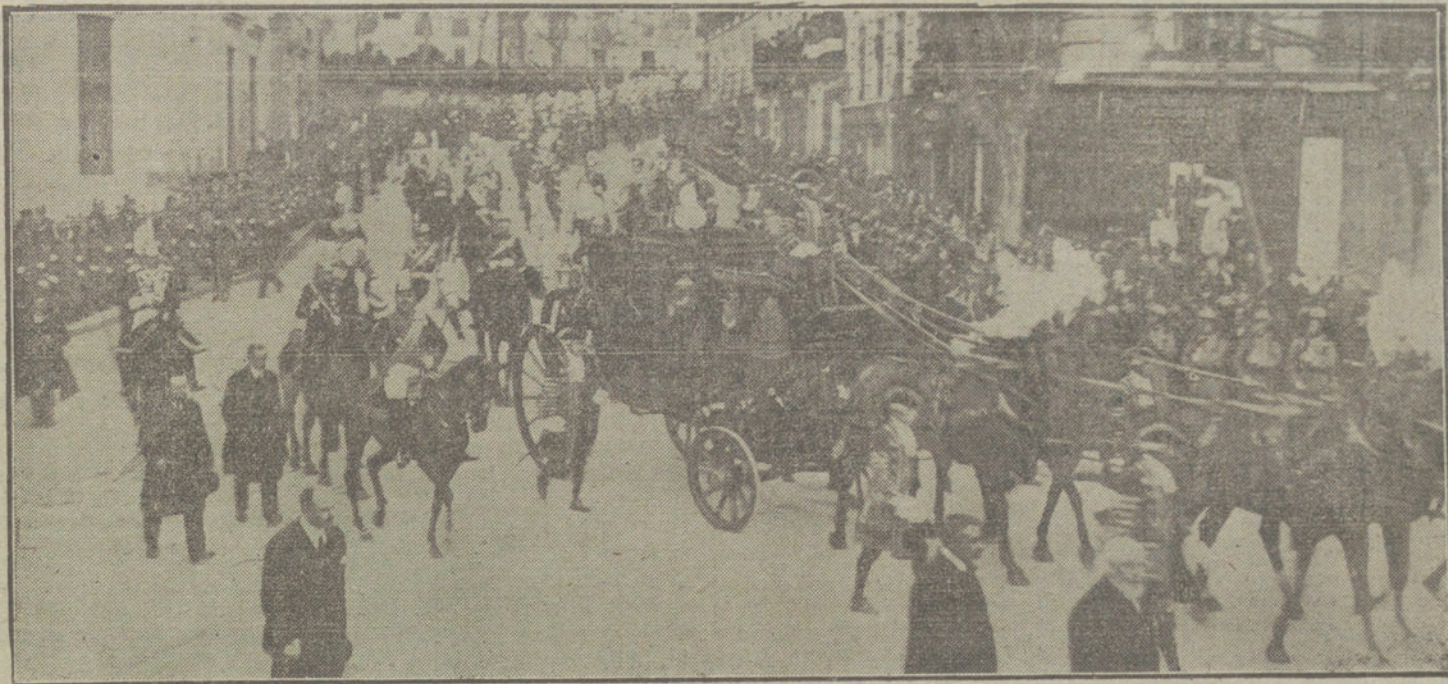
La comitiva regia dirigiéndose al Senado, donde ha tenido lugar esta tarde la solemne apertura de las Cortes.