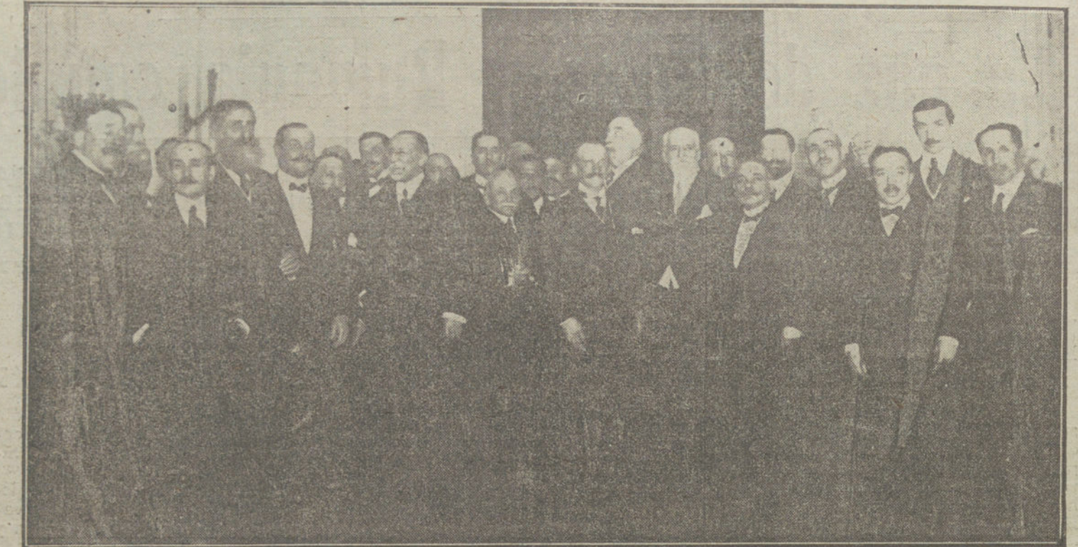
Grupo de senadores y diputados que asistieron a la reunión celebrada ayer tarde en casa del conde de Romanones.

El cornejo X, en «Le Gaulois», dice que es cada vez mayor su convicción de que