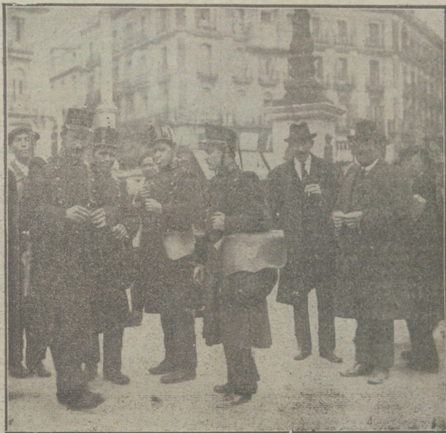
EL CONFLICTO DE LAS COMUNICACIONES.—Soldados destinados al servicio postal de los tranvías de la Puerta del Sol.

Los volantes de fe de vida para pensionistas y jubilados se facilitarán en la misma Tenencia de Alcaldía, previo pago del timbre municipal de 0,25 pesetas.