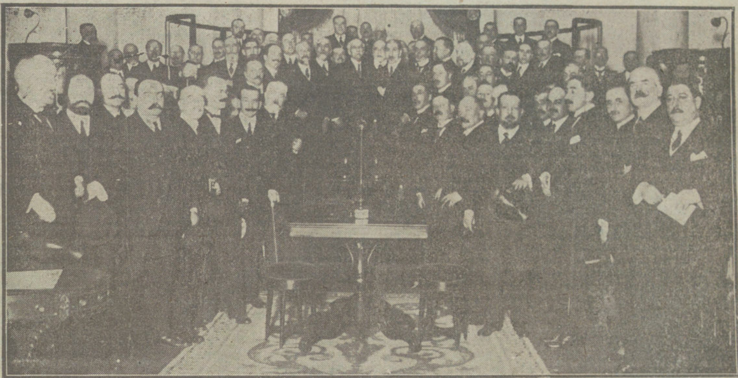
Grupo de senadores y diputados que han asistido á la reunión celebrada esta tarde en el Senado, bajo la presidencia del Sr. Dato.