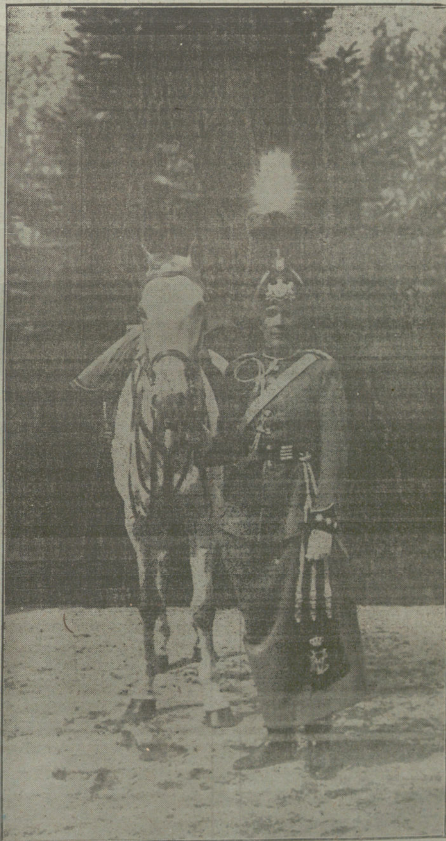
S. M. la Reina Victoria en traje de coronel del regimiento de Caballería que lleva su nombre. y que hoy se ha puesto por primera vez.