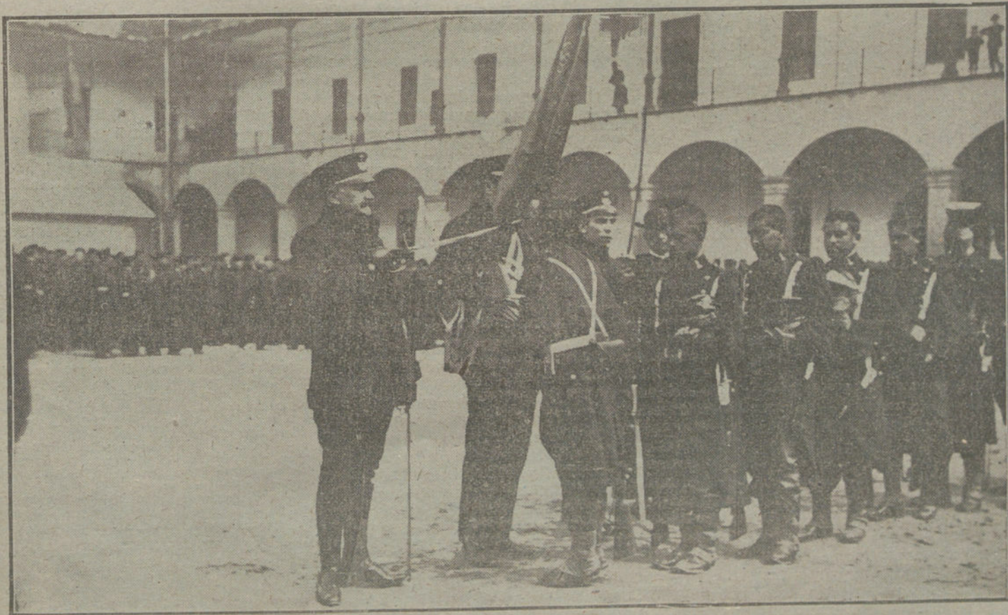
Acto de jurar la bandera los nuevos reclutas del regimiento de Ingenieros, ceremonia verificada ayer tarde.

Y séptima y última. Que como Montero siente ante todo y sobre todo el arte al por mayor y sin música, más bien que con música y por secciones, en el Español se queda, para bien del arte Del Arte, con mayúscula, ¿estamos?