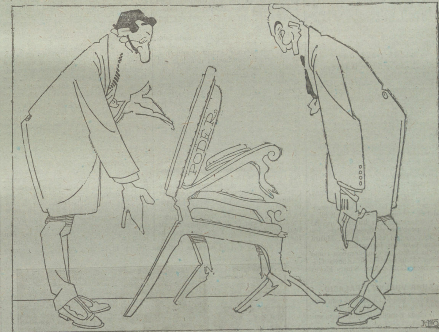
VISITA DE CUMPLIDO

Es cierto que casi todos los prohombres consultados aconsejaron á S. M. un Gobierno Maura. Pero un Gobierno