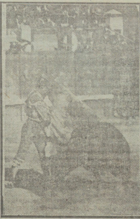
Joselito en un quite.

Joselito veroníquea. Y aunque el bicho no dobla por babor, y por estribo igualmente, Gómez consigue apuntar un par de lances de gran artista. Luego, en el primer quite, alborota nuevamente á