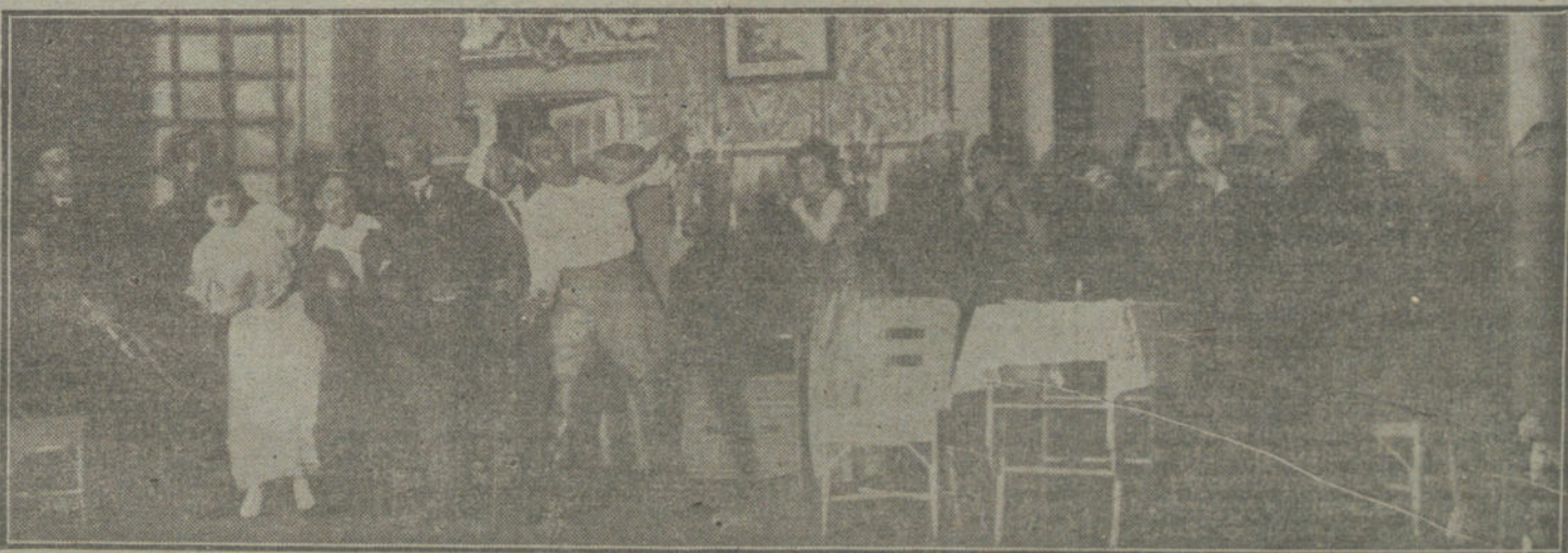
Una escena del juguete cómico «Un lio del otro mundo», es renado en el teatro de la Infanta Isabel.

Una pareja de Orden público acudió al lugar del suceso y detuvo al agresor, el cual fué conducido á la Comisaría, donde se instruyó el correspondiente atestado, que en unión del detenido pasó más tarde al Juzgado de guardia.