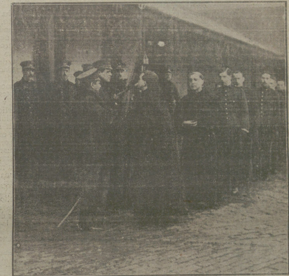
LA JURA DE LA BANDERA EN SAN SEBASTIAN. — Religiosos jurando la bandera en el cuartel del regimiento de Sicilia.

Los cálculos fueron, sin embargo, una vez más erróneos, porque no contaron con un elemento imponderable, cual es la fuerza espiritual, y los austrohúngaros defendieron con tenacidad