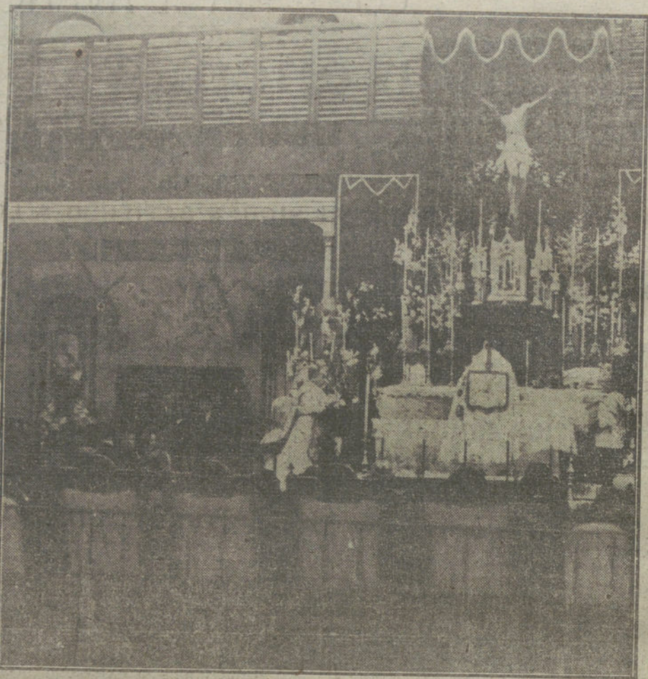
Solemne función religiosa verificada esta mañana en la Cárcel Modelo, con motivo de la fiesta de San Dimas.

PARIS. De Bucarest participan que el ministro de Negocios Extranjeros, Arlon,