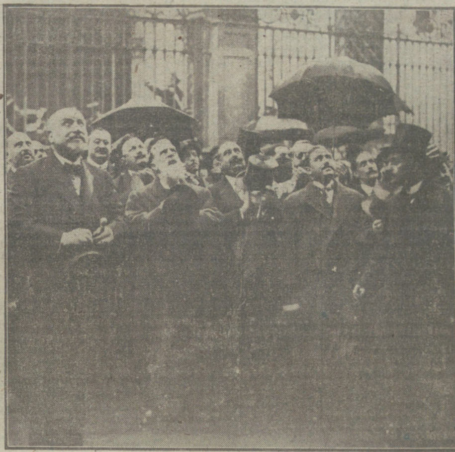
El Ayuntamiento, la Comisión de la Sociedad de Autores y otros invitados que han asistido al descubrimiento de la lápida del maestro Chapí, acto verificado esta tarde.

A las cuatro de esta tarde se ha efectuado el acto de descubrir en la casa número 20 de la calle del Arenal, la lápida a la memoria del insigne músico español D. Ruperto Chapí.