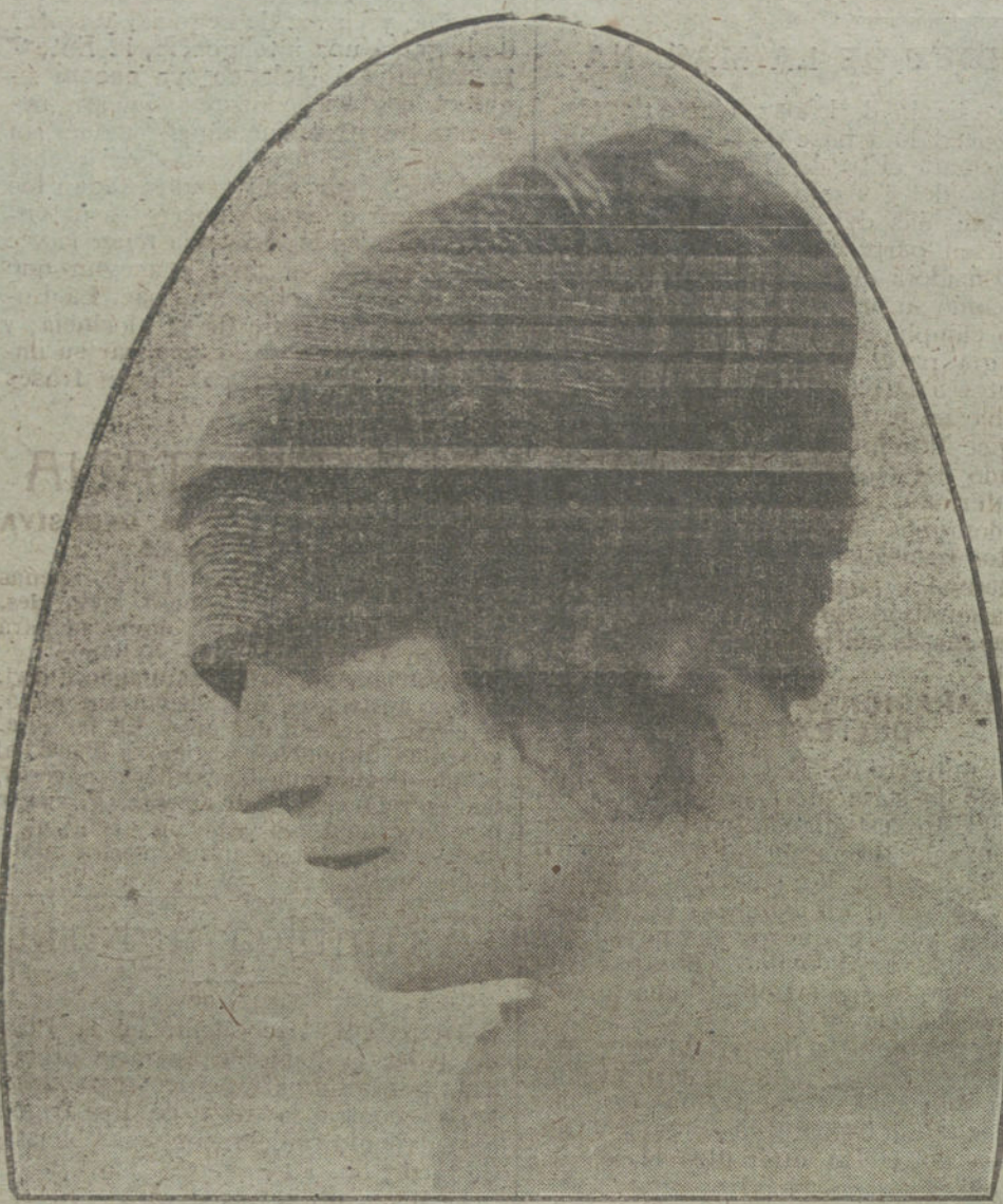
Elegante gorra de primavera, confeccionada con paja de maíz y plumas de gallo, modelo de la casa Martel.