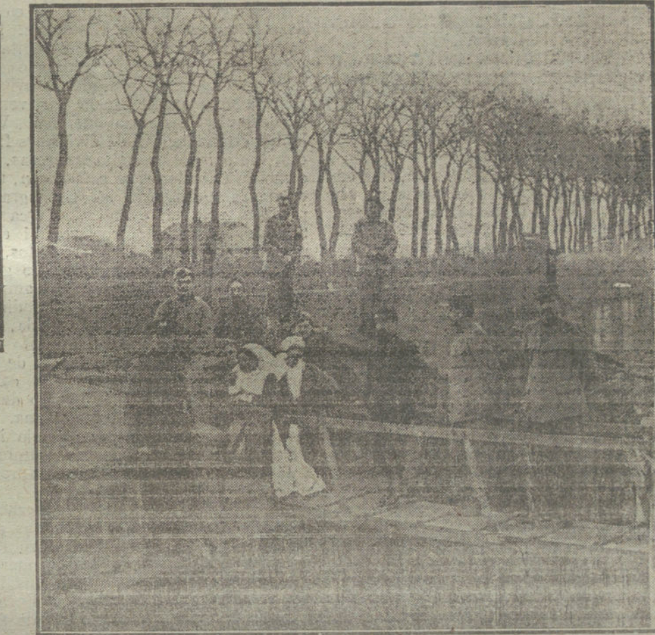
Barcaza del Sena, transformada en Hospital de sangre, para la asistencia de los heridos a consecuencia del bombardeo.

Del propio modo que en la guerra del Transvaal no vaciló en acometer aquellas concentraciones de mujeres y niños boers, sometiendo a la tortura criminal del hambre colectiva, también con el bloqueo indebido contra la población civil alemana creyó que quebrantaría la moral de sus deudos militares que luchaban en el campo del honor. Hemos dicho, y lo repetiremos, aunque al vulgo le conste hasta la saciedad, que semejante medida es contraria a las leyes internacionales, que con sana intención limitan el bloqueo a las plazas fuertes o ciudades de una región determinada de la costa y exige que el bloqueo sea efectivo, es decir, que se intercepte prácticamente con toda eficacia el tráfico que pueda