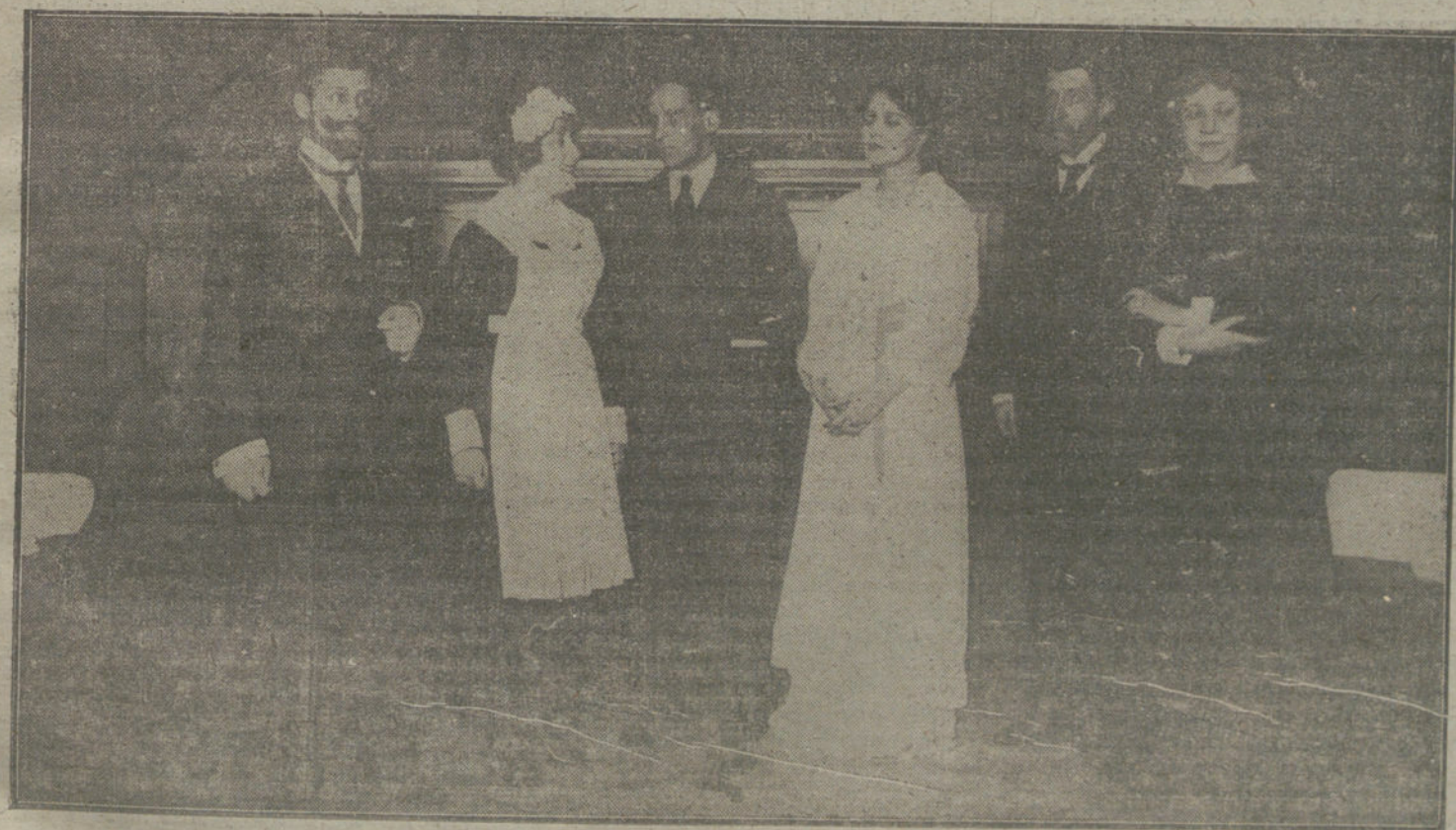
Los intérpretes de la tragedia de Unamuno «Fedra», que se representó ayer tarde en los salones del Aleneo.