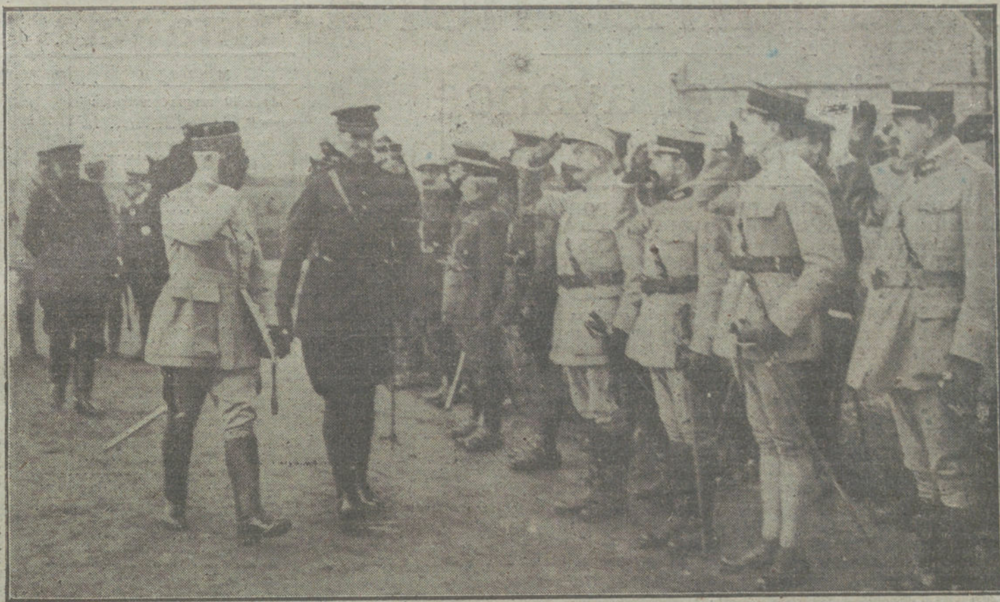
LOS JEFES DE ESTADO EN LA GUERRA.—El Rey de Bélgica, acompañado del general Pétain, pasando revista a las tropas belgas.