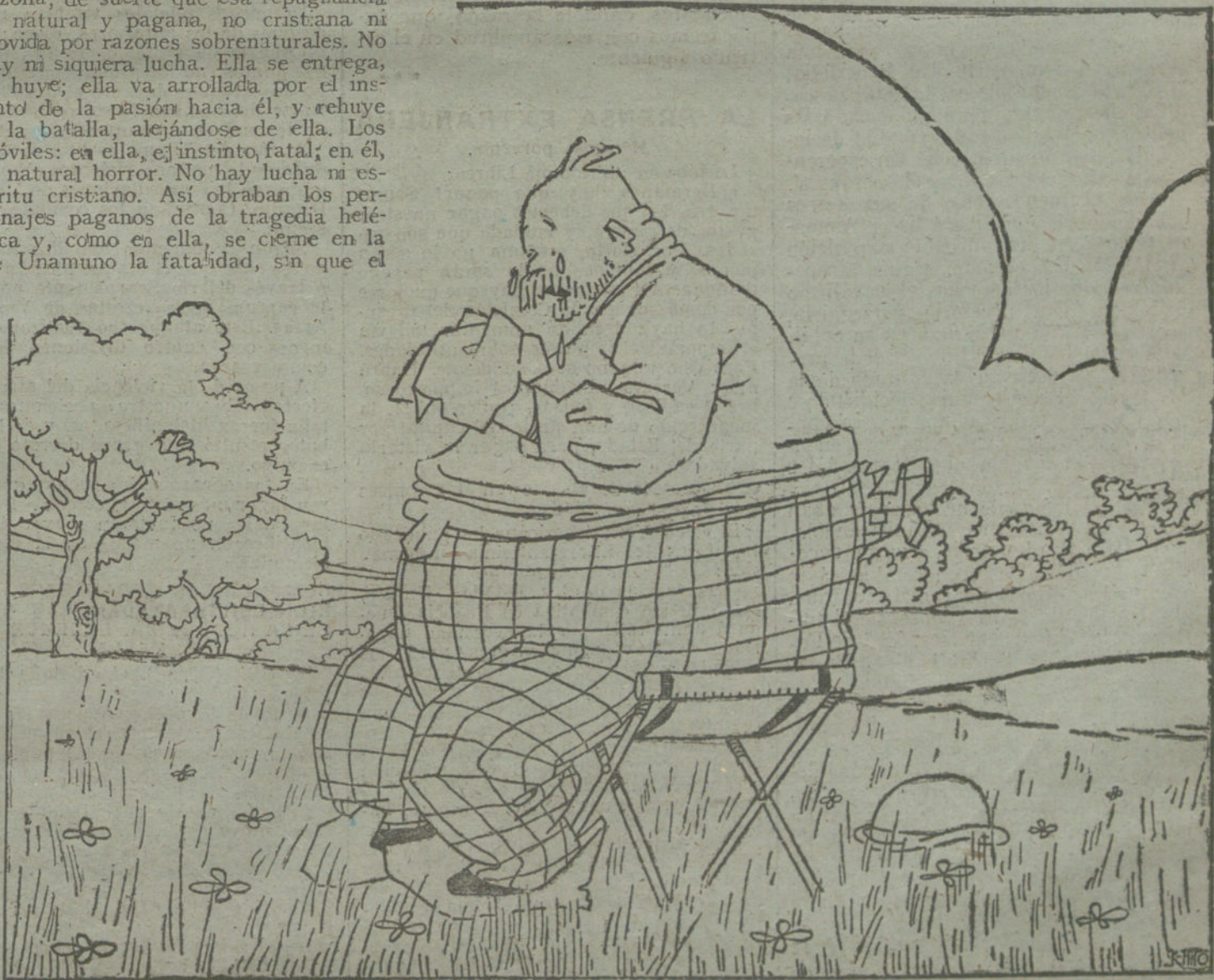
AIRES MURCIANOS «La alegría de la hueyita»

El Leonardo, por cuestiones de intereses, fué asesinado en la cocina de su casa por un sobrino. Este ha sido detenido.