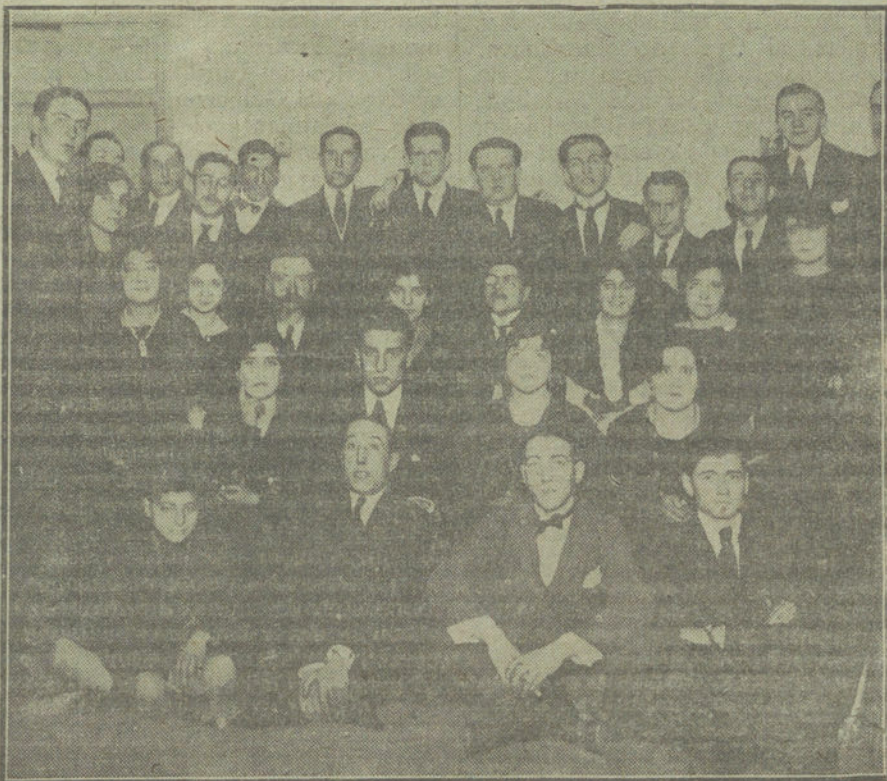
Inauguración del nuevo local del Centro Vasco-Navarro.

tico, con algunos de sus procedimientos; mas es una obra rara, porque la originalidad no se empaña con el empleo de normas ya creadas. Y es una farsa carente del «humour» á lo inglés, más airosa, bizarra, lírica y galante, como la corresponde por sus padres españolísimos. Sólo suenan algu-