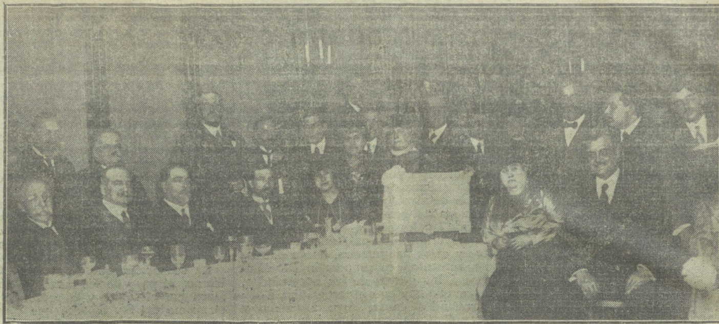
Homenaje ofrecido ayer tarde por los miembros de la reciente Asamblea de maestros al ex ministro Sr. Burrell.