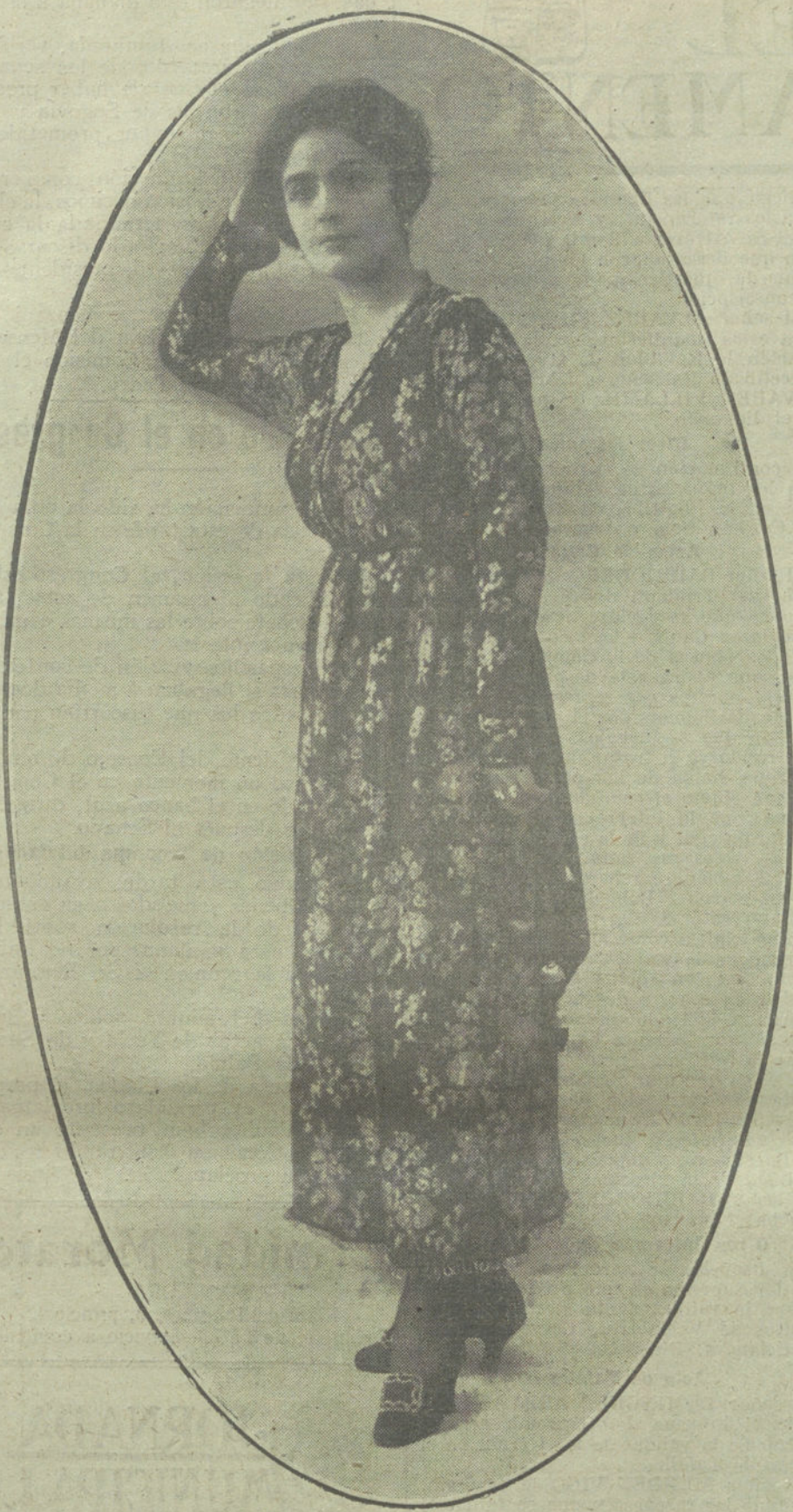
Elegantísima bata de seda japonesa, colores azul y oro. Modelo de Faregny.