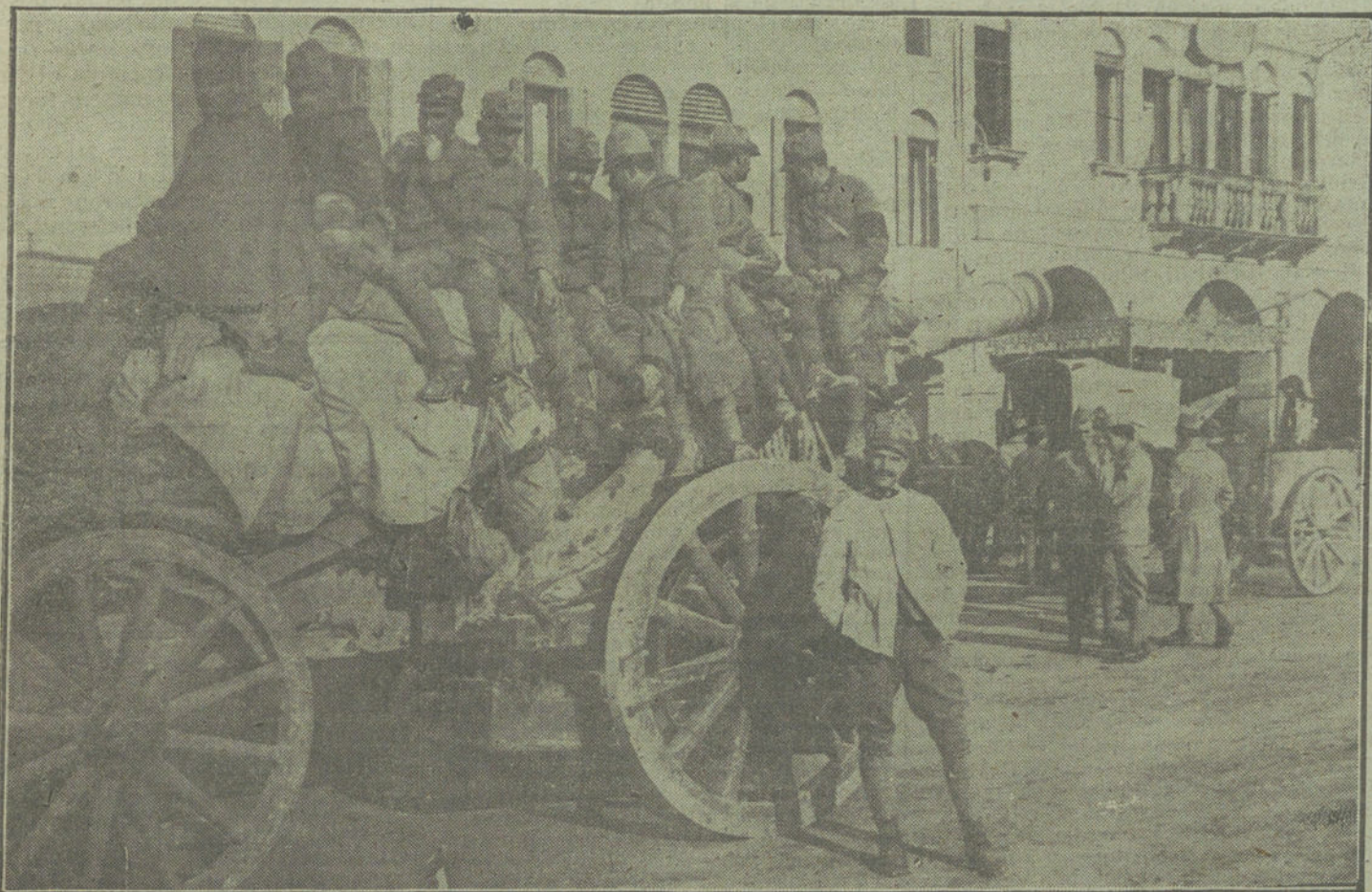
LA LUCHA EN EL FRENTE ITALIANO.—Soldados italianos trasladándose á la línea de fuego sobre una pinza de Artillería.