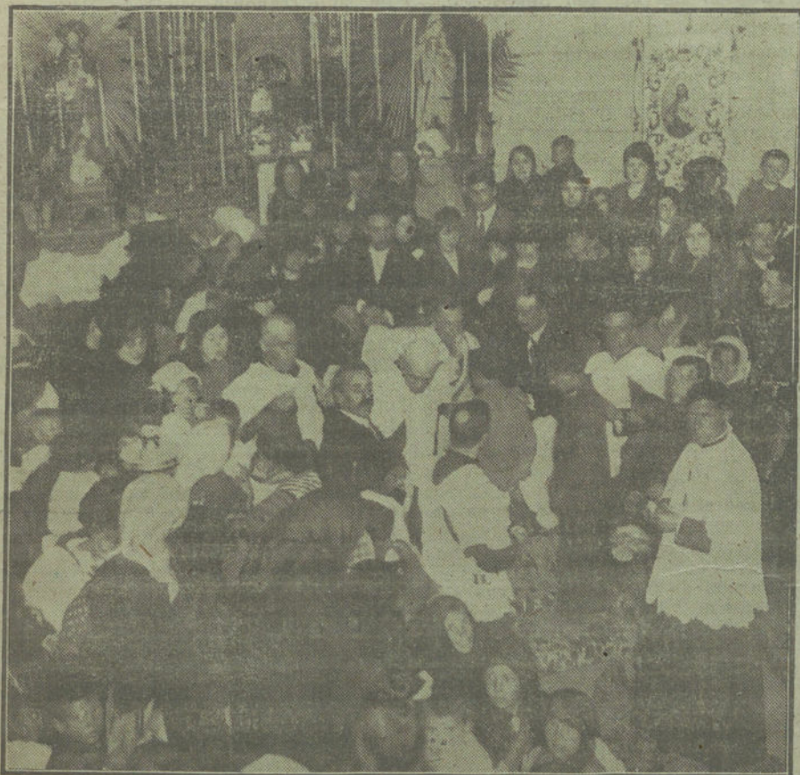
El obispo de Madrid administrando el sacramento de la confirmación a los niños de la barriada del Puente de Toledo.

Después se les sirvió a los soldados e invitados un «lunch» espléndido.