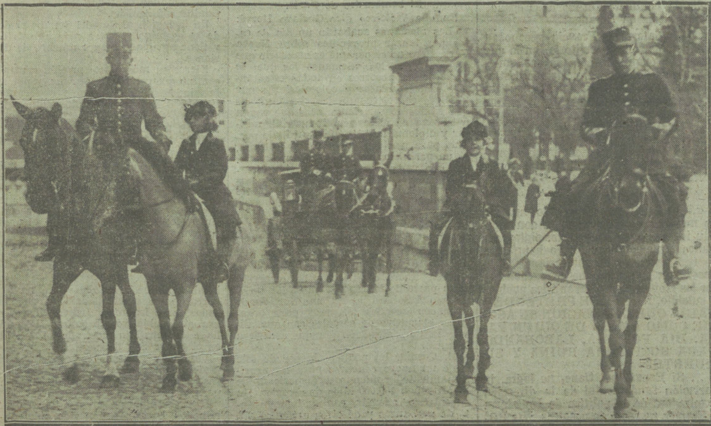
SS. AA. RR. las Infantas Beatriz y Cristina, al regresar á palacio, después de uno de sus paseos á caballo por la Casa de Campo.