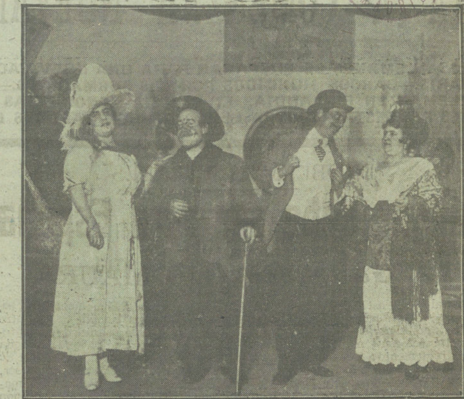
Una escena de la obra «Hagan juego», estrenada ayer en el teatro Cómico.

Por ese sistema la obra teatral resulta dura, durísima, tan dura como el férreo temperamento de Unamuno. «Esto se parece á lo de Echegaray», me dijo durante la representación un señor que no entiende de literatura, pero que cogió al vuelo el espíritu dramático de la obra. Es, efectivamente, echegarayesco. No en los lirismos románticos ni en