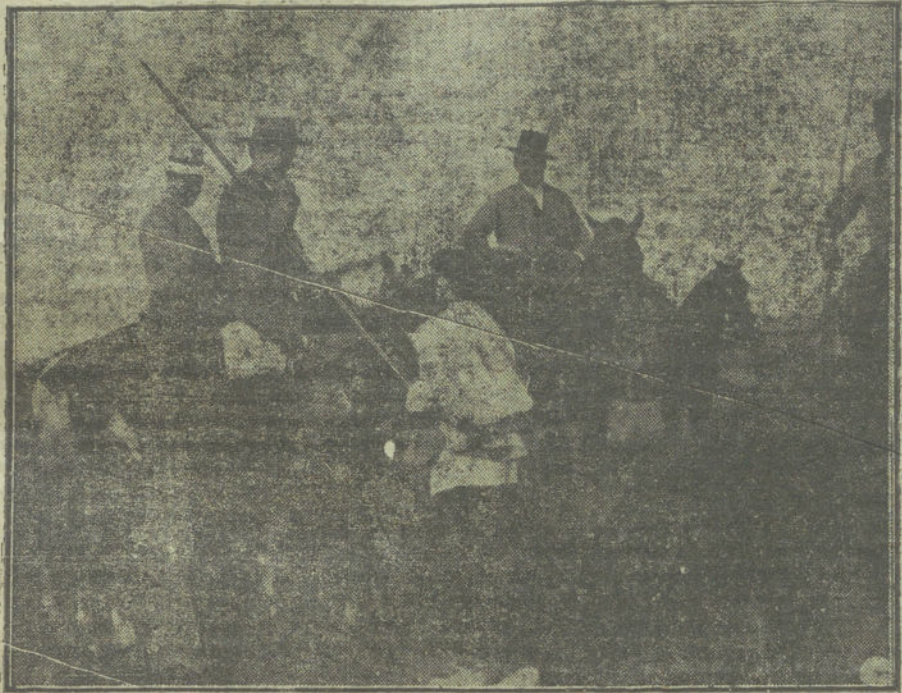
Una interesante escena del poema cinematográfico «La España trágica», en la que toma parte el famoso marañero de toros José Gómez (Gallito).