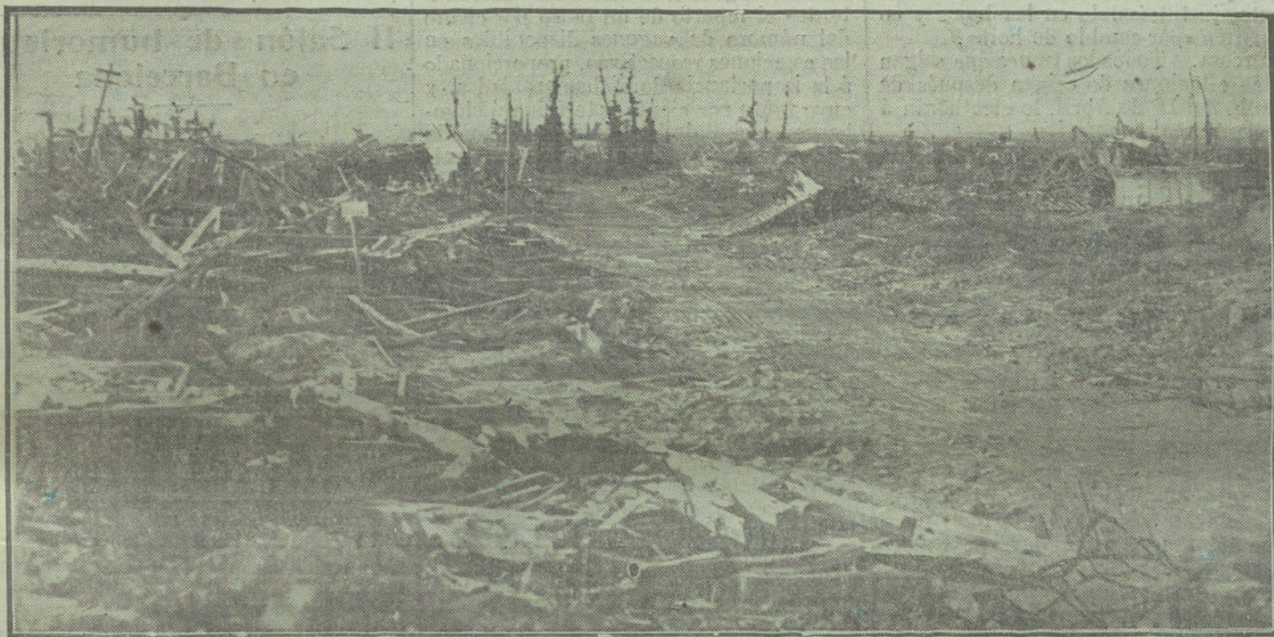
Vista general de lo que fueron la villa de Fiers y su calle principal.

«LOS EVACUADOS». VICTIMAS DE LOS ENEMIGOS Y DE LOS «AMIGOS». LA INVASION ALEMANA Y LA INVASION INGLESA. INDIFERENCIA DE PARIS ANTE EL DOLOR DE LOS FUGITIVOS. PARIS SE DIVIERTE «QUAND MEME»