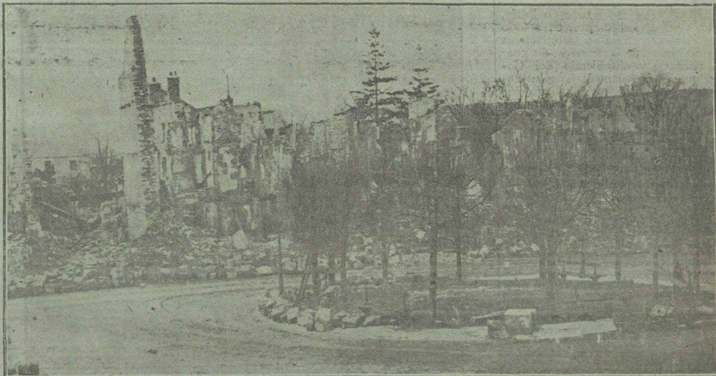
Quinas de Verdun. Estado actual de la plaza de Armas.

Y más elocuentes que todos los amargos comentarios, son estas líneas que traduzco de los diarios de París: