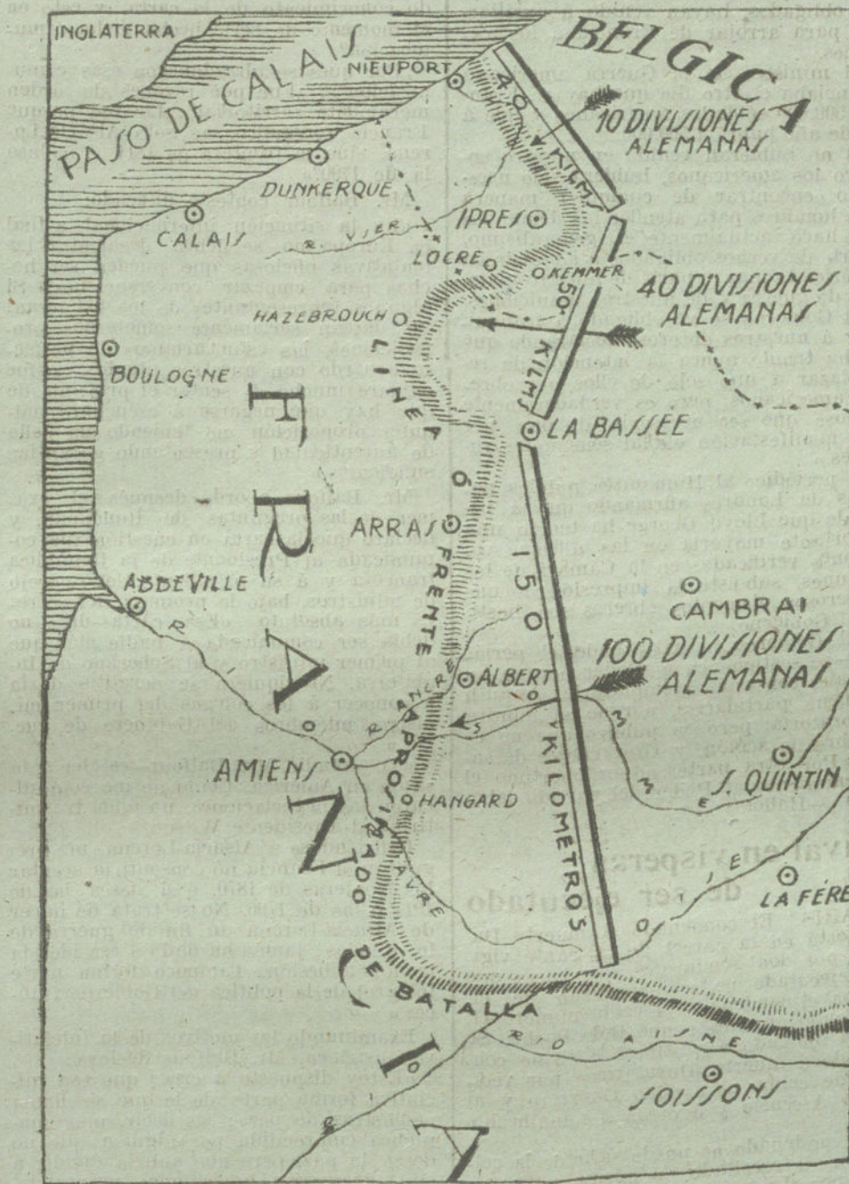
Situación actual del frente de combate en el Norte de Francia, según los últimos despachos.

La reposición de los demócratas portugueses, con el auxilio de la francmasonería internacional y del oro [por]