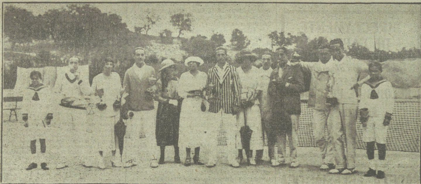
Jugadores de «tennis», que han ganado los premios en el concurso internacional celebrado en el Real Club de la Puerta de Hierro.

Los Príncipes de Ratibor y sus bellísimas hijas, acompañadas del personal de la Embajada, hicieron los honores de la casa de forma atenta.