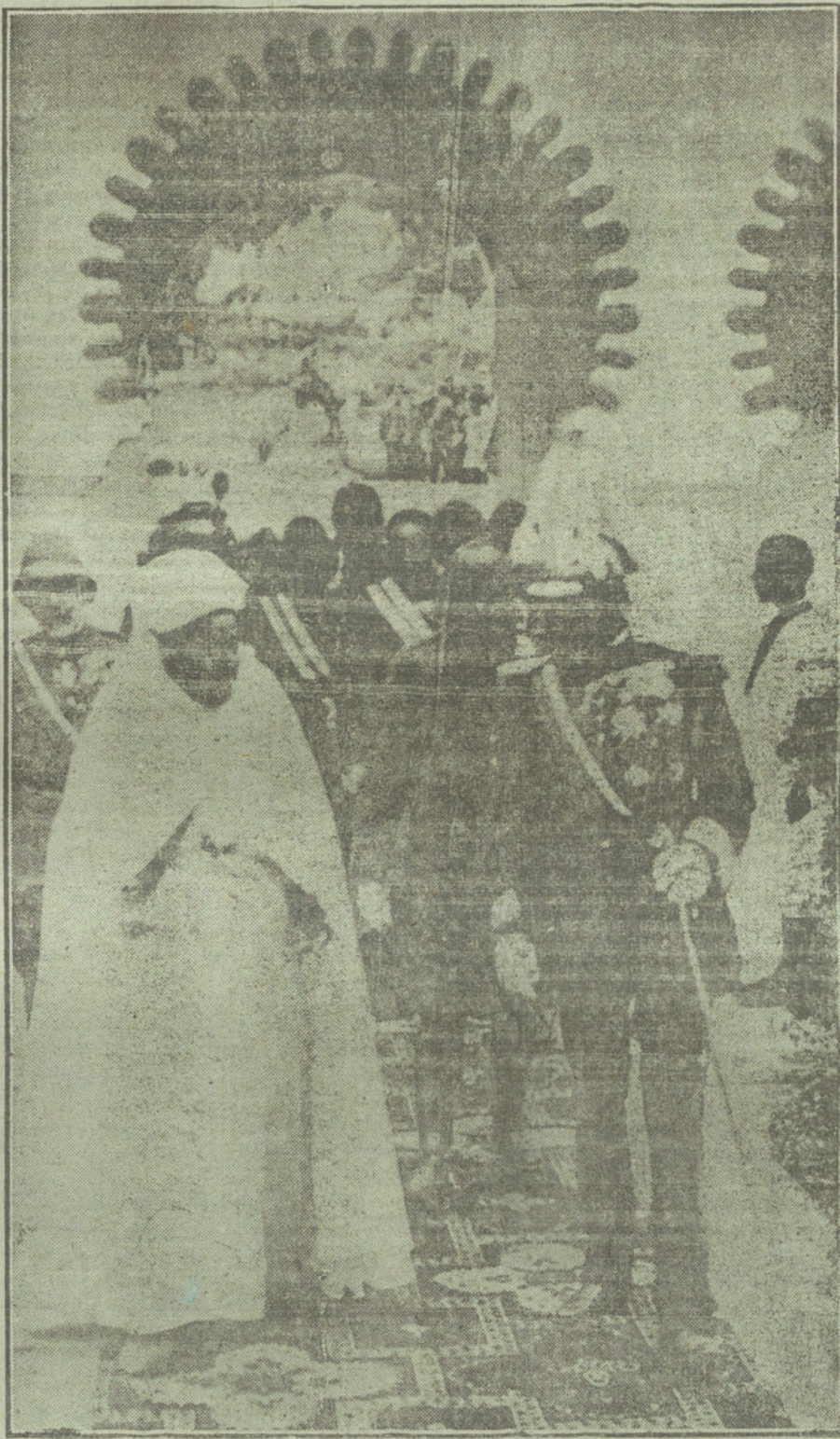
EL VIAJE DEL INFANTE DON CARLOS A TETUAN.—Su Alteza, acompañado de las autoridades marroquíes, visitando la estación del nuevo ferrocarril.

Desde luego, la adopción de tal medida indica ya una prosperidad y una robustez económica altamente halagüeña. Tanto, que con el solo anuncio de la reforma ya queda facultado el Gobierno para amortizar total o parcialmente la Deuda perpetua exterior, negociando a la vez la interior por la cantidad necesaria hasta la absoluta extinción de aquella, aplicándose el producto de las ventas de plata desmonetizada, verificadas en el extranjero, al reembolso de la Deuda exterior no domiciliada en España.