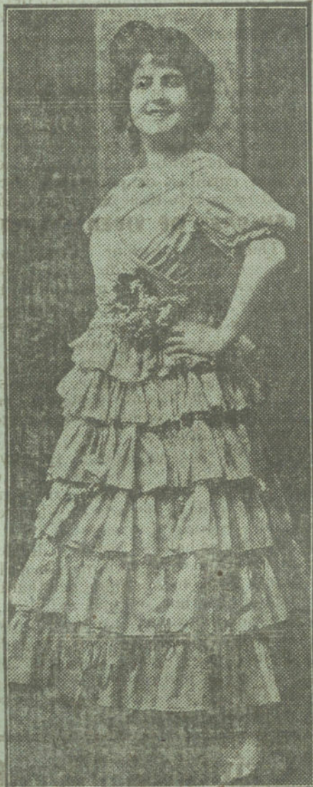
LUCIA GORGE, distinguida artista que debutará en el Odeón, y que viene precedida de fama mundial.

pues esta noche, a las diez, es la última proyección completa de esta inimitable cinta. No faltéis esta noche, si queréis ver la última proyección de LA ESPAÑA TRAGICA