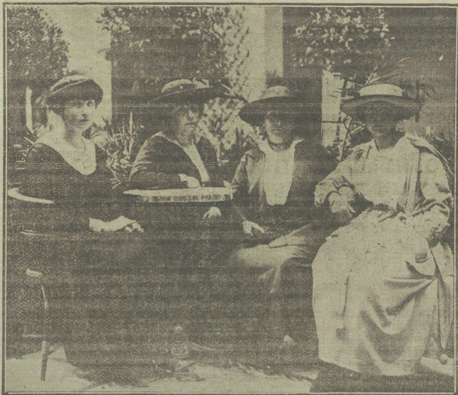
LA FAMILIA DE DON JAIME DE BORBON EN MADRID.—La Princesa Alicia, que ha llegado, esta mañana, con su hermana la Princesa Beatriz y sus sobrinas Margarita y Fabiola.

En la Presidencia ha recibido el señor Maura la visita del gobernador de Fernando Póo, y la de los Sres. Vázquez Mella, Manrique de Lara, Pérez Bueno, obispo de Barbastro, Ocharan y Villabaso, y conferenció con el comisario regio de Turismo, señor marqués de la Vega Inclán.