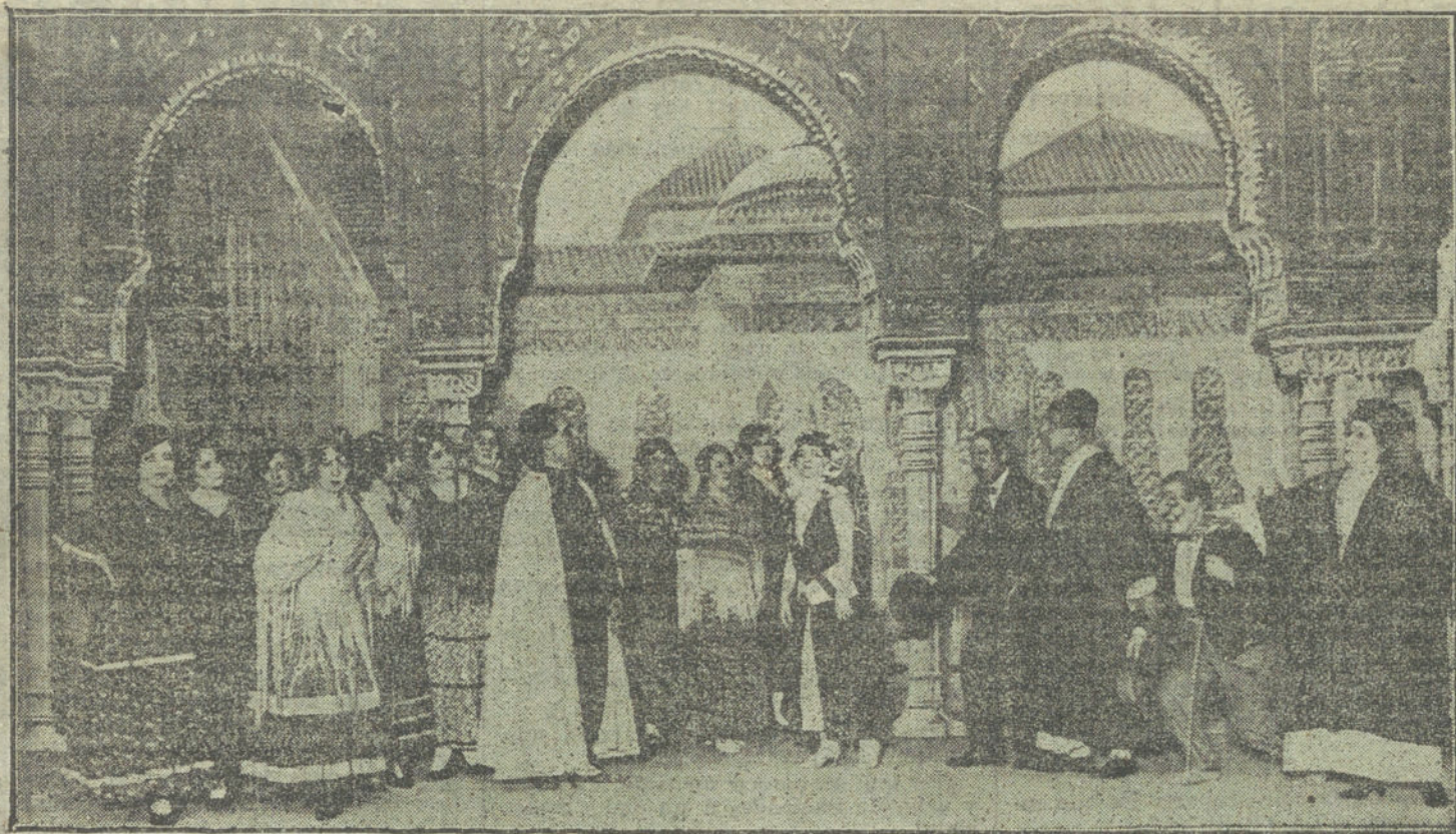
Una escena de la zarzuela «Mi Granadala», estrenada anoche en el teatro Cómico.

bonos del Tesoro entre el pueblo. La creciente desconfianza también se demuestra en la precipitada huida del capital al extranjero neutral. Aun estando prohibida cualquier exportación de capital por la ley, grandes sumas son llevadas al extranjero neutral. Este hecho tuvo que confirmarlo recientemente en la Cámara el mismo ministro francés de Hacienda.