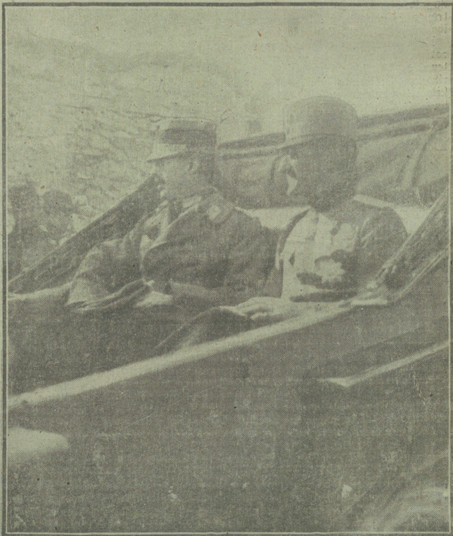
LOS JEFES DE ESTADO EN LA GUERRA.—El Rey de Grecia y el Príncipe de Serbia durante su reciente visita al frente belánico.

El discurso, insulso, ramplón, del Sr. La Cierva, falto de todo elevado pensamiento, sin una idea que demues-