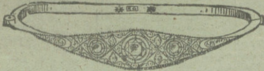
Núm. 4.—Tres brillantes y diamantes. Pesetas 725.