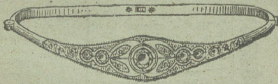
Núm. 2.—Cinco brillantes y diamantes. Pesetas 550.