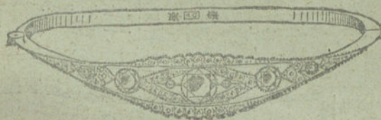
Núm. 6.—Cinco brillantes y diamantes. Pesetas 900.

Factura de garantía en todas las compras