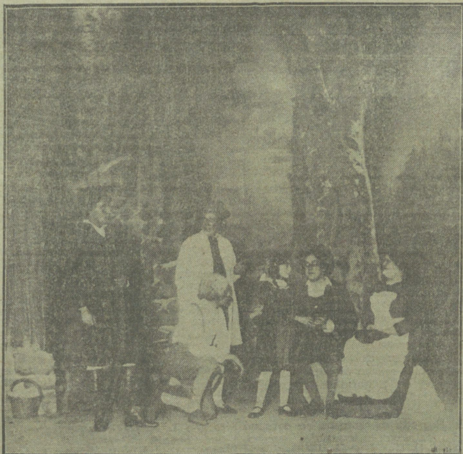
Una escena de «La sonata de Grieg», obra estrenada anoche en el teatro de la Zarzuela.

Los premios podrán ser recogidos en nuestra Redacción, Jardines, 4, mañana domingo, de doce de la mañana a una de la tarde, previa identificación de los agraciados.