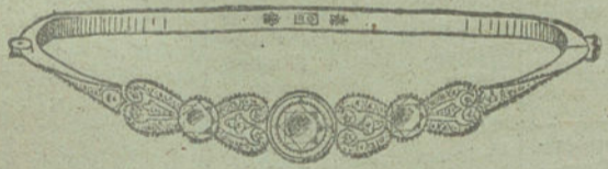
Núm. 5.—Tres brillantes y diamantes. Pesetas 800.