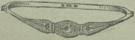
Núm. 3.—Tres brillantes y diamantes. Pesetas 600.