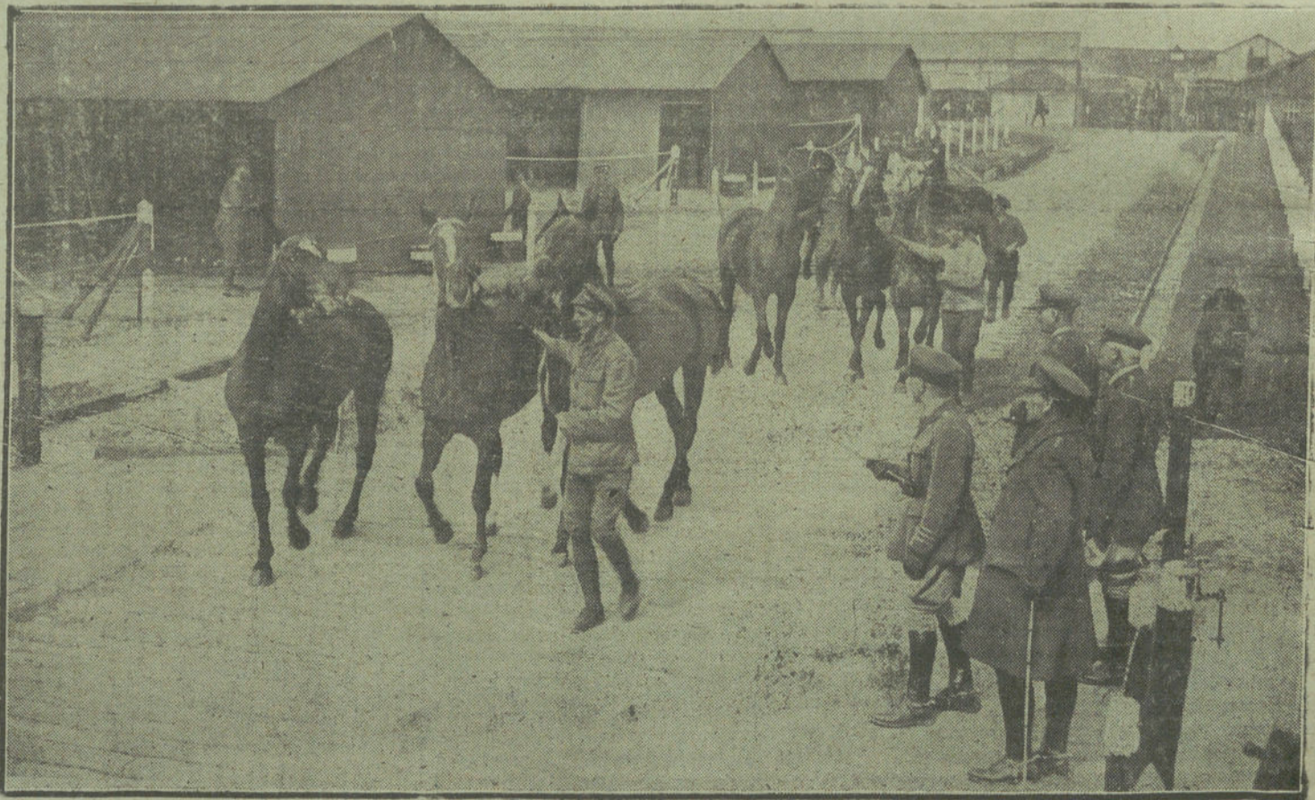
LAS NECESIDADES DE LA GUERRA.—Detalles de un hospital inglés para caballos, instalado en las cercanías del tren.