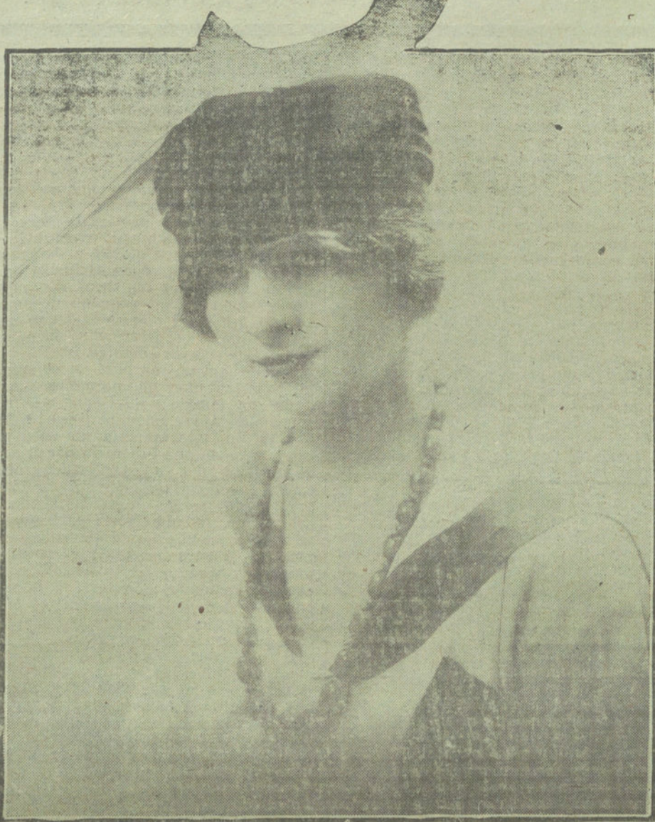
Gorro de pluma sueita, modelo de entretempo presentado por la casa Camille et Valentine de París.