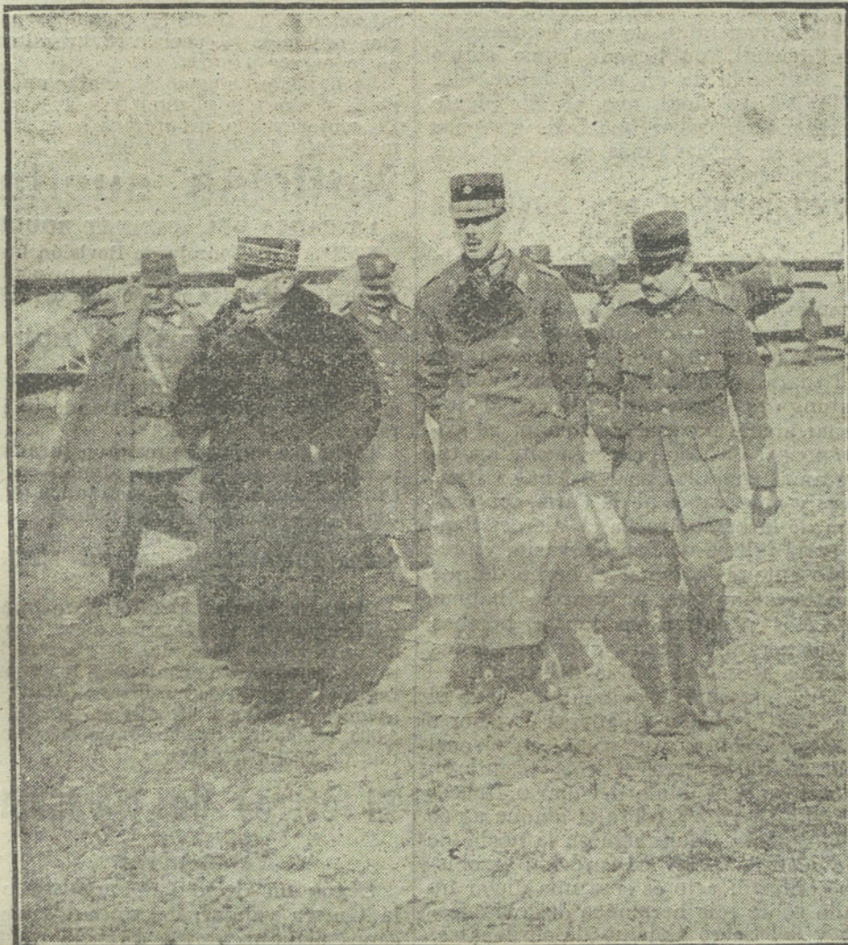
LOS JEFES DE ESTADO EN LA GUERRA.—El Rey de Grecia visitando un campo de aviación francés.

«Uno de los resultados del fuerte temperamento político del presidente del Consejo de ministros inglés, que hasta en asuntos de urgente importancia nacional suele hablar como si ante todo se tratara de probar sus propios éxitos y como si prestara más atención a hacer un cuadro de la guerra más halagüeño que correcto. La tan jactanciosa como desgraciada declaración del otoño pasado, en la que dijo que ya no temía a los submarinos, precedió precisamente a los más terribles meses de la guerra submarina, y todos sabemos ahora lo que entonces sospechábamos; es decir, que su declaración estaba más bien basada en fundamentos imaginativos que en los tristes hechos de la situación verdad. De nuevo recientemente ha hablado Mr. Lloyd George en Edinburgo sobre nuestra Marina mercante en un tono de alta confianza, asegurando a sus oyentes que el submarino, aunque es todavía una amenaza, ya no es ningún peligro. Vamos a examinar ahora cuáles han