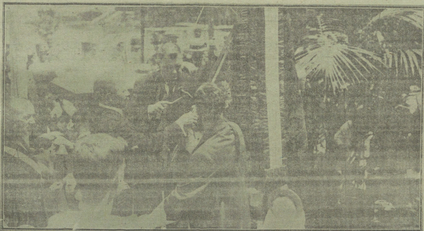
LA FIESTA DE AYER EN LA GIMNASTICA ALEMANA.—El ex cónsul de Alemania en Lisboa clavando una placa de plata en el asta de la bandera de la Sociedad, en nombre de los alemanes expulsados de Portugal y refugiados en España.