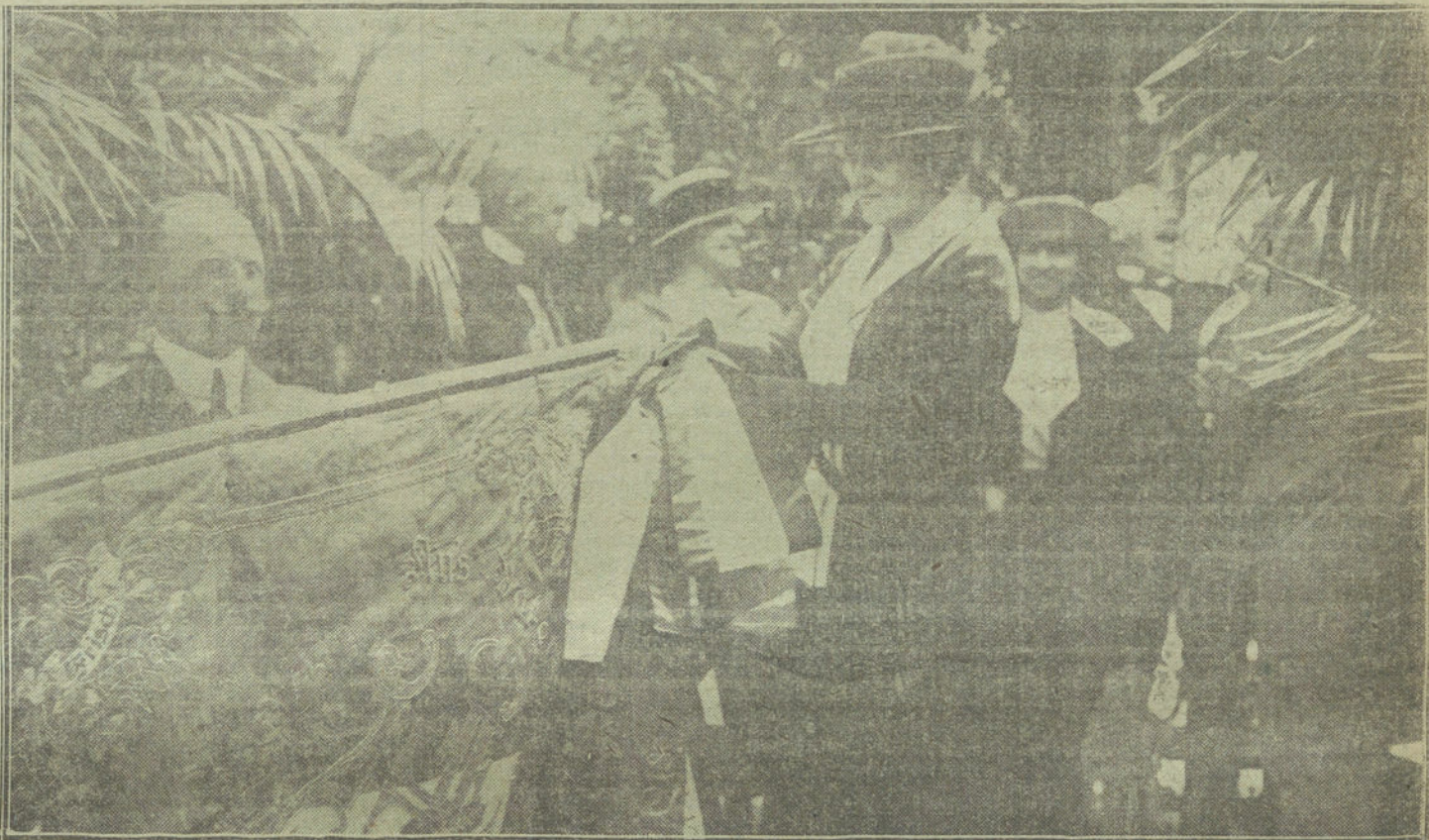
La Princesa de Furstemberg colocando la corbata que regala la colonia austriaca de Madrid a la bandera de la Sociedad Gimnástica Alemana, con motivo del XXVI aniversario de su fundación.

Quizás no tarde, pues, el lector en ir conociendo a los actores y las escenas de la obra que representan.