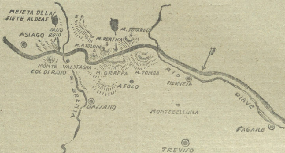
Posición que ocupan los Ejércitos beligerantes en el frente italiano, después de las victorias austriacas reseñadas en los presentes partes oficiales de última hora.

PROGRESOS AL OESTE DE SANDONA. POSICIONES AFIANZADAS. ELOCIOS A LAS TROPAS COMBATIENTES. LA LUCHA EN EL PIAVE. EL NUMERO DE PRISIONEROS ITALIANOS HECHOS EN EL SECTOR NOROESTE ASCIENDE A 12.000. DETALLES DE LA SITUACION EN EL FRENTE FRANCES. COMUNICADOS DE LOS ALIADOS