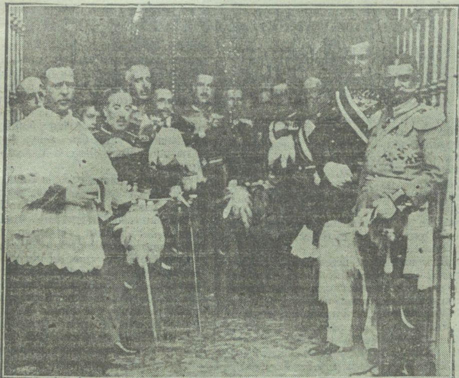
Los embajadores de Alemania y Austria con los caballeros de San Juan de Malta al salir de la función religiosa celebrada esta mañana.

en el supuesto de que las denuncias resulten comprobadas, proceder con la mayor energía.