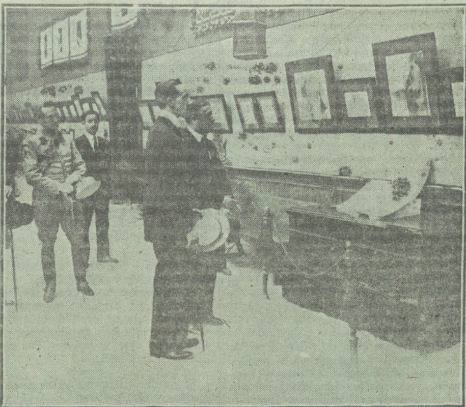
S. M. el Rey visitando la notable Exposición de dibujos del «Quijote», de Ricardo María.

Y mientras tanto, nuestras autoridades sin preocuparse (y la realidad actual constituye la mejor prueba de