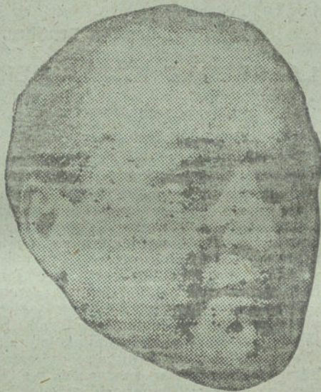
SEGISMUNDO DE NAGY, ilustre artista húngaro, que ha celebrado una notable Exposición de cuadros de asuntos españoles.

En el mercado de rentas se notó solicitud por empréstitos alemanes al 3 y 3 1/2 por 100. Se ofrecieron rentas austro-húngaras. También fué solicitado el empréstito provincial de Buenos Aires. El dinero siguió en abundancia; el descuento, sin variación, 4, 5 y 8 por 100 y menos. Del dinero extranjero subió tres marcos Suiza y Constantinopla 10 fenigs. Austria-Hungría cedió tres marcos.