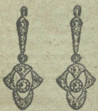
Núm. 1.—4 brillantes y diamantes.

MONTURAS DE PLATINO FINO Y ORO DE LEY 18 QUILATES CONTRASTADO