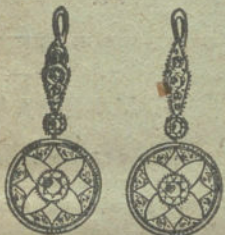
Núm. 5.—4 brillantes y diamantes.