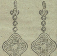
Núm. 10.—8 brillantes y diamantes.