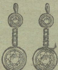
Núm. 23.—12 brillantes.