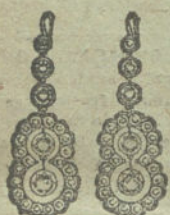
Núm. 7.—10 brillantes y diamantes.