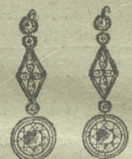
Núm. 17.—8 brillantes y diamantes.