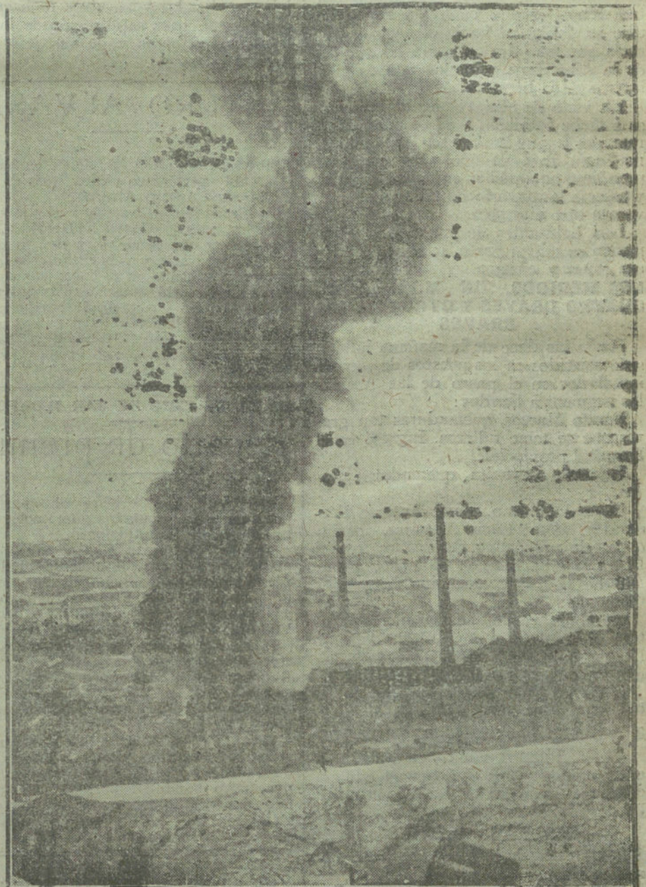
Uno de los aspectos del incendio de esta mañana.

Como de haberse propagado las llamas a este departamento hubiérase producido una catástrofe horrible, las