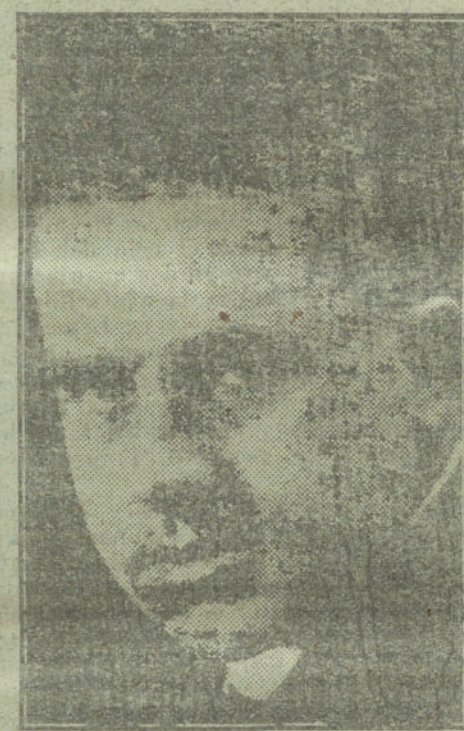
Paco Gallago, el notable actor cómico, que esta noche celebra su beneficio en el teatro de Apolo.

Comidas en las terrazas. Orquesta de tziganes. Entrada, puerta Hernani. Teléfono S. 15-39.