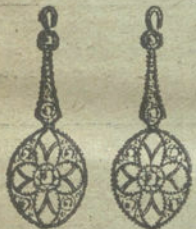
Núm. 3.—4 brillantes y diamantes.