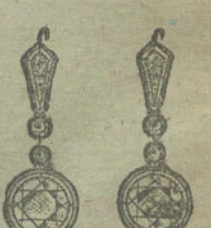
Núm. 24.—12 brillantes.