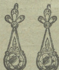
Núm. 21.—8 brillantes y diamantes.