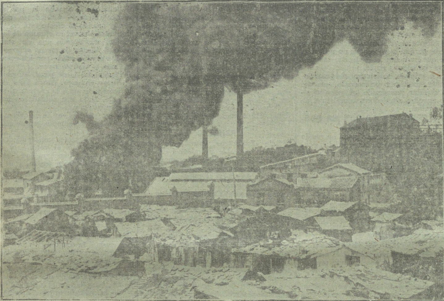
Un aspecto del formidable incendio que ha destruido esta mañana la destilería de alquitrán del paseo de las Acacias.