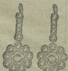
Núm. 12.—24 brillantes y diamantes.