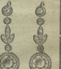
Núm. 22.—8 brillantes y diamantes.