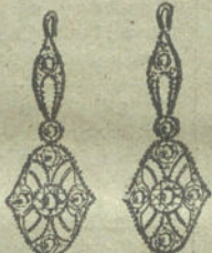
Núm. 4.—4 brillantes y diamantes.