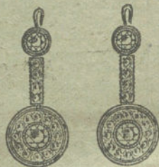
Núm. 6.—4 brillantes y diamantes.