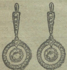
Núm. 11.—4 brillantes y diamantes.