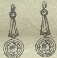
Núm. 15.—6 brillantes.