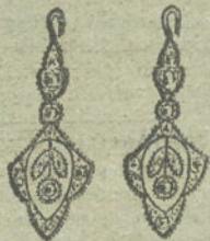
Núm. 2.—4 brillantes y diamantes.