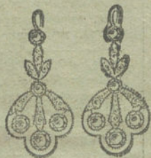
Núm. 8.—10 brillantes y diamantes.