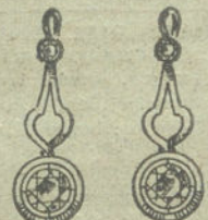
Núm. 13.—4 brillantes.