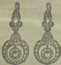
Núm. 9.—8 brillantes y diamantes.