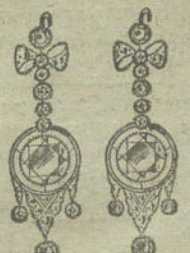
Núm. 19.—20 brillantes y diamantes.