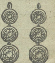
Núm. 14.—6 brillantes.