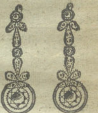
Núm. 16.—6 brillantes y diamantes.