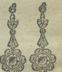
Núm. 18.—6 brillantes y diamantes.