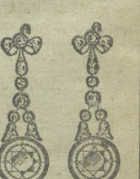
Núm. 20.—12 brillantes y diamantes.