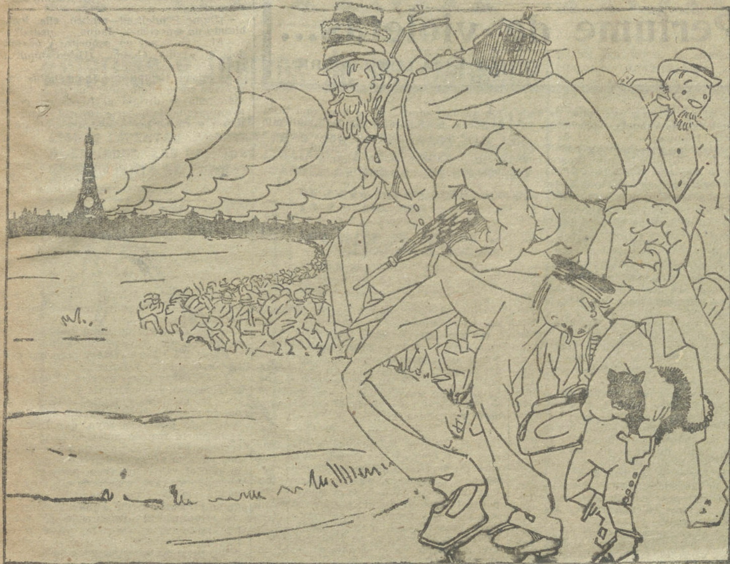
LA EVACUACION DE PARIS «Allons, enfants de la patrie, le jour de gloire est arrivé...»