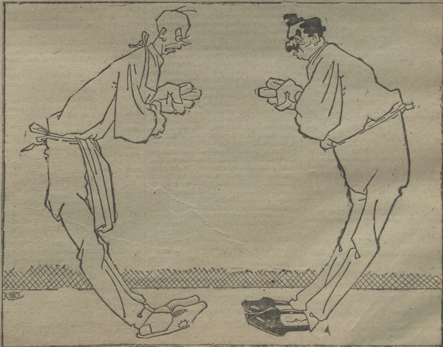
EL CONFLICTO DEL PAN Un paréntesis.

Facilitados los medios precisos, fue conducido el paciente a la mencionada Clínica municipal, en donde los facultativos de guardia procedieron a practicarle la cura de urgencia, apreciando le diversas heridas contusas en la ca-