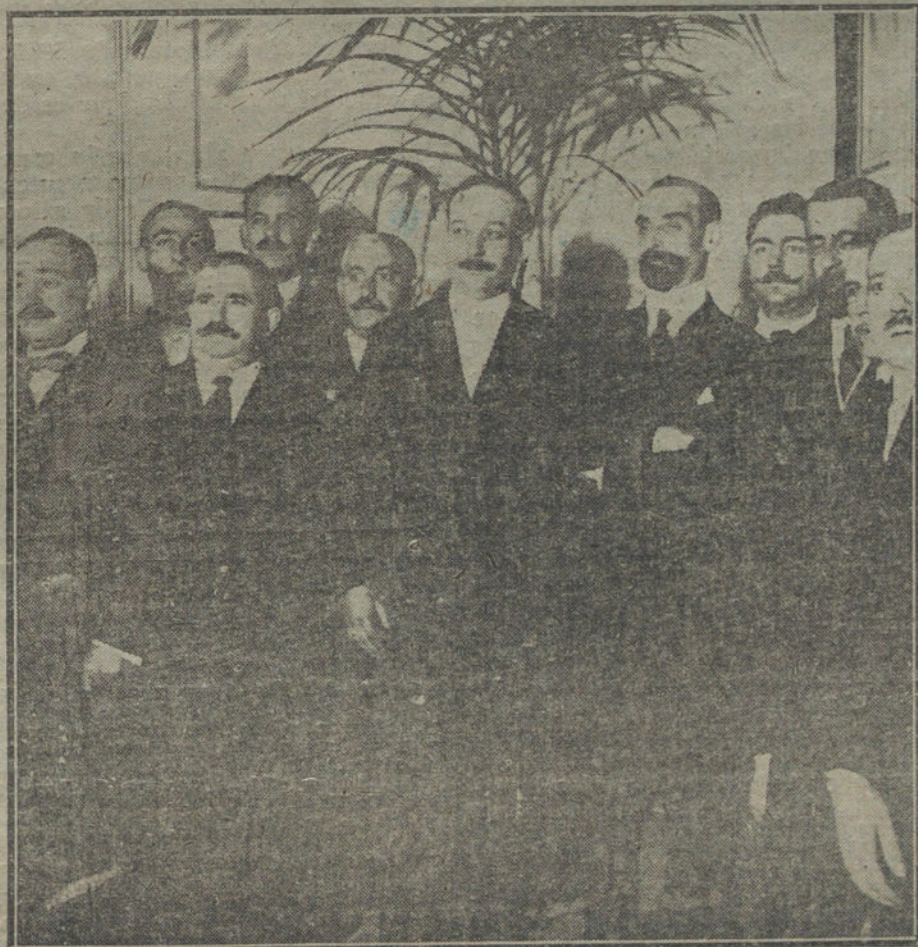
El Sr. Cambó al terminar su discurso, pronunciado anoche en el Centro de la Defensa Mercantil.