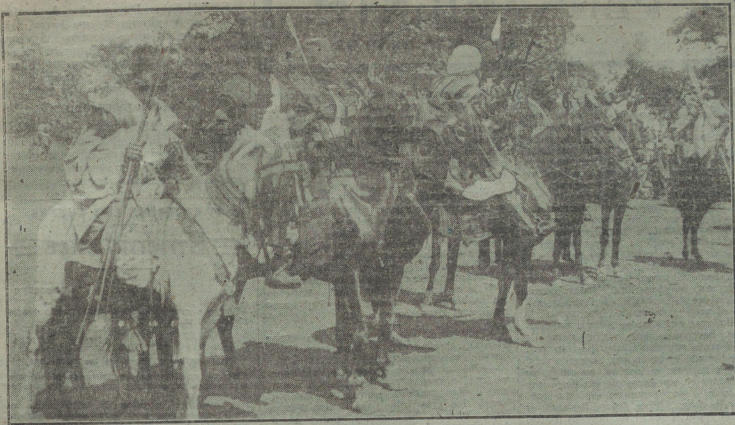
LA GUERRA PINTOUESCA.—Tropas de color, en el Campeon, durante una revista militar.

De su puerta principal, otra vía, llamada triunfal, irá a dicho paseo, que divide la Exposición en dos grandes secciones: la inferior y la superior. Y este transporte de tierras, esa ver-