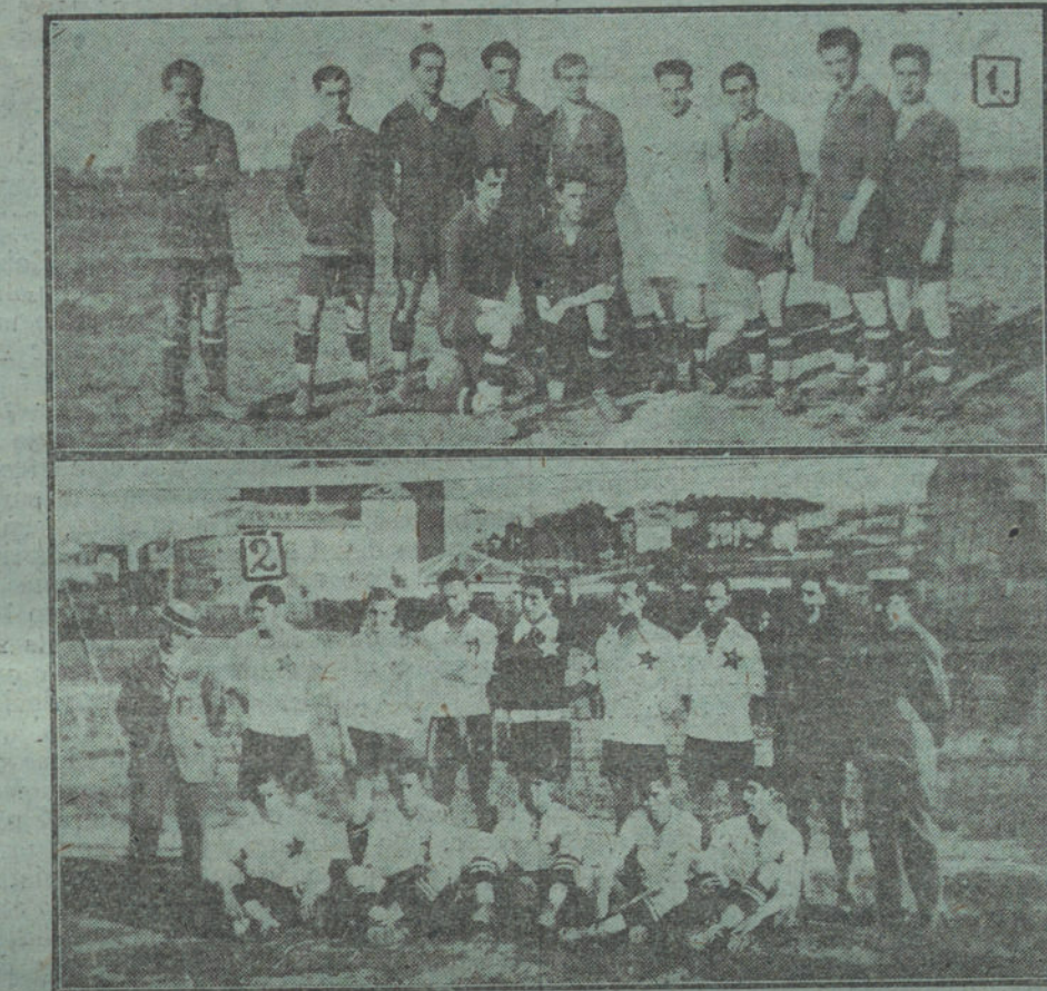
PARTIDO DE DESAFIO DE FOOT-BALL, CELEBRADO AYER EN SANTANDER. Número 1. El equipo «Racing», de Santander. Número 2. El «Internacional», de Barcelona.

Pero estimaríamos que de ese mismo criterio del ministro participaran en adelante sus subordinados. Cuando se