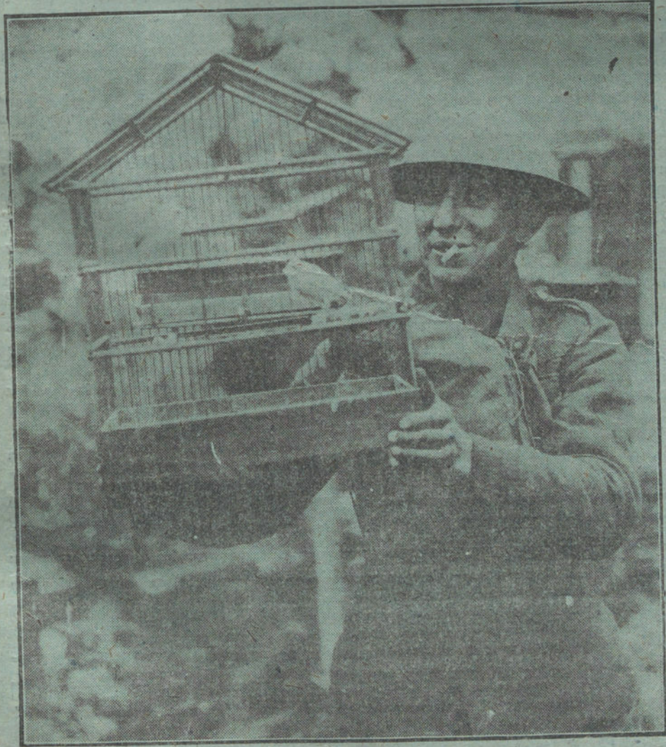
LA GUERRA, PINTOESCA.—Jaula con dos canarios, conservados por los ingleses, como «amascota», en uno de los campamentos del Norte de Francia.

NUMERO DEL TELEFONO DE LA REDACCION Y TALLERES DE LA TRIBUNA (JARDINES, 4, 6 Y 8), 424.