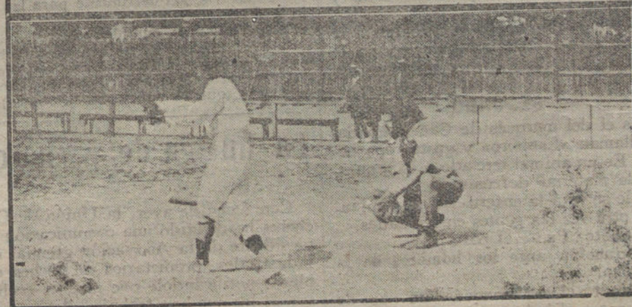
Detalles del partido de Daffy-ball, jugado esta mañana en el campo de la Gimnasia Española. Arriba el equipo americano.