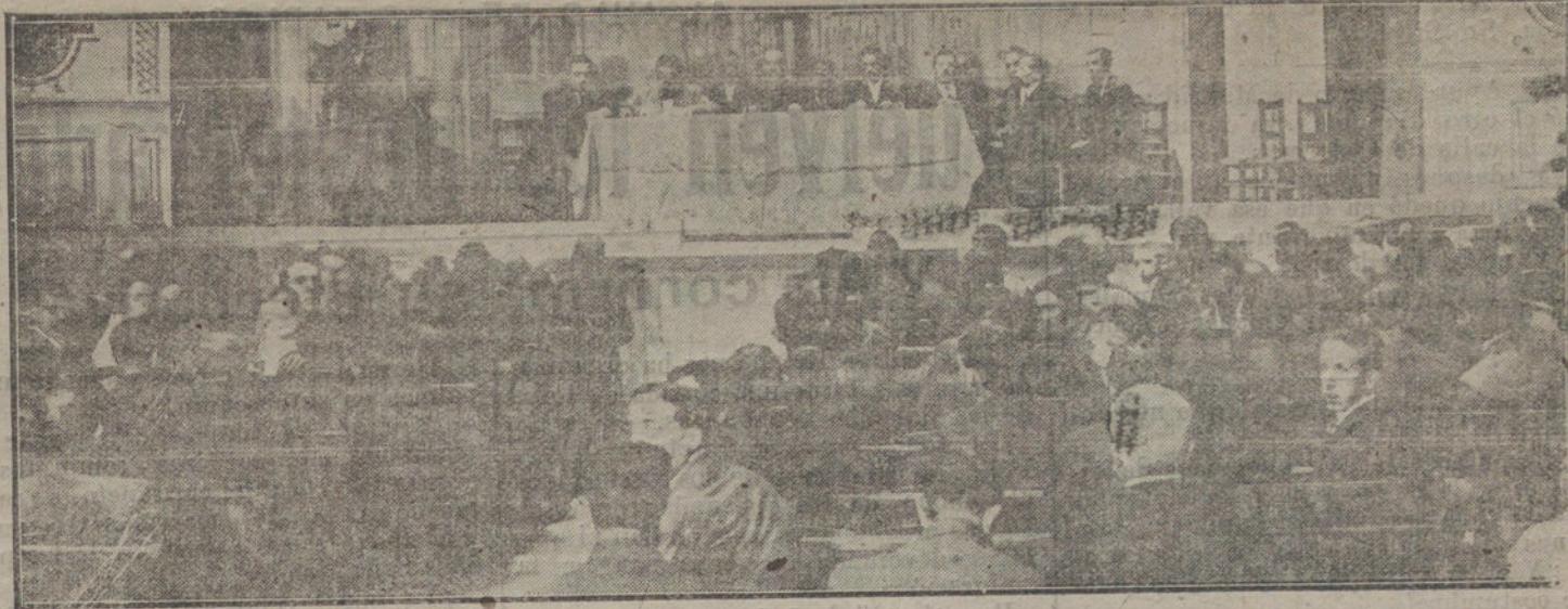
Presidencia del mitin caótico obrero verificado esta mañana.

En el prólogo de su discurso el doctor Murillo dedica un recuerdo á aquellos ilustres varones Taboada de la Riva