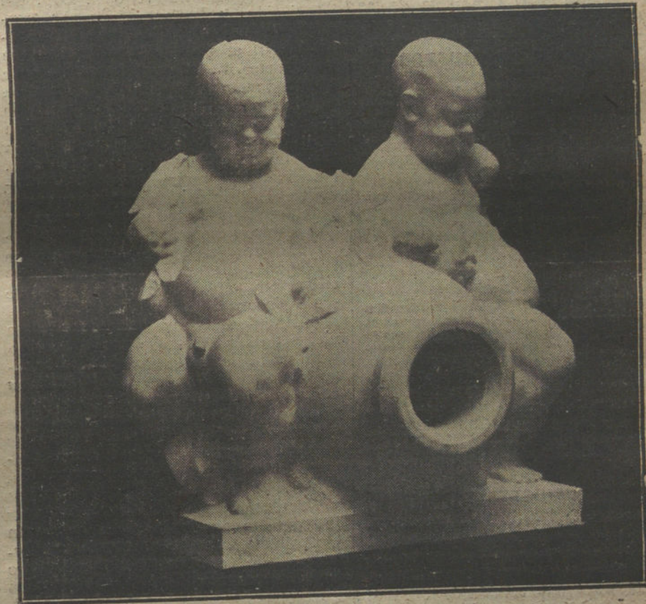
Grupo escultórico para la fuente del monumento á Barroso.

ta el símbolo propiamente dicho—espigas, paleta, yunque—, si no tomáramos estas recetas tradicionales como procedimientos de vulgarización.