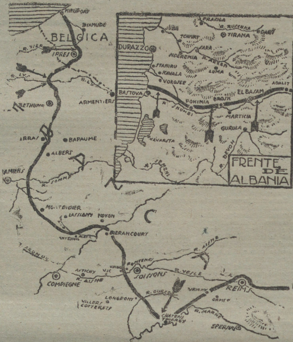
Gráfico del frente occidental donde ha comenzado, según el parte francés, la nueva ofensiva alemana. En el ángulo un detalle de las últimas operaciones en Albania

LOS ALEMANES INICIAN UN FORMIDABLE ATAQUE EN UN FRENTE DE 80 KILOMETROS. LO QUE DICE EL PARTE FRANCÉS. MÁS PEQUEÑOS DE LA LUCHA EN ALBANIA. PEQUEÑAS ACCIONES EN EL SECTOR ITALIANO