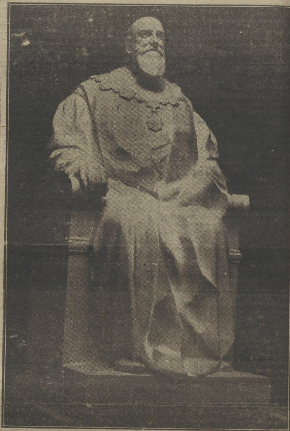
Estatua del Sr. Barroso, obra de Mateo Inurria.

Mateo Inurria, enjuto, afilado y sombrío, pudo ser un descendiente de los omeyas. En un carabo moro llegó un día á las playas andaluzas, entró en la Península y se instaló en Córdoba, primero como walf y después como califa. Quizás pensó hacerse poeta á semejanza de Hixen II; pero prefirió la escultura, vocación que compartió con el adiestramiento de las armas. Es posible que de conservarse algunos restos, más estimables que los del Museo Arqueológico, del palacio de Medina Zahara, hubiéramos hallado antecedentes de su arte.