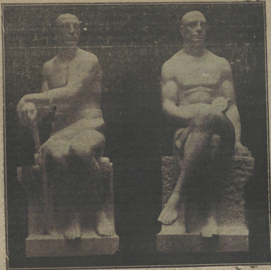
El Trabajo y el Comercio, decoración del monumento á Barroso.

Estas mismas tendencias se repiten después, más relevantes en los símbolos que completan el monumento. Así la representación de la Agricultura tiene una rigidez egipcia, una tosquedad de arte primitivo, una dureza de matrona fecunda y pródiga, que contrasta con la idealización de las Bellas Artes, un desnudo de moribundos suaves, senos escasos y