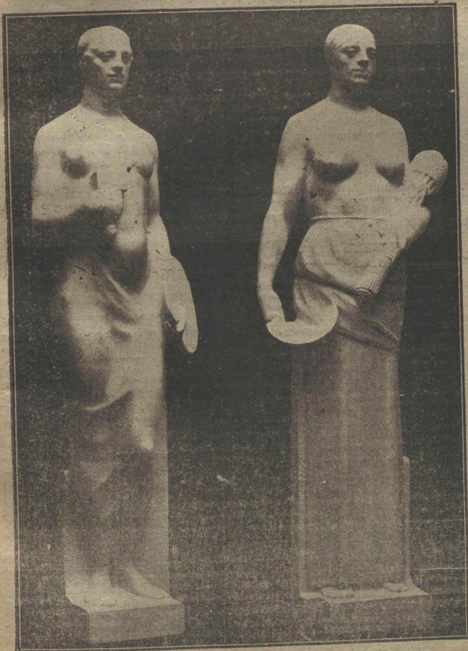
Símbolos de la Agricultura y las Bellas Artes, en el monumento á Barroso.

Cada figura posee una distinta expresión simbólica, con lo cual no haría fal-