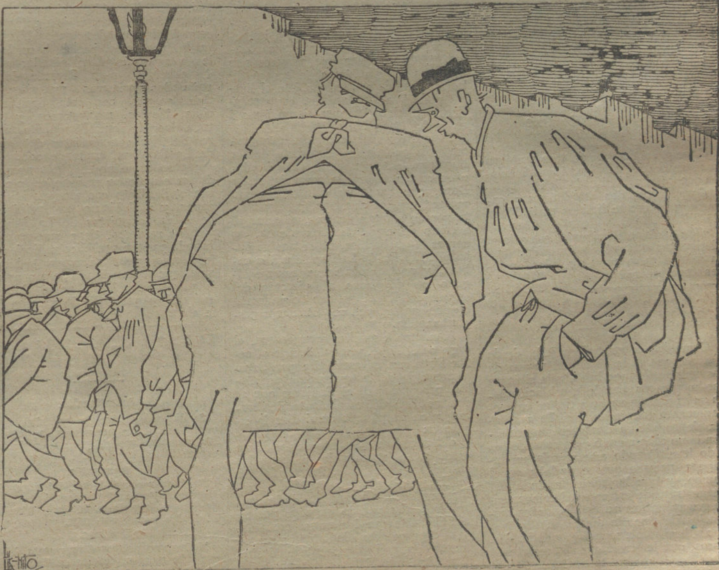
DESPUES DEL MITIN