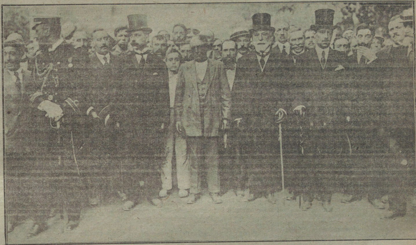
LA CATASTROFE DE SANTANDER.—La representación de S. M. el Rey, autoridades y presidentes de los gremios de pescadores y pescadores, que formaban la presidencia del duelo en el entierro de las víctimas de la explosión del «Santa Agueda».

Los inspectores y agentes que han practicado el servicio han sido felicitados por sus jefes.