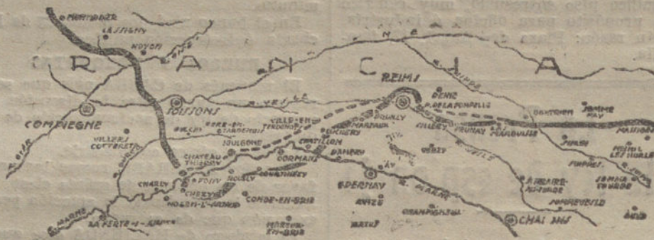
Gráfico de las operaciones, según los partes oficiales de hoy. La línea de puntos indica las posiciones que ocupaban las tropas del Kaiser al comenzar las ofensivas.

VARIOS PUEBLOS CONQUISTADOS. LAS TROPAS ALEMANAS CONSOLIDAN SUS POSICIONES EN LA ORILLA SUR DEL MARNE. REIMS EN PELIGRO. 18.000 PRISIONEROS ALIADOS. CONTRATAQUES MALOGRADOS. ENORMES PERDIDAS FRANCESAS. LA LUCHA EN OTROS FRENTES. CONFESIONES DE LOS ALIADOS