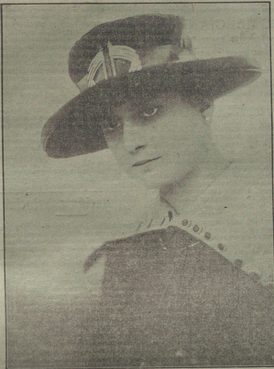
Sombrero de estilo americano, adornado con banderas, modelo de la casa Tourneur.