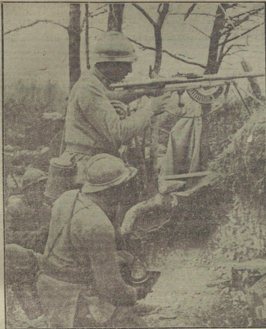
LA LUCHA EN FRANCIA.—Un puesto de ametralladoras en las avanzadas francesas del frente occidental.

deberes, y agradece al «A B C» que la crea incapaz de faltar á ellos.