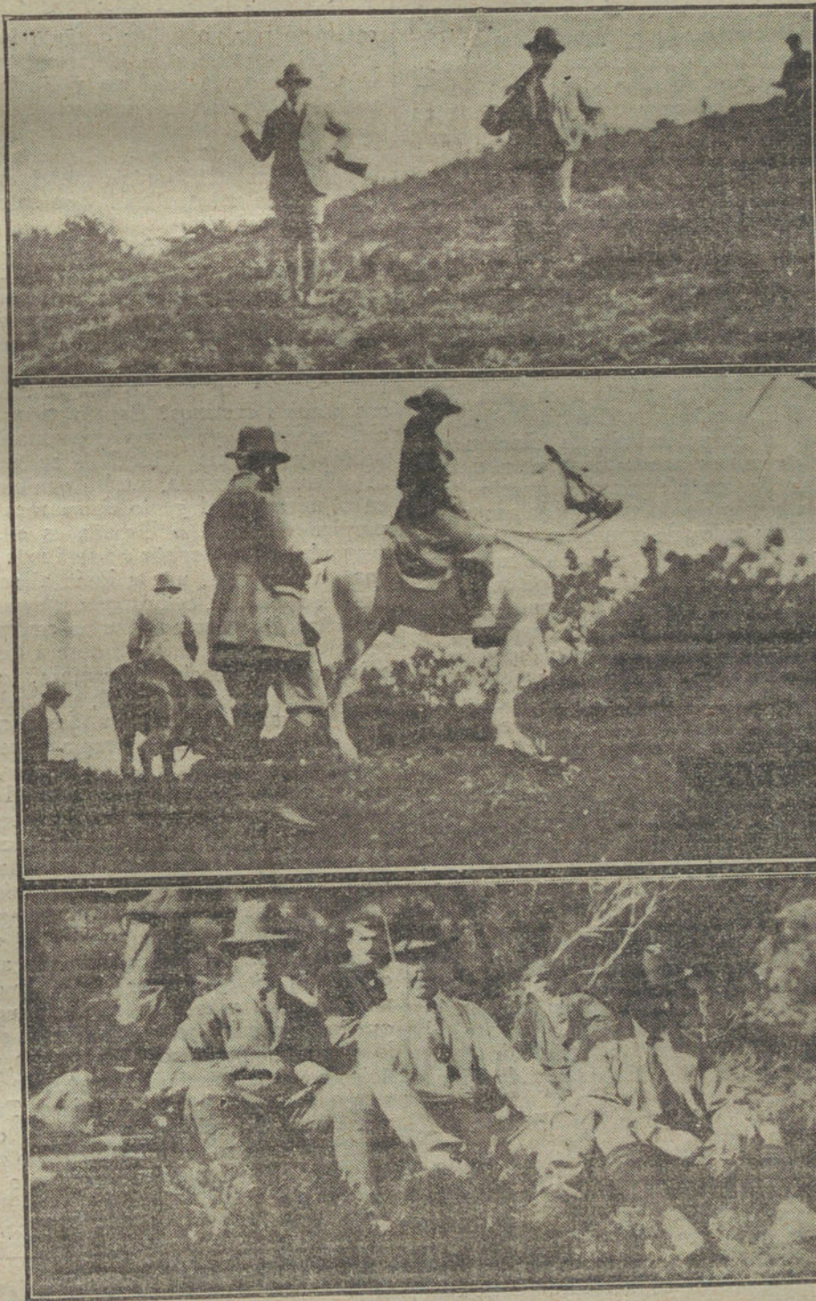
EL VERANEO REGIO EN SANTANDER. Detalles de la cacería en los montes de Saja.—Número 1, S. A. el Infante Don Alfonso, hijo del Infante Don Carlos, dirigiéndose a su puesto de caza.—Número 2, la Infanta Doña Luisa a su llegada al cazadero.—Número 3, un descanso durante la cacería.

El ministro de Hacienda ha dado cuenta de varios expedientes de su departamento y de las conclusiones de