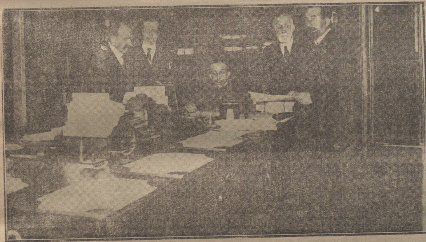
La Mesa del Senado sometiendo, en la mañana de hoy, á la firma de S. M. las leyes últimamente aprobadas en aquella Cámara, entre ellas la de anticipo reintegrable á la Prensa.

Se ha celebrado, bajo la presidencia de S. M., el Consejo de ministros que estaba anunciado para hoy, sin que asis-