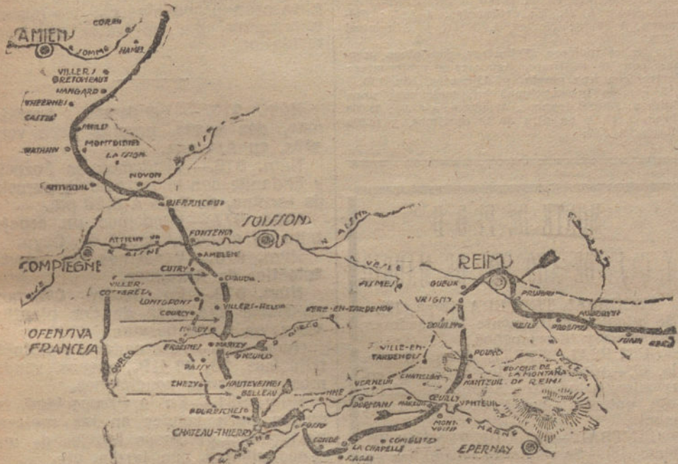
Gráfico de la situación actual en los frentes occidentales, después de las últimas batallas, que han costado sangrientas pérdidas a los franceses.

INSISTENTES ATAQUES FRANCESES RECHAZADOS. LOS ULTIMOS COMBATES HAN CAUSADO A LAS TROPAS FRANCESES ENORMES BAJAS Y UNA PERDIDA CONSIDERABLE DE MATERIAL. ACCIONES LOCALES. LA GUERRA EN EL AIRE. 30 APARATOS ALIADOS DERRIBADOS. CONTINUA LA GRAN BATALLA EN UN FRENTE EXTENSISIMO. LO QUE DICEN LOS PARTES ALIADOS