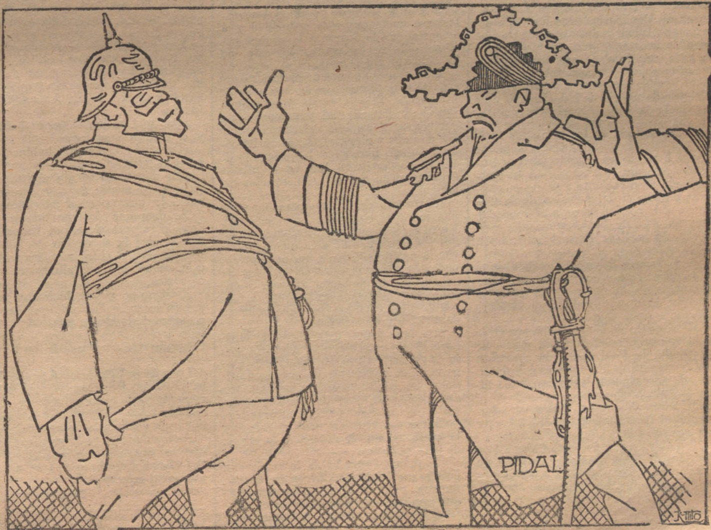
LOS TECNICOS EN EL GABINETE

También acaricié la idea de una zarzuelita, en la que sólo hablen el primer actor y la primera actriz, y que el resto de los personajes se limiten á