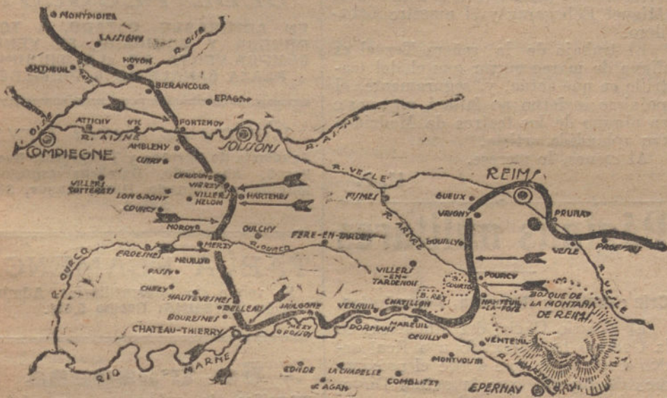
Gráfico de la situación del frente occidental alemán, según las últimas noticias contenidas en los partes de última hora.

ACTIVIDAD AL SUR DEL ANCRE. ATAQUES INGLESES MALOCRADOS. LA LUCHA ENTRE EL AISNE Y EL MARNE. BAJAS DE LOS ALIADOS. ARGELINOS, MARROQUÍES Y SENEGALES LUCHAN EN PRIMERA LINEA. EFICACIA DE LOS TANQUES EN LA LUCHA. LOS ALIADOS SON RECHAZADOS EN VARIOS PUNTOS, Y TIENEN QUE RETROCEDER ANTE LOS CONTRAATAQUES. COLUMNAS DIEZMADAS. LOS AMERICANOS SUFREN GRAN NÚMERO DE BAJAS AL NOROESTE DE CHATEAU-THIERRY, Y LOS DEMÁS ALIADOS, AL NORTE DEL ARDER. TRIUNFOS DE LOS AVIADORES ALEMANES, QUE DERIBAN 24 AEROPLANOS Y TRES GLOBOS