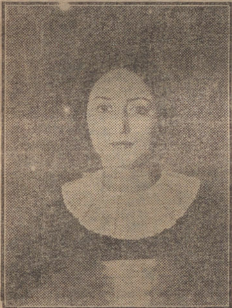
Retrato de la señorita N. G., obra de Vara de Rueda.

Verdad que causa tristeza, honda tristeza, oír estas justas lamentaciones de quien se halla en la plenitud de sus facultades y posee recia vitalidad? ¿No es vergonzoso que artistas llenos de vigor, de savia, de actitudes extraordinarias, de juventud, sean desdona-