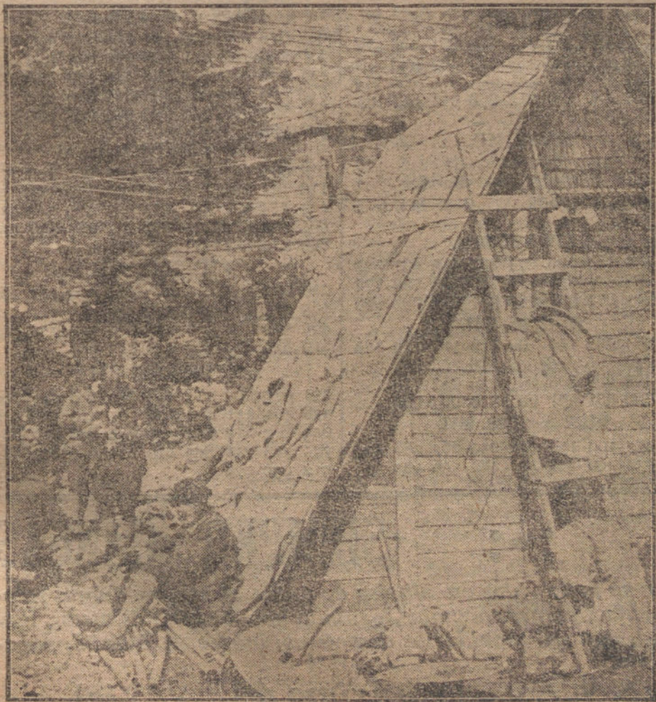
LAS NECESIDADES DE LA GUERRA.—Una estación telefónica instalada por las tropas alpinas italianas en el frente del Piavé.