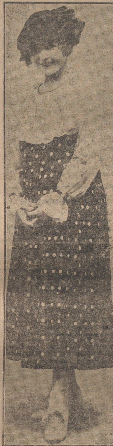
Elegante y sencillo vestido para señorita, uno de los modelos que más se usan entre las elegantes parisinas.

nalmente con nuestra modestísima cooperación.