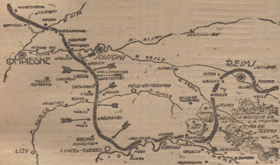
La línea de batalla entre Montdidier y Vesle tal como está, según las noticias de esta tarde. Las flechas indican los lugares por donde atacan unos y otros beligerantes.

CONTINUA LA LUCHA VIOLENTISIMA ENTRE EL AISNE Y EL MARNE. TROPAS ALIADAS DE REPUESTO RECHAZADAS CON GRANDES BAJAS. INFRUCTUOSOS ATAQUES EN SOISSONS. LUCHA DE ARTILLERIAS AL NORTE Y NOROESTE DE CHATEAU-THIERRY, ENTRE EL MARNE Y EL ARDRE. LAS TROPAS DEL DUQUE ALBRECHT AVANZAN VICTORIOSAMENTE