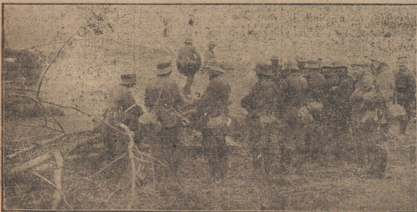
DE LA BATALLA OCCIDENTAL.—Reservas alemanas esperando la orden de avance.

El Estado Mayor alemán nos tiene acostumbrados a decirnos en todo momento la verdad de la situación militar de sus Ejércitos, y a no exagerar en nada el objetivo de sus operaciones. Por esta causa, el pueblo alemán tiene fe ciega en sus generales, y el mundo se ha acostumbrado a no desconfiar de la veracidad de las palabras de su generalísimo. En las referencias de la nota de Nauen, que ha publicado la Prensa, se encuentra la explicación de esta operación, que tanto ha llevado de júbilo a los críticos aliadófilos, a los cuales les recordaremos la anterior retirada de Hindenburg, de fatales consecuencias para el generalísimo Petain, y que más tarde se convirtió en un verdadero desastre para los aliados.