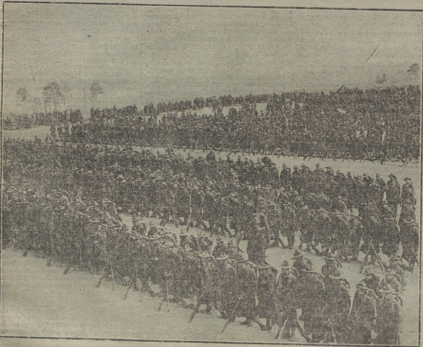
LOS MEDIOS AMERICANOS.—Parte de una división del Ejército de los Estados Unidos en Francia, esperando una revista.

Si, duda alguna, significa este hecho mucho más que el derrumbamiento de cualquier otro avión. Los ingleses habían esperado encontrar en este barco-volante un medio para paralizar la guerra submarina en sus aguas costeras. Los aviadores alemanes en las costas de Flandes han demostrado que también saben vencer á este adversario, no despreciable, que en muchos sentidos representa un nuevo escalón en el desarrollo del arma aérea.