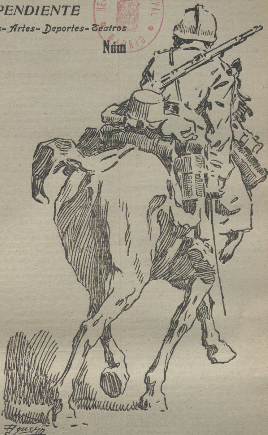
SOLDADO DE CABALLERIA FRANCESA. (Dibujo de AGUSTIN.)

En los días 8, 9 y 10 del próximo Agosto comenzará una serie de Conse-