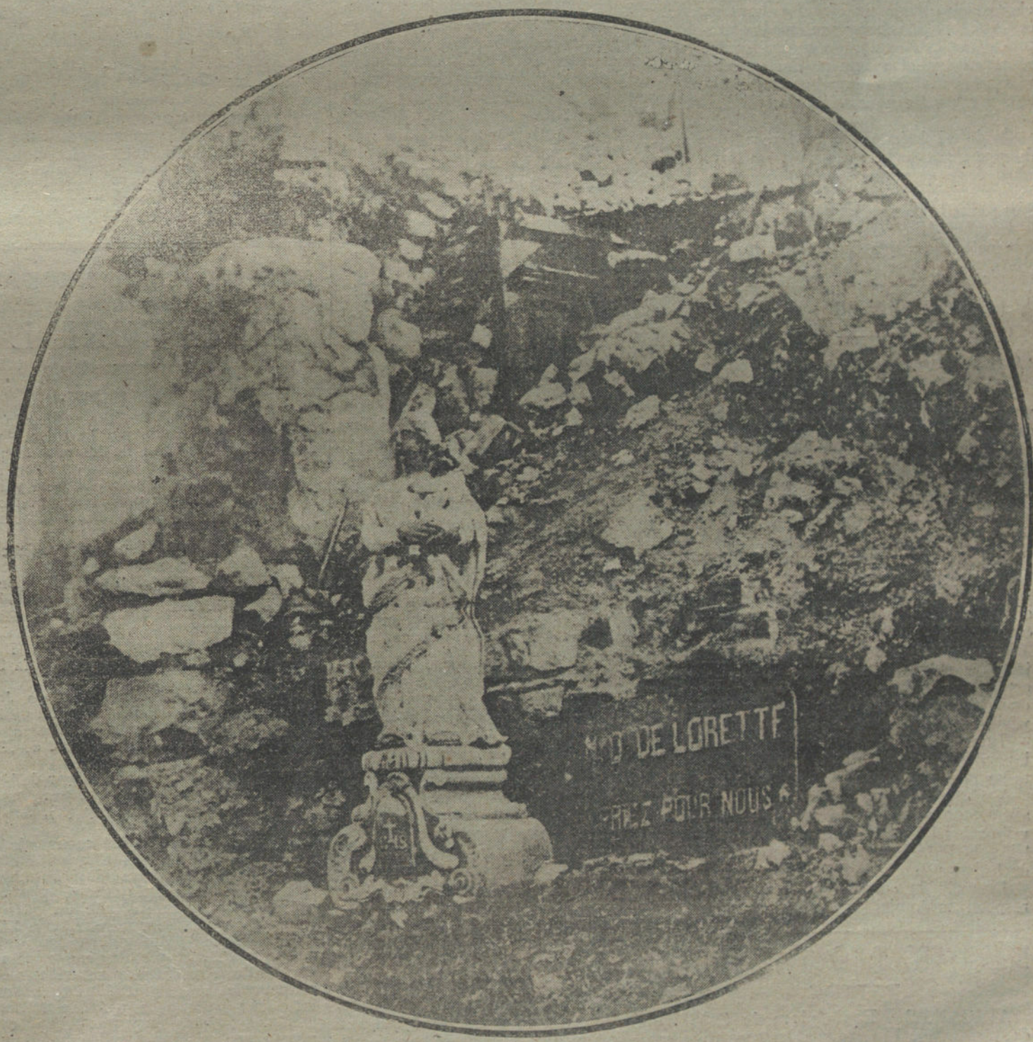
LA VIRGEN DE LAS RUINAS.—Una imagen de Nuestra Señora de Loreto que surge intacta de entre los escombros de una iglesia. Al pasar una legión ha depositado a los pies de la imagen una cartela, en la que dice, invocando su nombre: «¡Venga por nosotros!»

Pero, además, el vacío que hay que lamentar hoy no consiste sólo en la pequeña cantidad de cobre y de ácido sulfúrico que se beneficia en comparación con la posible, sino en la poca intensificación industrial. La poca metalurgia que allí existe se detiene en los grados relativamente inferiores de la producción—cáscara y blister—, sin llegar al afino del producto, ni menos a su ulterior elaboración industrial, ni aprovechar las cantidades no despreciables de plata y oro que el cobre