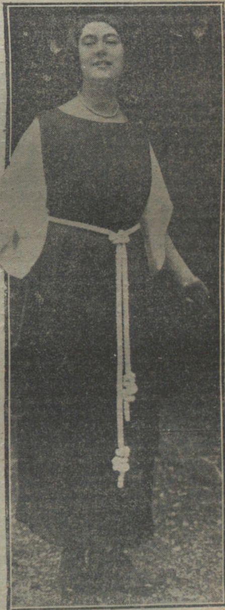
Fraje de jardín, que recuerda vagamente los hábitos monásticos, y que es un precioso modelo por su elegancia y por su sencillez.

«Azorín» es un estilista. Esta proposición se admite frecuentemente como axiomática. ¿Y por qué «Azorín» es un