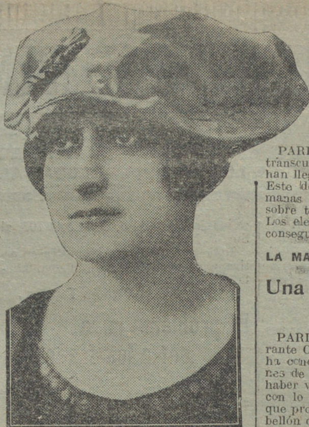
Sombrero-boina, última palabra del ingenio modista.

El decaimiento fué acentuado por el asesinato en Kief, repercutiendo en los