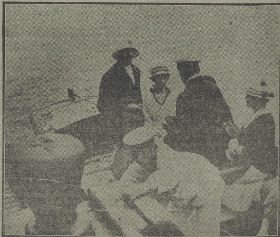
EL VERANEO REGIO.—Doña Victoria y Don Alfonso embarcando en una gasolinera para pasear por el Puerto de Santander.