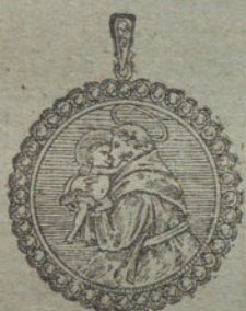
Núm. 4.—42 diamantes, imagen de nácar.