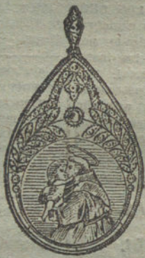
Núm. 8.—6 brillantes y diamantes, imagen de nácar.