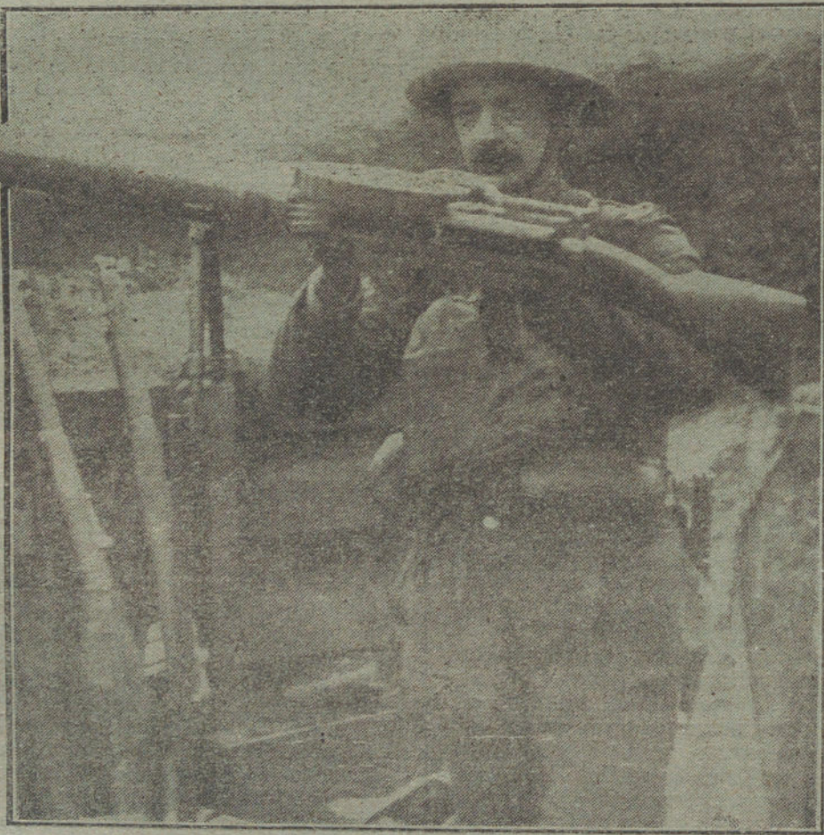
LAS NUEVAS ARMAS DE LA GUERRA. Fusil inglés que dispara automáticamente 200 tiros por minuto.

«Mientras la prosperidad comercial aumenta en el Japón, nacen cada vez más las dificultades para obtener algunos de los principales productos de alimentación. El Gobierno ha quedado obligado á decretar, pues, disposiciones para la importación de arroz extranjero y para garantizar su venta á un precio razonable.»