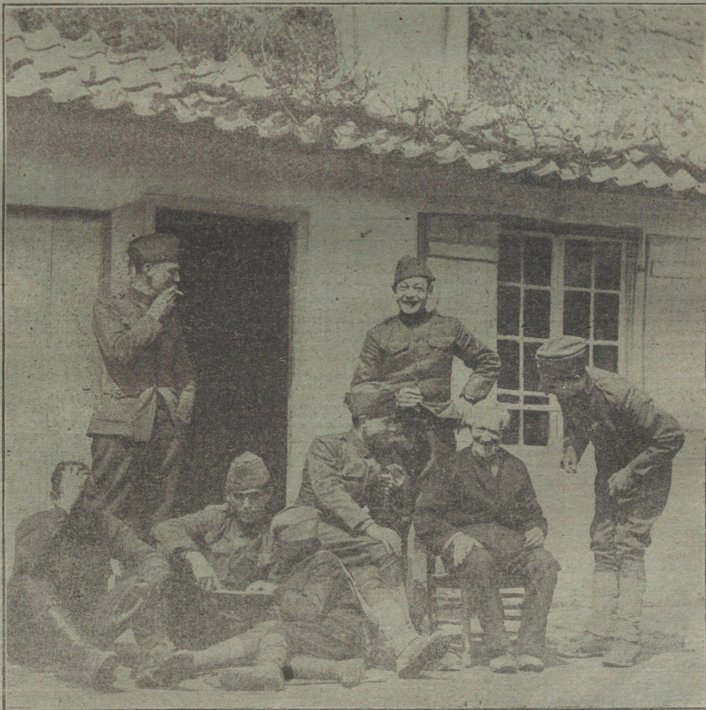
EL VETERANO. Soldados norteamericanos escuchando el relato de las viejas batallas á un colega de 1870.

Pero aun en el caso de que, en contra de lo esperado, las acusaciones inglesas resultasen justificadas en lo que á un intencionado ataque contra el «Warilda» se refiere, puede, no obstante, decirse que ataques contra barcos-hospitales, los cuales, según manifestaciones de los propios enemigos, han sido utilizados á menudo para el transporte de tropas y material de guerra, no son más condenables que ataques aéreos contra lazaretos, tanto más cuanto que éstos les son conocidos al enemigo como tales, como fué el caso en los últimos ataques.