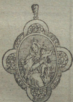
Núm. 7.—20 brillantes y diamantes, imagen de nácar.