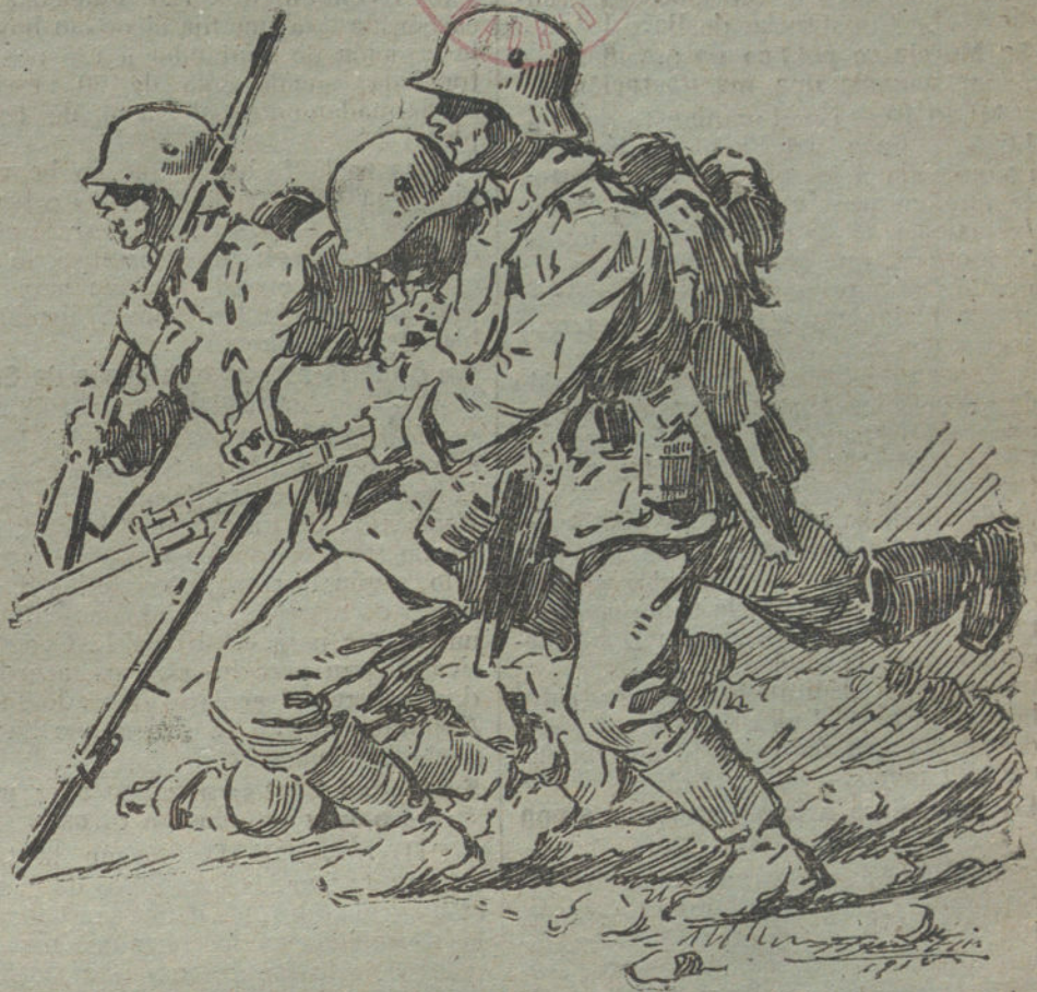
Infantería alemana iniciando un ataque á la bayoneta. (Dibujo de AGUSTIN.)