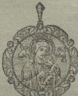
Núm. 6.—18 brillantes y diamantes, imagen de nácar.