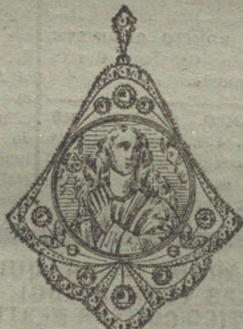
Núm. 9.—10 brillantes y diamantes, imagen de nácar.