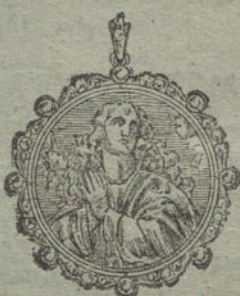
Núm. 5.—8 brillantes y diamantes, imagen de nácar.