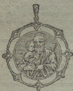
Núm. 1.—10 diamantes, imagen de nácar.

Monturas de platino fino y oro de ley 18 quilates contrastado