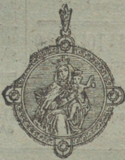
Núm. 2.—34 diamantes y zafiros, imagen de nácar.