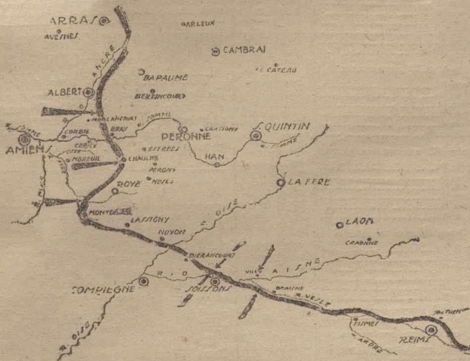
En el gráfico, que abarca la zona Arras-Reims, están señalados los lugares donde se combate, según las partes de última hora.

En la zona del Ancre, del Vesle y del Somme, los tres ríos sangrientos, contraatacan los alemanes