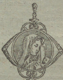
Núm. 3.—4 brillantes y diamantes, imagen de nácar.