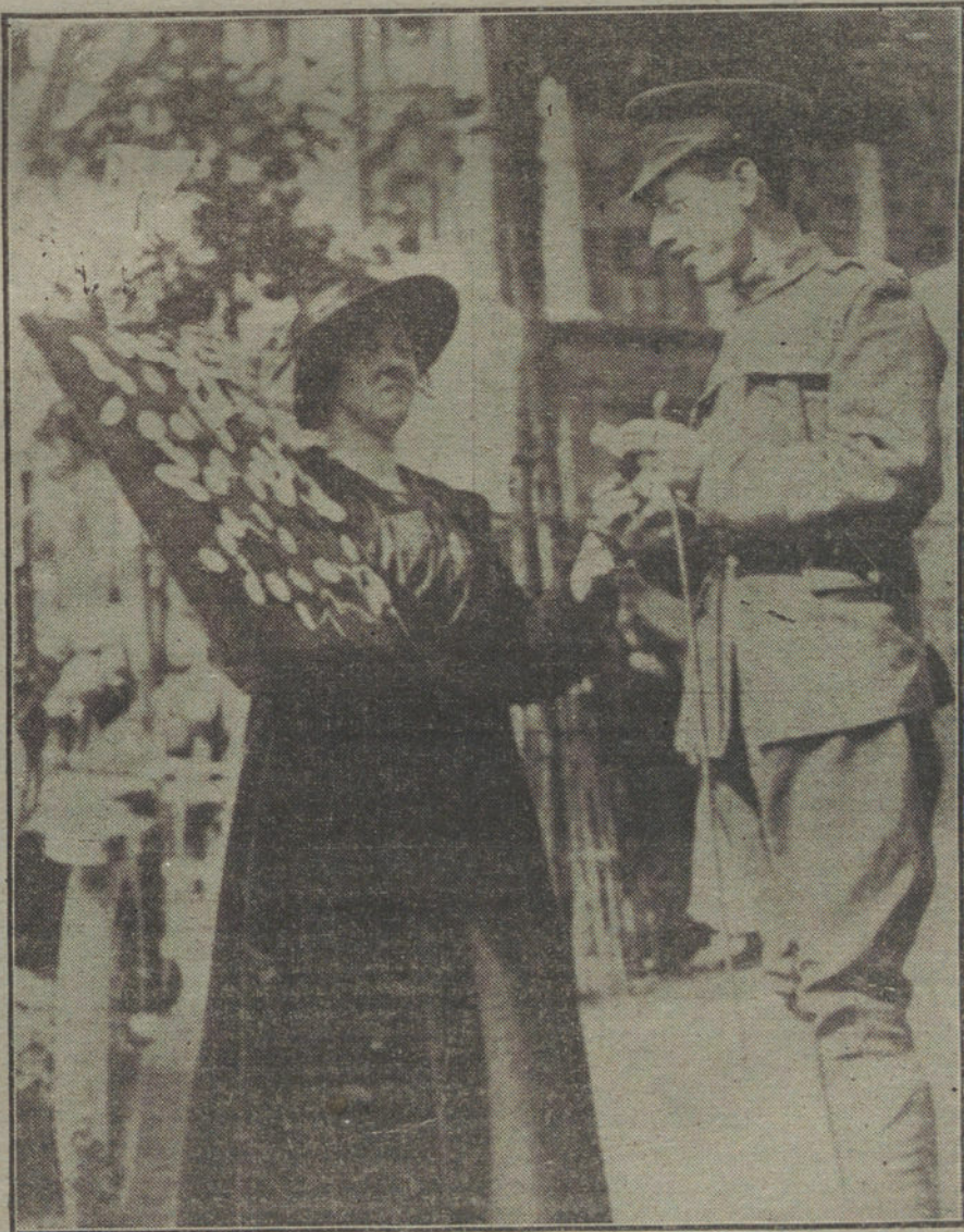
LA FIESTA DE ITALIA EN NUEVA YORK.—Señorita neoyorkina vendiendo á un soldado lazos y medallas en el «día italiano».

Monsieur Long prueba con admirable razonamiento técnico las desventajas del ferrocarril de vía estrecha: retrasos y perjuicios que originan los trasbordos; incapacidad para el tráfico en regiones donde la colonización adquiere cierto desarrollo; dificultades