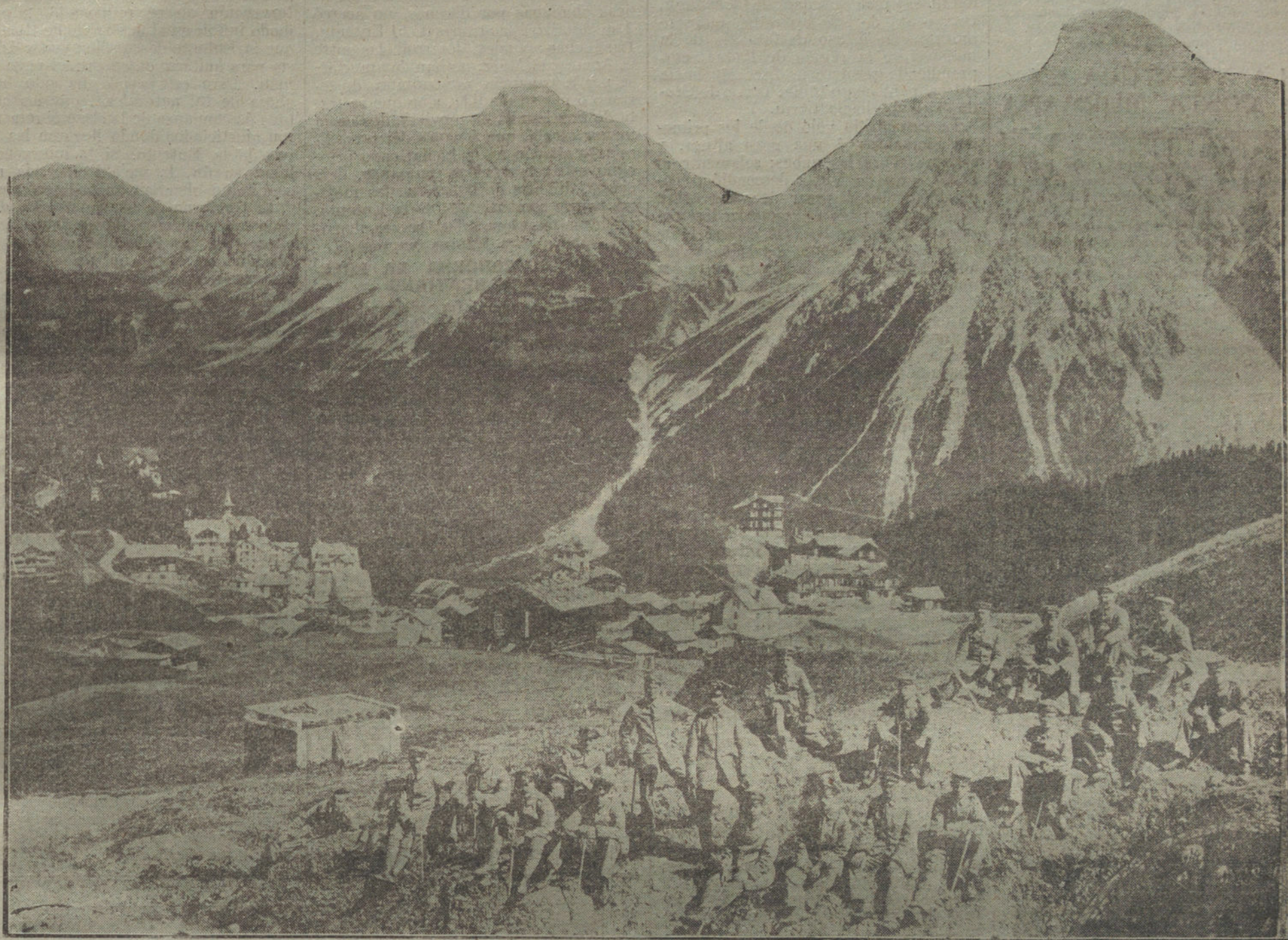
Tropas alemanas alpinas durante un descanso en un reconocimiento.

M. MALVY PROTESTA CONTRA SU CONDENA ANTE EL PRESIDENTE DE LA CAMARA FRANCESA.—LA SITUACION POLITICA Y MILITAR DE RUSIA.—NUEVOS EXITOS SUBMARINOS.—LA LUCHA ENTRE EL ANCRE Y EL OISE.—RADIOGRAMAS DE HOY