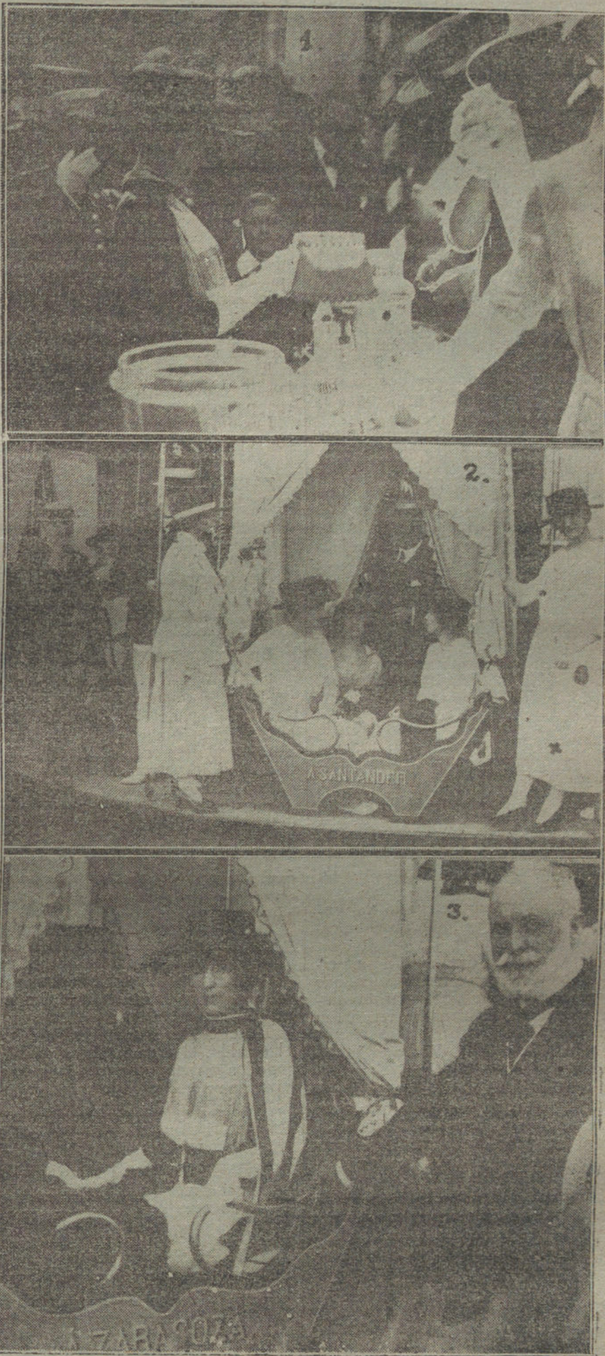
EL VERANO EN SANTANDER.—«Garden-Party» á beneficio de la Cruz Roja, celebrada en la «Quinta Hoppen».—Número 1: S. M. la Reina comprando billetes en la tombola.—Número 2: Las niñas del embajador de Alemania en uno de los recreos instalados en el jardín.—Número 3: S. M. la Reina en el Tio Vivo.