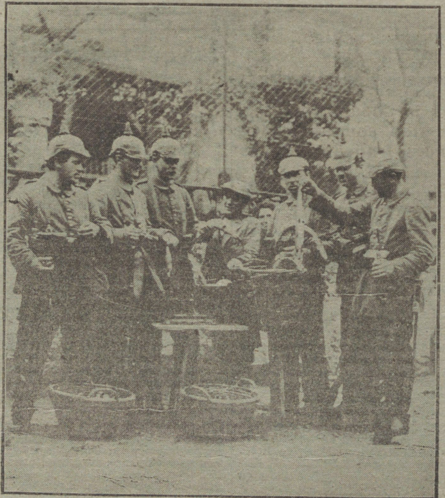
LAS NECESIDADES DE LA GUERRA.—Soldados alemanes comprando pescado en una localidad del Norte de Francia.

Es posible que M. Helfferich sea nombrado para el puesto que dejó vacante el almirante von Hintze.