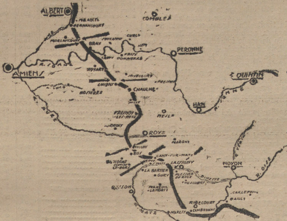
Situación del frente Occidental, donde ha sido detenida por los alemanes la ofensiva aliada, según los despachos de última hora.

PARIS (Torre Eiffel). (13 de Agosto, á las tres de la tarde.)