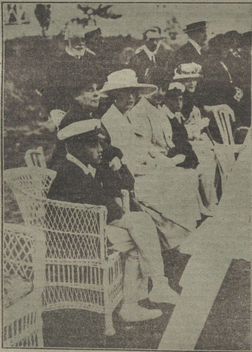
EL VERANO EN SANTANDER.—S. M. la Reina Victoria con sus augustos hijos presenciando los partidos finales del campeonato nacional de tennis.

Los propietarios de fincas deberán hacer é instalar encima de la puerta de entrada de las mismas un foco de luz