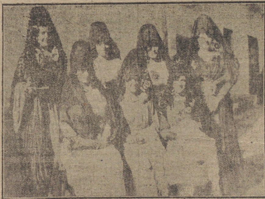
Señoritas de la colonia veraniega que presidieron la becerrada celebrada el domingo último, con motivo de las fiestas del Cristo de la Salud en las Navas.

¿Por qué razón «El Imparcial», que tanto alardeó de periódico renovador, combate á los regionalistas, únicos que desde el Gobierno están desarrollando una política renovadora?