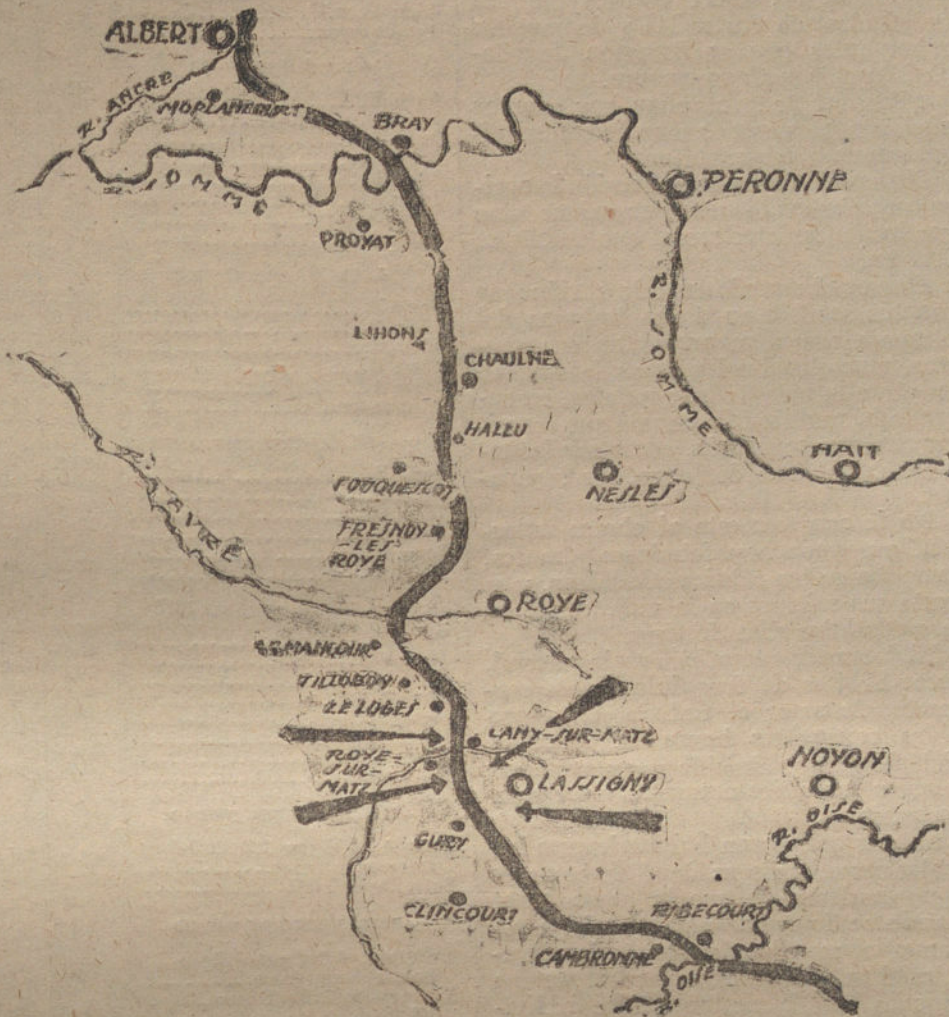
Gráfico del frente occidental con expresiones de los sitios donde, según los últimos partes oficiales, se ha desarrollado mayor actividad.

KOENIGSWUSTERHAUSEN (14 de Agosto, á las tres de la tarde.)