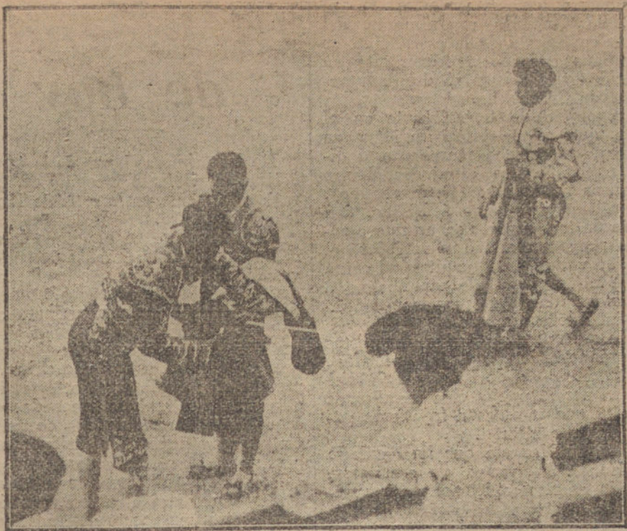
Joselito dando la alternativa a Pacorro en la primera corrida de la Semana Grande de San Sebastián.

cuantos telegramas oficiales, en los que se da cuenta de haberse celebrado mítines obreros en diversas provincias, para conmemorar el aniversario de la huelga general planteada en España el 13 de Agosto del pasado año.