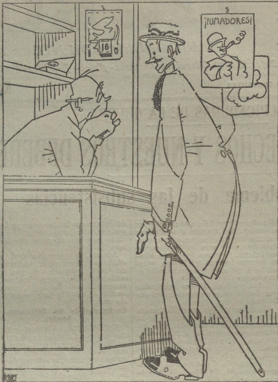
LA FALTA DE TABACO

Parece que el Ayuntamiento de Madrid ofrece todo género de facilidades