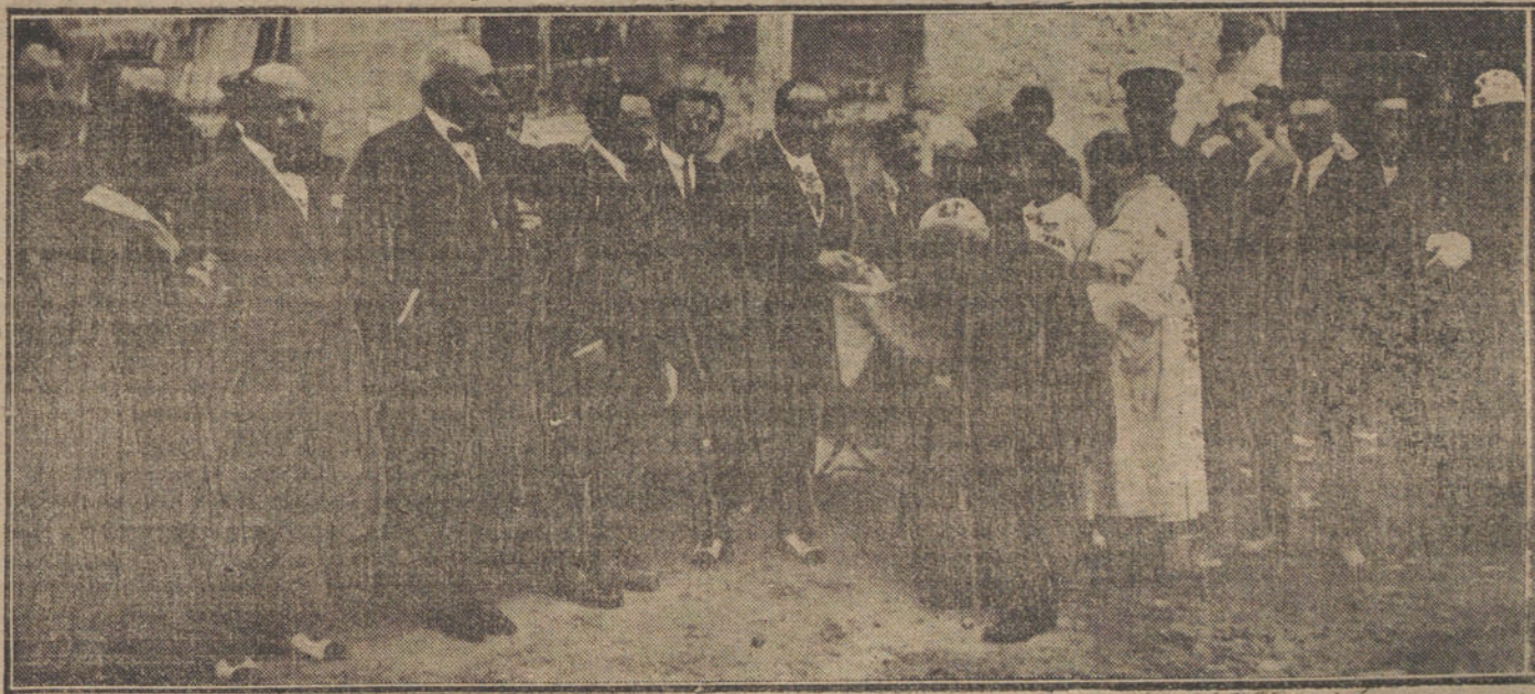
Reparto de comidas y donativos en metálico á los pobres del distrito de la Latina con motivo de la clásica verbena de la Paloma.

Las experiencias serán presenciadas por las autoridades de Marina y oficiales de la escuadra.