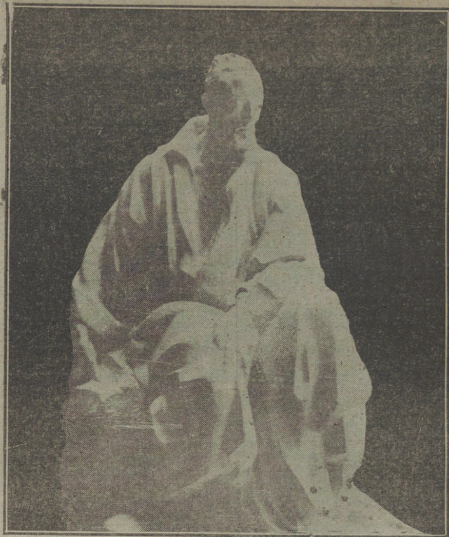
Estatua del doctor Moliner.

El homenaje que su tierra rinde á Moliner es, ante todo, un homenaje á la bondad. La alameda, sitio del emplazamiento, es ya un lugar adecuado. A lo largo del Turia, entre dos fuentes ornamentales, vetustas y magníficas, orillado de bancos de piedra, esmaltado de todos los verdes suculentos de la huerta, se abre la avenida, honda y blanda como un cauce seco.